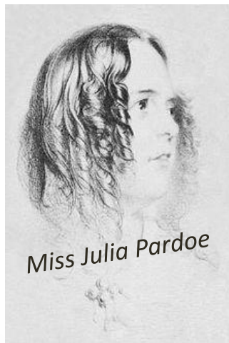
Miss Julia Pardoe