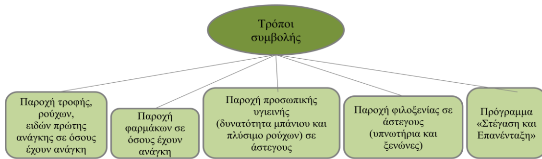
Σχεδιάγραμμα 1: Τρόποι συμβολής των δομών στη διαχείριση της φτώχειας

Πρώτο παράδειγμα, ένας άντρας 17 , ο οποίος δυσκολευόταν να πάρει τα απαραίτητα για την υγεία του φάρμακα. Στη συζήτηση που είχαμε ανέφερε: