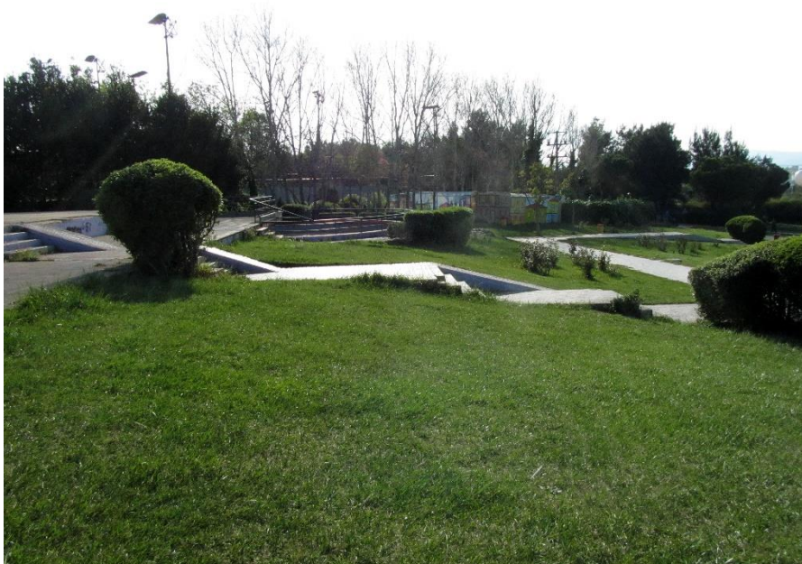
Εικόνα 4: Μερική άποψη Άλσους Γαλατσίου 119 .

Ο Δήμος Γαλατσίου 118 σε άμεσες προτεραιότητες έχει κατατάξει την προστασία της δασικής αναδασωτέας περιοχής μέσω ειδικών ζωνών, καθώς και τη συντήρηση του πρασίνου σε όλους τους κοινόχρηστους χώρους της περιοχής. Σημαντικός παράγοντας για την πραγματοποίηση είναι η χρηματοδότηση από το πρόγραμμα της Ε.Ε. για την ανάδειξη του φυσικού περιβάλλοντος.