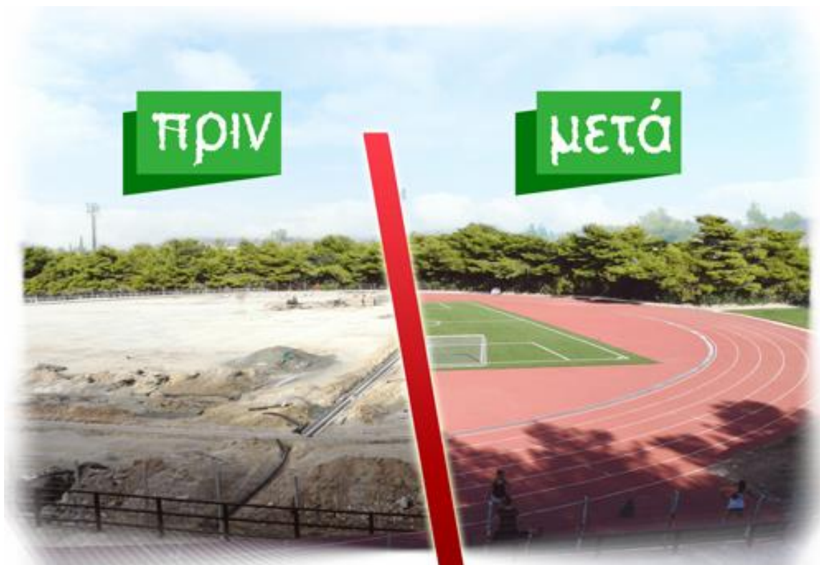
Εικόνες 6 και 7: Αθλητικές δομές Άλσους Γαλατσίου, πριν και μετά 121 .

Εξίσου σημαντική κίνηση είναι και η ευαισθητοποίηση του τοπικού πληθυσμού του Δήμου, μέσα από δράσεις αναδάσωσης και σε συνεργασία με σχολεία, συλλόγους και ιδιωτικούς φορείς.