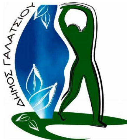
Εικόνα 3: Λογότυπο Δήμου Γαλατσίου 117 .

Κάποιες από τις καινοτόμες δράσεις του Δήμου Γαλατσίου θα περιγράψουμε στο κεφάλαιο που ακολουθεί.