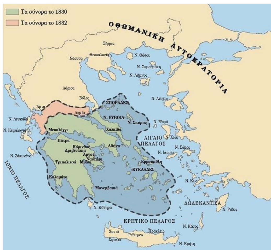
Εικ. 1: Χάρτης Ελλάδας. Σύνορα του Νεοελληνικού Κράτους το 1830 και το 1832 49

προσαρμογής με το αντίστοιχο πολιτικό και κοινωνικό πλαίσιο 47 . Για την επιτυχία των μεταρρυθμίσεων, θα πρέπει να επιτευχθεί η συνύπαρξη μίας γενικότερης τάσης αλλαγής στη διοικητική κουλτούρα 48 .