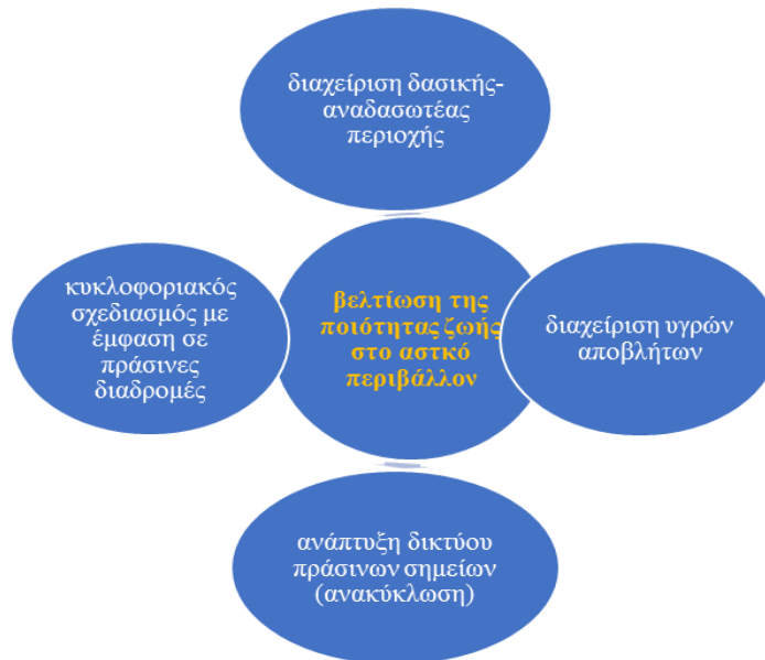
Σχεδιάγραμμα 2: Στρατηγικές βελτίωσης της ποιότητας ζωής στο αστικό περιβάλλον.

Ως τμήμα 122 της μητροπολιτικής περιοχής της Αθήνας ο Δήμος Γαλατσίου, παρουσιάζει προβλήματα, όπως συμβαίνει και στις περισσότερες περιοχές του λεκανοπεδίου. Ένα από αυτά είναι και η παλαιότητα του δικτύου αποχέτευσης ακαθάρτων υδάτων. Ο σχεδιασμός του Δήμου έχει στόχο όλα τα ακίνητα να συνδεθούν με το νέο δίκτυο ακαθάρτων υδάτων, σε συνεργασία με τον αρμόδιο φορέα αποχέτευσης για την περιοχή της Αττικής.