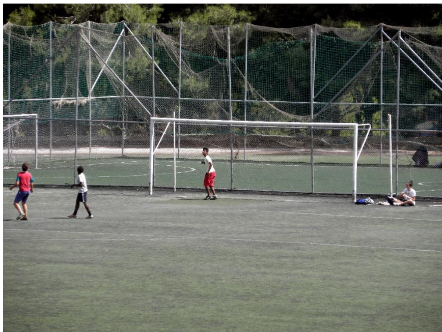
Εικόνα 5: Γήπεδο Άλσους Γαλατσίου 120 .