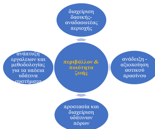
Σχεδιάγραμμα 1: Στρατηγικές στο περιβάλλον και ποιότητα

Επίσης, οι δύο συνεργασίες του Δήμου Γαλατσίου με το Σύνδεσμο Προστασίας Ανάπλασης Πεντέλης (Σ.Π.Α.Π.) και το Σύνδεσμο Προστασίας Ανάπλασης Τουρκοβουνίων (Σ.Π.Α.Τ.) είναι σημαντικές για την ανάδειξη του φυσικού περιβάλλοντος.