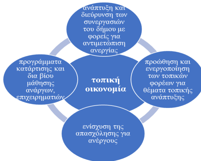
Σχεδιάγραμμα 3: Στρατηγικές στην τοπική οικονομία.

Η προώθηση της απασχόλησης μέσω προγραμμάτων κατάρτισης και διά βίου εκπαίδευσης, η αξιοποίηση χρηματοδοτικών εργαλείων για απορρόφηση πόρων για την υλοποίηση δράσεων ενίσχυσης της απασχόλησης και της τοπικής εμπορικής δραστηριότητας είναι ενέργειες που δρομολογούνται από το Δήμο Γαλατσίου.