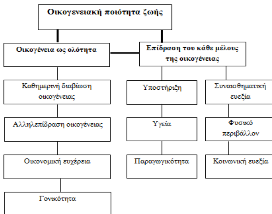
Εικόνα 1. Θεωρητικό μοντέλο οικογενειακής ποιότητας ζωής των Park & Turnbull, 2002. Προσαρμοσμένο στα Ελληνικά, Ζωή Σιούτη, 2017.