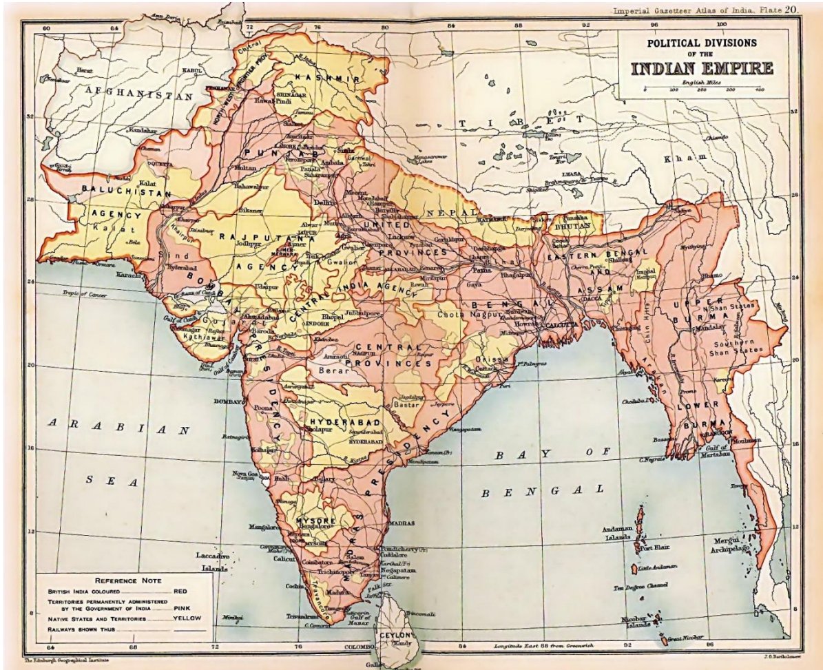
Edinburgh Geographical Institute, 1909 (public domain)