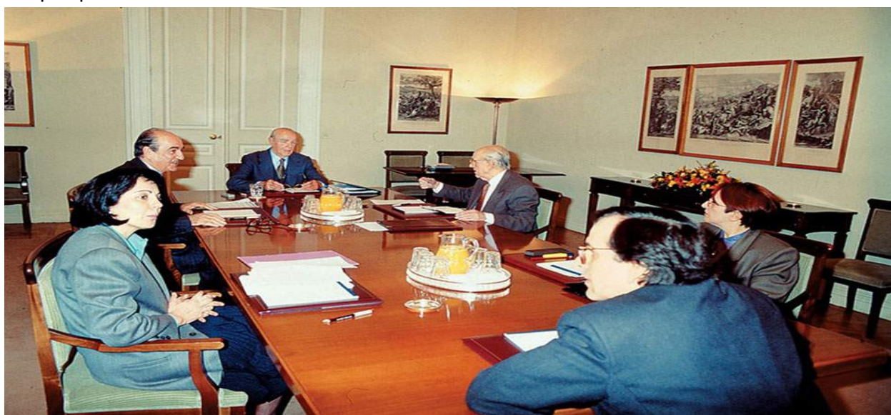
Συμβούλιο αρχηγών 14 Φεβρουαρίου 1992

Στη σύσκεψη των πολιτικών αρχηγών, σύμφωνα με τις δηλώσεις τους, με εξαίρεση την Αλέκα Παπαρήγα, αποφασίστηκε να μη δεχθεί η Ελλάδα ονομασία με τον όρο «Μακεδονία» 200 προσυπογράφοντας έτσι το κεντρικό εθνικό σύνθημα ότι «η Μακεδονία είναι μία και είναι ελληνική». 201