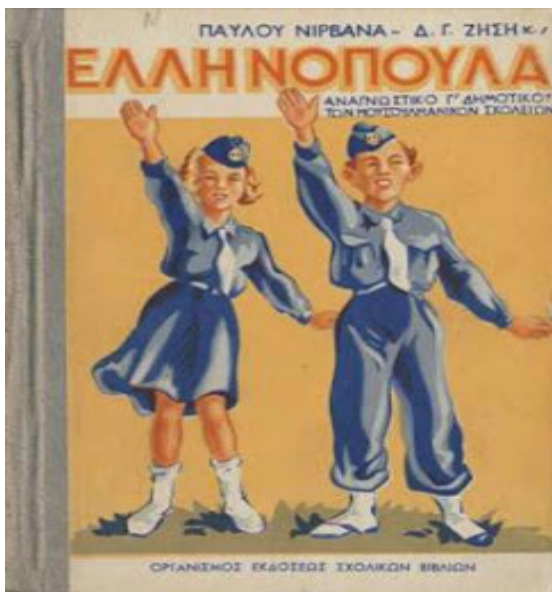
Εικόνα 5. Το αναγνωστικό της Γ' τάξης « Τα Ελληνόπουλα » του Παύλου Νιρβάνα.