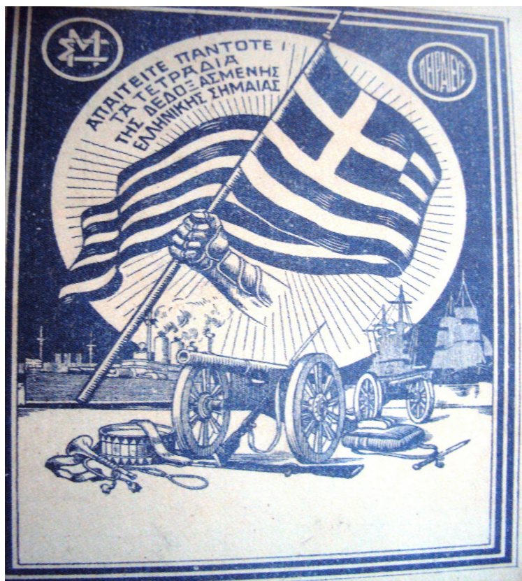
Εικόνα 6. Τετράδιο του καθεστώτος της 4 ης Αυγούστου.