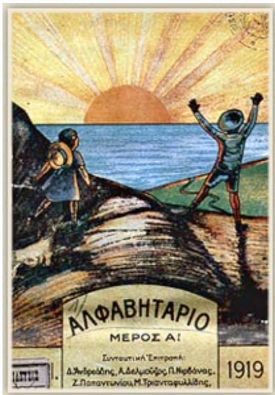
Εικόνα 4. Το «Αλφαβητάριο με τον ήλιο» του 1919.

της δημοτικής γλώσσας στο δημοτικό σχολείο αποκλειστικά για τις τέσσερις πρώτες τάξεις και μαζί με την καθαρεύουσα για τις δύο τελευταίες 250 (βλ. εικόνα 4).