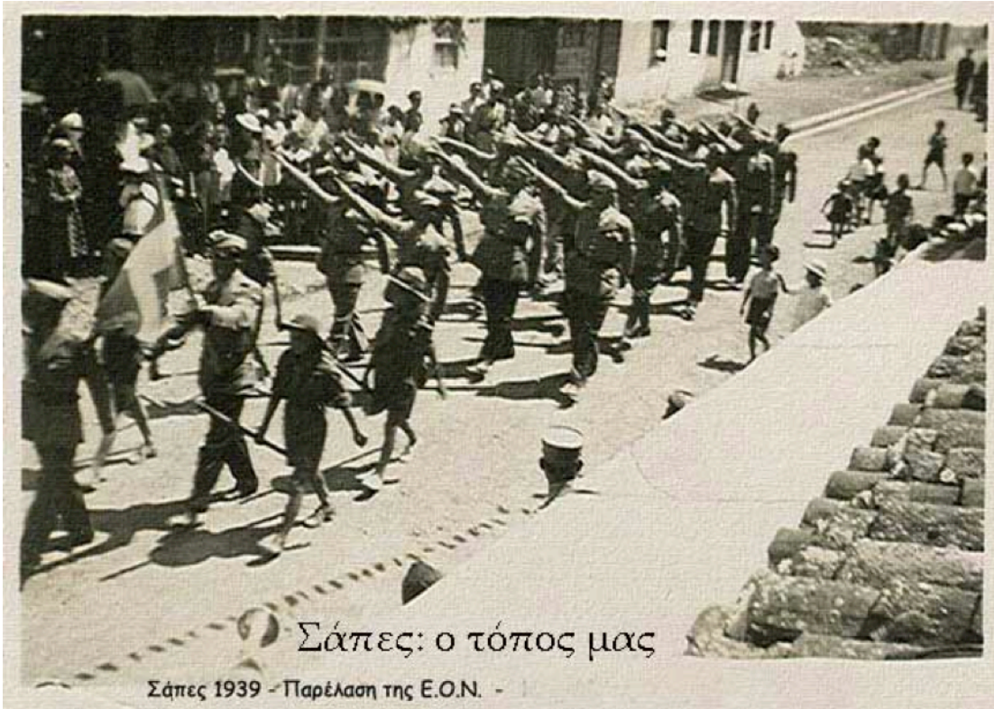
Εικόνα 2. Παρέλαση της Ε.Ο.Ν. (Εθνική Οργάνωσις Νεολαίας) στις Σάπες Ροδόπης, το 1939.

Η συμμετοχή των μαθητών στις παρελάσεις από την περίοδο της δικτατορίας του Μεταξά και μετά είναι πλέον υποχρεωτική. Από τη δεκαετία του 1950 και στη συνέχεια, οι μαθητικές παρελάσεις γίνονται σε όλη την Ελλάδα στο πλαίσιο του εορτασμού των δύο μεγάλων εθνικών επετείων (25 Μαρτίου και 28 Οκτωβρίου) καθώς και σε τοπικές εορτές (π.χ. επέτειος απελευθέρωσης της πόλης, εορτή του πολιούχου αγίου, επέτειος σημαντικών μαχών) ή άλλες σημαντικές ημέρες για τη χώρα ή την πόλη όπου διεξάγονται οι παρελάσεις (π.χ. επιστροφή του βασιλικού ζεύγους μετά από το δημοψήφισμα του 1946, επίσκεψη του Προέδρου της Δημοκρατίας στην πόλη). Στα κινηματογραφικά - βιντεοσκοπημένα τεκμήρια από μαθητικές παρελάσεις που μελετήθηκαν στην παρούσα διατριβή, οι παρελάσεις έγιναν στο πλαίσιο του εορτασμού α) των εθνικών επετείων 25 ης Μαρτίου και 28 ης Οκτωβρίου, β) των επετείων της απελευθέρωσης της πόλης της Θεσσαλονίκης, των Ιωαννίνων, του Κιλκίς, της Ξάνθης, γ) των επετείων της μάχης της Κρήτης, της Φλώρινας, του Κιλκίς, δ) των επετείων ενσωμάτωσης των Δωδεκανήσων και