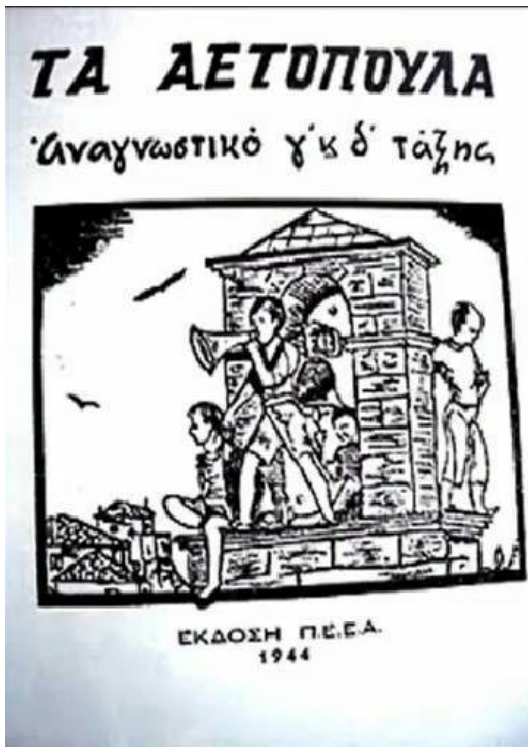
Εικόνα 7. Το αναγνωστικό «Τα αετόπουλα» της Ρόζας Ιμβριώτη.

Κατά την περίοδο του εμφυλίου οι προσπάθειες αυτές διακόπηκαν απότομα. Πολλά σχολεία κλείνουν λόγω έλλειψης χρηματοδότησης, ενώ όσα λειτουργούν ακόμη αντιμετωπίζουν τεράστιες ελλείψεις σε υποδομές και προσωπικό. Σε κάποιες περιοχές οι μαθητές συμμετέχουν στην ανέγερση φυλακίων, προκειμένου να ενισχύσουν την άμυνα του «Εθνικού Στρατού» (βλ. εικόνα 8) 260 .