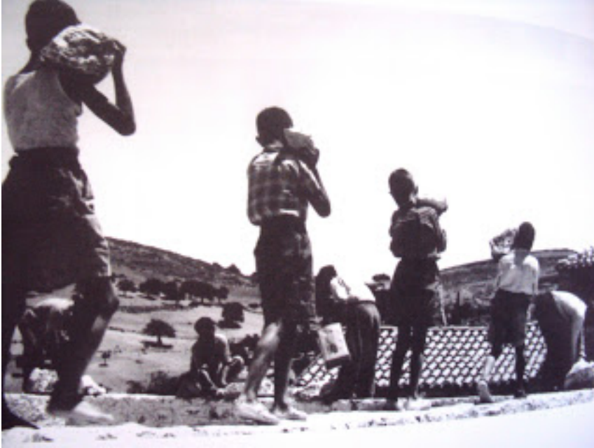
Εικόνα 8. Μαθητές χτίζουν φυλάκιο για τον «Εθνικό Στρατό» κατά τη διάρκεια του εμφυλίου πολέμου.

Στις αρχές της δεκαετίας του 1950 οι ραγδαίες οικονομικές και κοινωνικές αλλαγές υπαγορεύουν ως πανεθνικό αίτημα την εκπαιδευτική μεταρρύθμιση. Όπως χαρακτηριστικά αναφέρει το Παιδαγωγικό Ινστιτούτο: «Οι οικονομικές μεταβολές προκαλούν κοινωνικές μεταβολές που ‘πιέζουν’ το εκπαιδευτικό σύστημα, προκειμένου να αποκτήσει ‘οικονομική αποτελεσματικότητα’, να ενισχύσει τη λειτουργία απόκτησης προσόντων και να προσδώσει στις αποκτούμενες γνώσεις λειτουργικότητα. Οι νέοι θα έπρεπε να αποκτήσουν επαγγελματικά εφόδια, για να ενταχθούν παραγωγικά στις διαμορφούμενες νέες οικονομικές συνθήκες» 261 . Όμως και πάλι οι πολιτικές εξελίξεις οδήγησαν την εκπαίδευση σε επιστροφή στα προπολεμικά πρότυπα. Ο καθηγητής Αμίλκας Αλιβιζάτος, το 1947, σε ένα κείμενό του για τα «Πανεπιστημιακά Προβλήματα» αναφέρεται στην «επί διετίαν τώρα επιμελώς καταβαλλομένη προσπάθεια επιστροφής εις τας παλαιάς γραμμάς κατευθύνσεως της εκπαιδεύσεως, εις τον παλαιόν ρυθμόν και τας παλαιάς μεθόδους». Πράγματι, με τον Νόμο 838 του 1948 επιβάλλεται ο εκπαιδευτικός συγκεντρωτισμός και η ομοιομορφία σε όλη τη χώρα, μαζί και στις περιοχές που