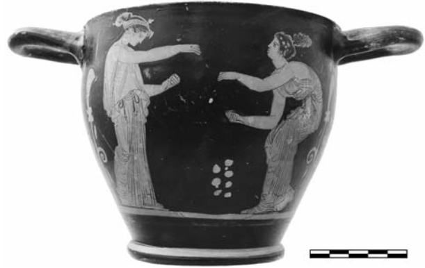
Εικ. 2. ΑΜΘ 1311. Ερυθρόμορφος σκύφος του Ζωγράφου της Κύλικας της Ερέτριας. Β΄ όψη.