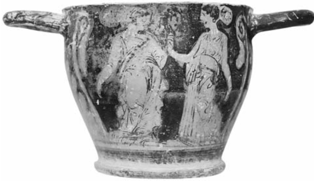
Εικ. 9. ΑΜΘ 11665. Ερυθρόμορφος σκύφος του Ζωγράφου της Θεσσαλονίκης 11665. Α΄ όψη.