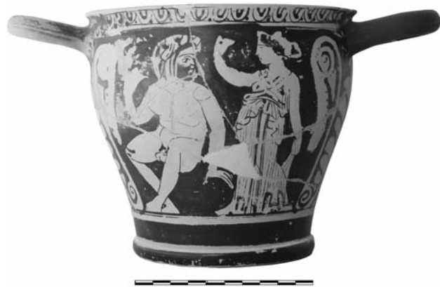
Εικ. 8. AMΠ 241. Ερυθρόμορφος σκύφος του Ζωγράφου του Ρίτσου. Α' όψη.

Ερέτριας (εικ. 3). Εξάλλου, στον πρώτο (εικ. 7) βλέπουμε εικονογραφικά και τεχνοτροπικά στοιχεία γνωστά από τον Ζ. της Κύλικας της Ερέτριας: πρόκειται για το μοτίβο της κατά τομή πεπλοφόρου μορφής με τη γερμένη μπροστά πλάτη (που κρατά