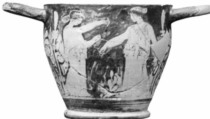
Εικ. 6. AMΠ-Λ710. Ερυθρόμορφος σκύφος του Ζωγράφου της Κύλικας της Ερέτριας. Α΄ όψη (φωτ. Μουσείου, © Υπουργείο Πολιτισμού και Αθλητισμού/Ταμείο Αρχαιολογικών Πόρων).

τρινος με μίκα (λιγοστή στα συγκεκριμένα αγγεία) 18 . Πάνω σε αυτόν ο αγγειογράφος τοποθέτησε ένα ζεστό ανοιχτό καστανό έως καστανοκόκκινο επί-χρυσμα 19 , το οποίο και παροδήγησε τους Gex και McPhee ως προς το πραγματικό χρώμα του πηλού των αγγείων αυτών.