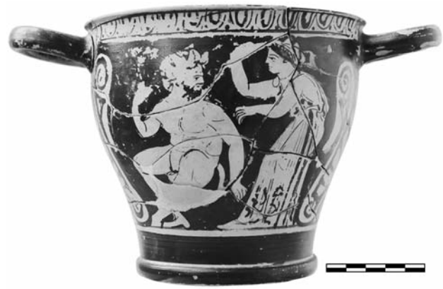
Εικ. 7. AMΘ 1369. Ερυθρόμορφος σκύφος του Ζωγράφου του Ρίτσου. Α' όψη (φωτ. Ο. Κουράκης, © Υπουργείο Πολιτισμού και Αθλητισμού/Ταμείο Αρχαιολογικών Πόρων).

Ο Ζ. της Κύλικας της Ερέτριας δεν θα πρέπει να επισκέφθηκε απλώς τη Χαλκιδική ως περιοδεύων τεχνίτης, αλλά να εγκαταστάθηκε εκεί, κρίνοντας από την επιρροή του στη σύγχρονη ερυθρόμορφη χαλκιδικιώτικη αγγειογραφία. Για παράδειγμα, οι δύο περίπου σύγχρονοι σκύφοι του Ζ. του Ρίτσου AMΘ 1369 (εικ. 7) 31 και AMΠ 241 (εικ. 8) 32 , φέρουν παράσταση Σατύρου και Μαινάδας, πανομοιότυπη και στις δύο όψεις, εμπνευσμένη ίσως από το θέμα του σκύφου AMΘ 10322 του Ζ. της Κύλικας της