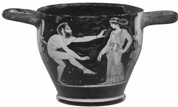
Εικ. 3. ΑΜΘ 10322. Ερυθρόμορφος σκύφος του Ζωγράφου της Κύλικας της Ερέτριας. Α΄ όψη (φωτ. Ο. Κουράκης, © Υπουργείο Πολιτισμού και Αθλητισμού/Ταμείο Αρχαιολογικών Πόρων).