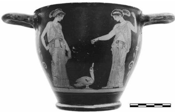
Εικ. 1. ΑΜΘ 1311. Ερυθρόμορφος σκύφος του Ζωγράφου της Κύλικας της Ερέτριας. Α΄ όψη.

Ενώ τα δύο αγγεία αρχικά συσχετίστηκαν με το χαλκιδικιώτικο εργαστήριο 14 , εν συνεχεία αποσυνδέθηκαν από αυτό και αποδόθηκαν στο ευβοϊκό, μαζί με τρία ακόμη έργα: α) ένα τμήμα κύλικας από την Ερέτρια, στο Μουσείο της Ερέτριας 2714-V 3866, που χάρισε στον αγγειογράφο το όνομά του και φέρει εσωτερικά παράσταση Έρωτα και γυναικείας μορφής, και εξωτερικά γυμνό άνδρα και γυναικεία μορφή εκατέρωθεν του ανθεμωτού συμπλέγματος της λαβής, β) την ονομαζόμενη υδρία Tozzi, με παράσταση μουσικής σκηνής σε γαμήλια συμφραζόμενα, και, γ) τον γαμικό λέβητα (τύπου 2) στη Βοστώνη MFA 93.107, επίσης από την Ερέτρια κατά δήλωση του πωλητή του, με παράσταση