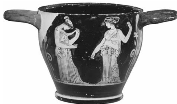
Εικ. 4. ΑΜΘ 10322. Ερυθρόμορφος σκύφος του Ζωγράφου της Κύλικας της Ερέτριας. Β΄ όψη.