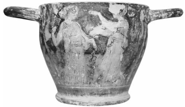
Εικ. 10. ΑΜΘ 11665. Ερυθρόμορφος σκύφος του Ζωγράφου της Θεσσαλονίκης 11665. Β΄ όψη.

κάποιο αντικείμενο αποδοσμένο με επίθετο λευκό χρώμα 33 ), τον σάκκο που καλύπτεται από τους βοστρύχους του μετώπου, καθώς και τις δύο πλατιές μελανές κάθετες ρίγες για την απόδοση του ανοίγματος του πέπλου 34 . Το τελευταίο στοιχείο απαντά και στον σκύφο του Πολυγύρου ΑΜΠ 241 (εικ. 8).