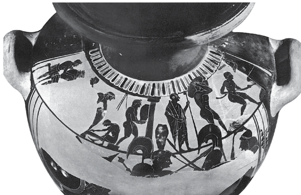
Εικ. 1. Τεχνίτης τροφοδοτεί έναν κεραμικό κλιβανο, στη θόλο του οποίου έχει αναρτηθεί ένα μεγάλο ανάγλυφο γενειοφόρο προσωπίο (Ηφαιστος;). Λεπτομέρεια από πολυπρόσωπη απεικόνιση εργαστηρίου κεραμικής στον ώμο αττικής μελανόμορφης υδρίας της Ομάδας του Λεάγρου, 520-510 π.Χ. Μόναχο, Staatliche Antikensammlungen, αρ. 1717. BAPD 302031 (από: Χατζηδημητρίου 2005, πίν. 10, Κ39).

Η όπτηση σε ένα ξυλόκαυστο καμίνι ήταν μια πολύωρη και κουραστική διαδικασία, που απαιτούσε μεγάλη εμπειρία και προσοχή, έτσι ώστε να μην πάει χαμένος ο κόπος εβδομάδων, ίσως και μηνών. Όπως έγραψε ένας νεότερος κεραμίστας: «Με την πυράκτωση όλα