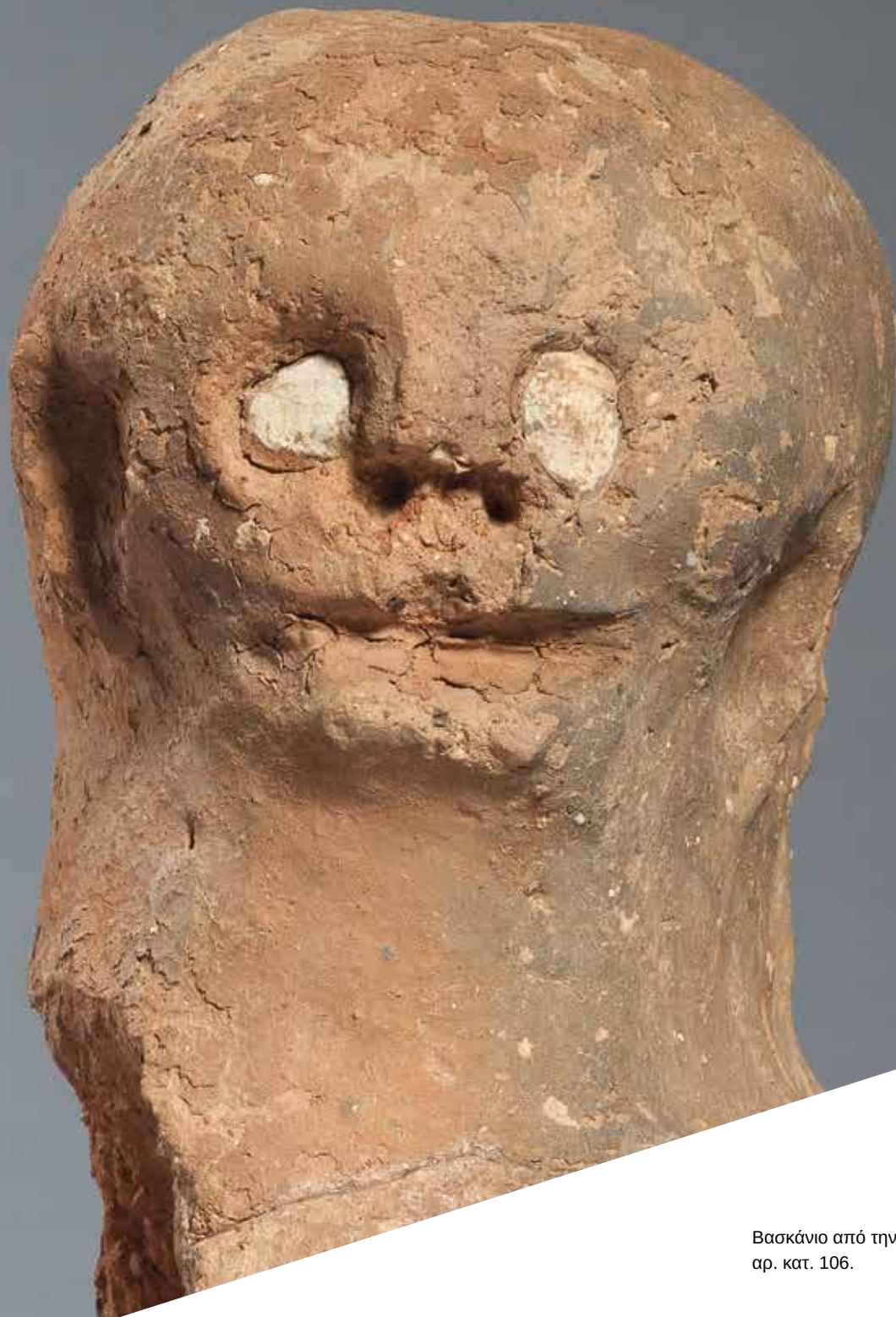
Βασκάνιο από την Ευρωπό Κιλκίς, αρ. κατ. 106.