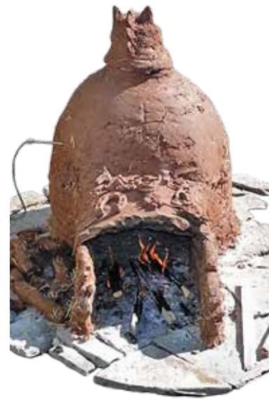
Εἰκ. 3. Σύγχρονα πήλινα βασκάνια ἐπάνω στὴν εἰσόδο τροφοδοσίας ἐνὸς πειραματικοῦ κεραμικοῦ κλιβάνου (Ἀρχεῖο ΑΜΘ).

Οἱ δυσκολίες τῆς χειρωνακτικῆς ἐργασίας, ὁ φόβος γιὰ τὴν κακοδαίμονία καὶ τὸ «κακό μάτι» καὶ, ἴσως πᾶν ἀπὸ ὅλα, ἡ δυσκολία τῆς ἀναμέτρησης με τὴ φωτιά δὲν χαρακτηρίζουν μόνον τὴν ἀρχαιότητα. Σὲ παραδοσιακά καμίνια τῶν νεότερων χρόνων βλέπουμε πολὺ συχνὰ χριστιανικοὺς σταυροὺς ζωγραφισμένους πᾶν ὡς τοιχώματα ἢ ἀναρτημένους κοντὰ στὴν εἰσόδο 9 . Ἐναν τέτοιο σταυρὸ σχεδίασε με τὸ δάχτυλό του ἐπάνω στὸν υγρὸ ἀκόμη πηλὸ ἐνὸς πειραματικοῦ κλιβάνου κεραμικῆς, που κατασκευάσαμε τὸ 2010 στὸ Ἀρχαιολογικὸ Μουσεῖο Θεσσαλονίκης, ὁ παλαιὸς παραδοσιακὸς κεραμίστας Σίμος Βαρδαξῆς, με καταγωγή ἀπὸ τὴν Κιουτάχεια τῆς Μικρᾶς Ἀσίας 10 . Καὶ κατόπιν, μαζί με τοὺς νεότερους συναδέλφους τοῦ κεραμίστα, ἐπλασαν καὶ τοποθέτησαν μικρὰ πήλινα βασκάνια ἐπάνω στὸν μπάτο τοῦ καμινού, ὅπως ἔκαναν καὶ οἱ ἀρχαῖοι ὁμότεχοί τους: ἕνα πέταλο γιὰ γούρι καὶ μερικὰ δὺςμορφα ἀνθρώπινα ὁμοιώματα καὶ μάσκες (εἰκ. 3).