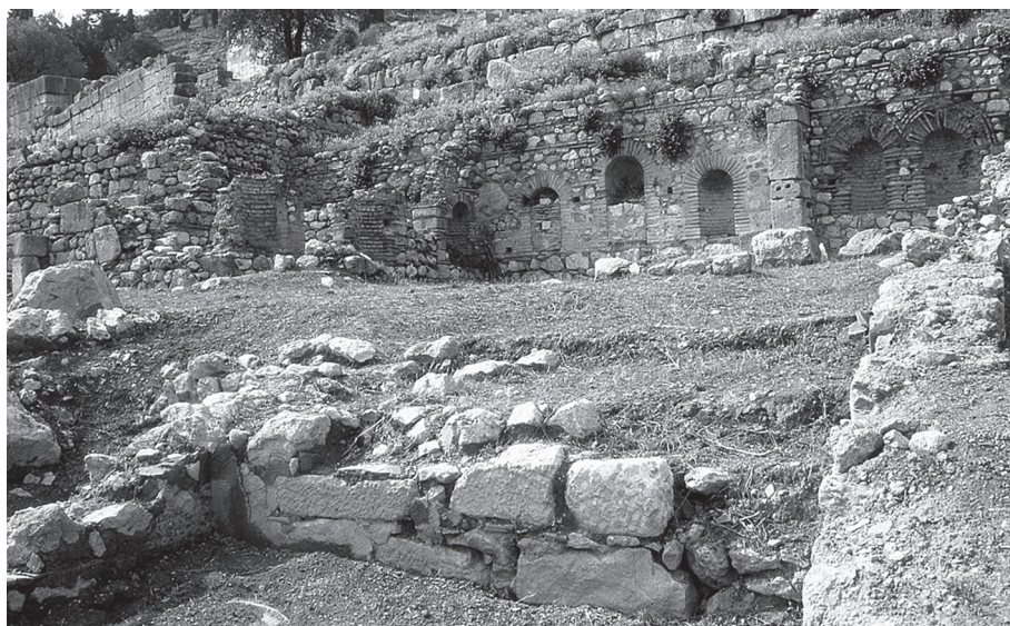
Εικ. 5: Δελφοί, Νοτιοανατολική Έπαιλη: μερική άποψη.