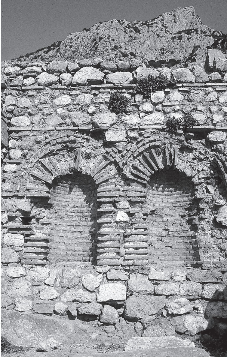
Εικ. 1: Δελφοί, Νοτιοανατολική Έπαυλη: επάλληλες κόγχες.