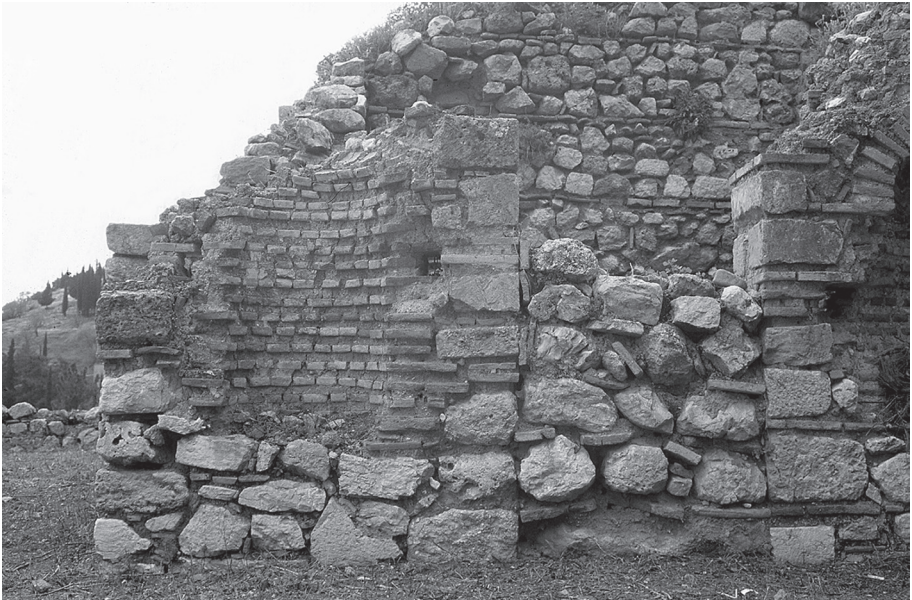
Εικ. 4: Δελφοί, Νοτιοανατολική Έπαυλη: φράξιμο θυρών μετά την εγκατάλειψη της έπαυλης ως τόπου κατοικίας.