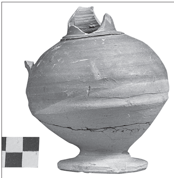
Εικ. 6: Στρεβλό αγγείο από τον αποθέτη των κεραμικών εργαστηρίων που εγκαταστάθηκαν στον χώρο της Νοτιο-ανατολικής Έπαιλης των Δελφών.