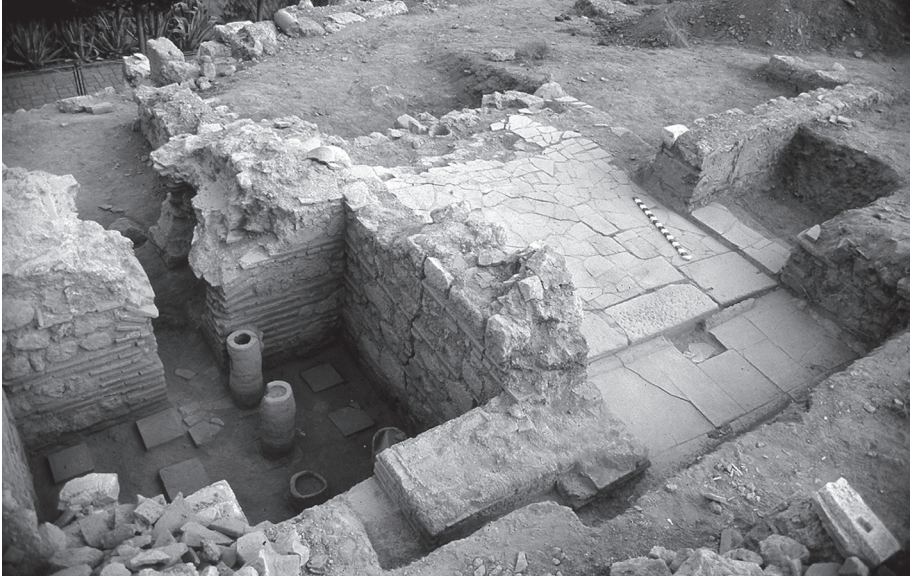
Εικ. 3: Δελφοί, Νοτιοανατολική Έπαυλη: λουτρά, γενική άποψη. Διακρίνονται αριστερά το υπόκαυστο, ο θερμός λουτήρας και το praeefurnium και δεξιά ο χώρος του αποδυτηρίου.