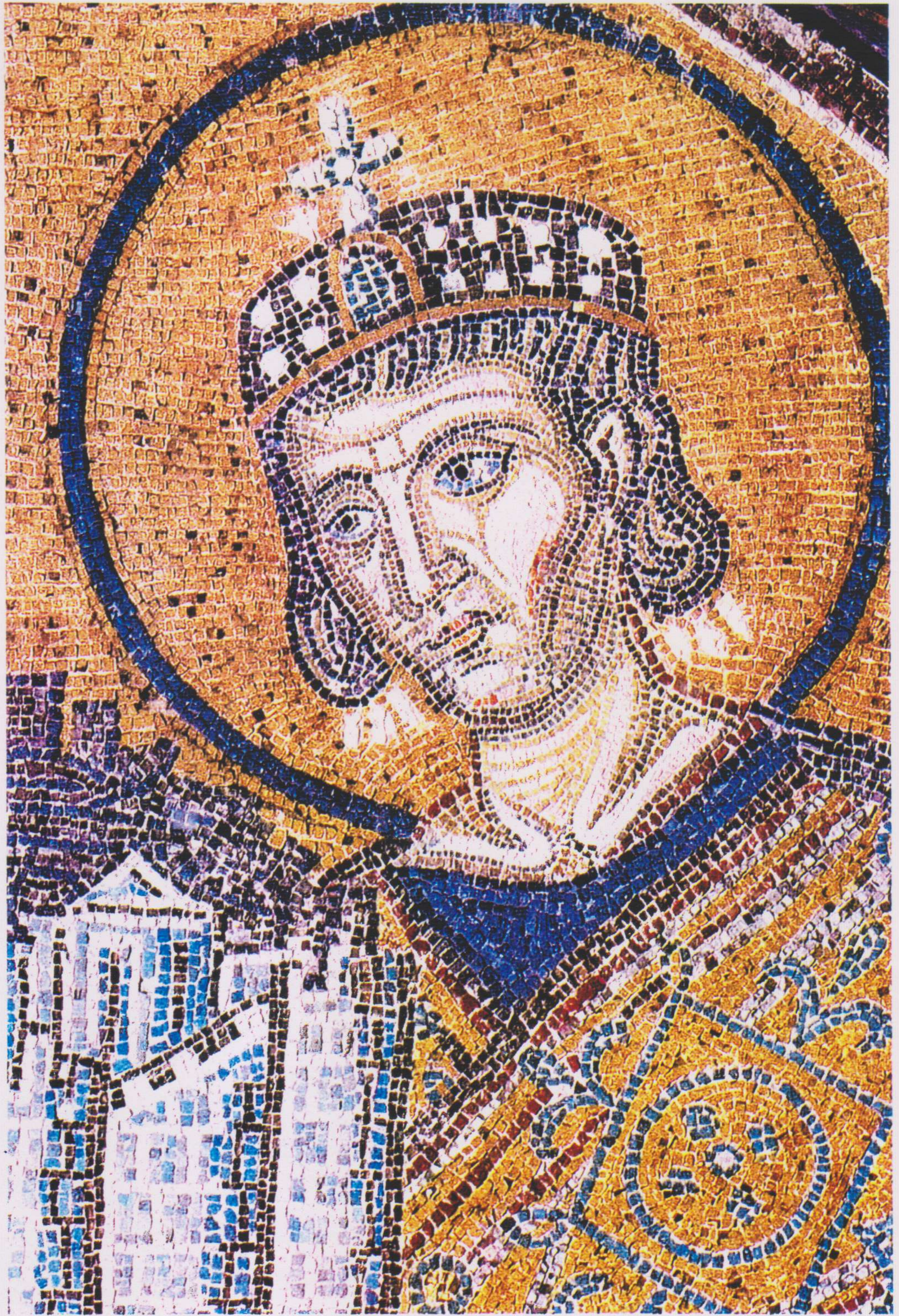
Constantino ofreciendo la ciudad de Constantinopla a la Virgen. Detalle del mosaico del nártex, vestíbulo sur de Santa Sofía, hacia el año 1000.