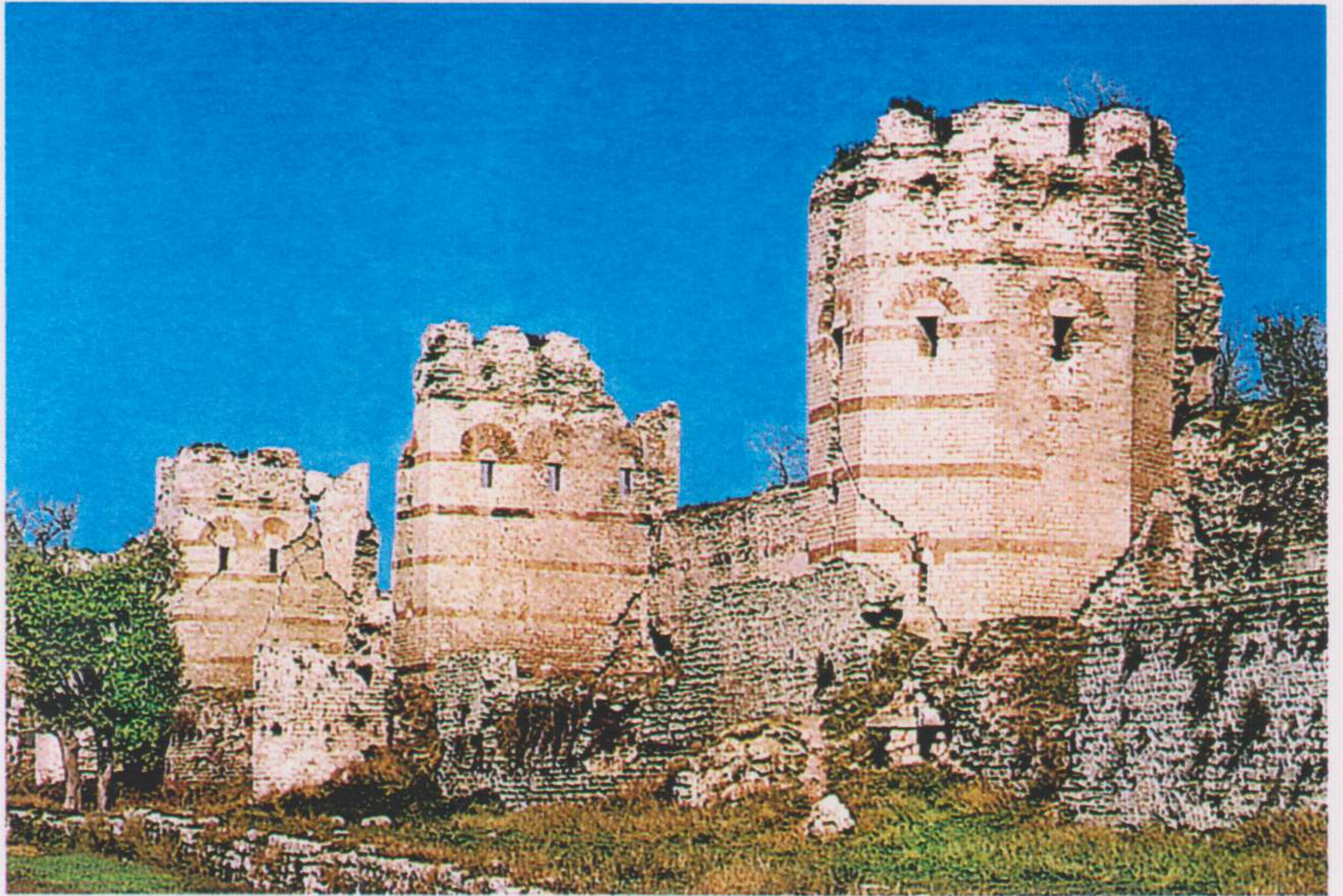
Murallas de Teodosio II.

La decadencia de la vida urbana, documentada prácticamente en todas las ciudades de la provincia, se constata también en Constantinopla a partir del siglo VII. La