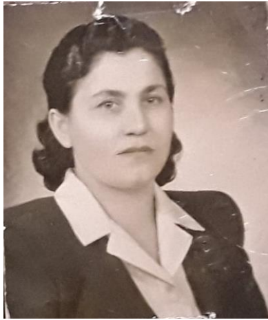
Το Ημερολόγιο της Περιφερειακής Διοίκησης Ε.Ο.Ν. Θηλέων Μεσσηνίας