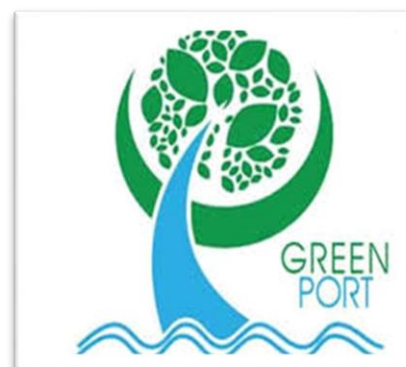
Εικόνα 4 : Πράσινο Λιμάνι