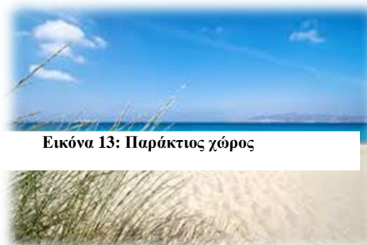
Εικόνα 13: Παράκτιος χώρος

Οι ακτές, ως ένας ευρύς ενιαίος φυσικός χώρος, εκτός από ένα πολύτιμο φυσικό πόρο, συνιστούν και ένα πολύτιμο πολιτιστικό αγαθό – οπτικό πόρο, όπου η χερσαία και η θαλάσσια ζώνη τελεί σε στενή αλληλεπίδραση και η χλωρίδα και η πανίδα σε στενή λειτουργική αλληλεξάρτηση, οποίος χρήζει ιδιαίτερης νομικής προστασίας που επιβάλλει την