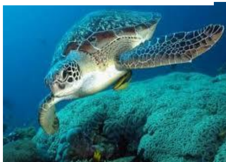
Εικόνα 15 : Χελώνα καρέτα-καρέτα

Πυρήνας της αρχής της ήπιας ανάπτυξης είναι η διάκριση σε συνήθη και ευπαθή ή ευαίσθητα οικοσυστήματα. 21 Μεταξύ της αβάτου φύσεως και των οικοσυστημάτων που φέρουν το βάρος των ανθρωπογενών συστημάτων υπάρχει η ενδιάμεση κατηγορία των ευπαθών ή «ευαίσθητων» οικοσυστημάτων, που επιδέχονται μεν την συνύπαρξη με τα ανθρωπογενή συστήματα αλλά απορρυθμίζονται ευχερώς υπό την τυχόν δυσμενή επίδραση των τελευταίων. Λέγονται ευπαθή, γιατί προσβάλλονται εύκολα και άρα είναι άξια προστασίας. Τα οικοσυστήματα αυτά προστατεύονται, ευθέως από τη διάταξη του άρθρου 24 παρ. 1 του Συντάγματος, αλλά και από τη συνθήκη του Μάαστριχτ για την Ευρωπαϊκή Ένωση, όπως αυτή ερμηνεύεται από τη Διακήρυξη του Ρίο και την Οδηγία 92/43/ΕΟΚ «Natura 2000». Τέτοια είναι οι ακτές, ο αιγιαλός, οι λίμνες, τα μικρά νησιά κ.τ.λ .