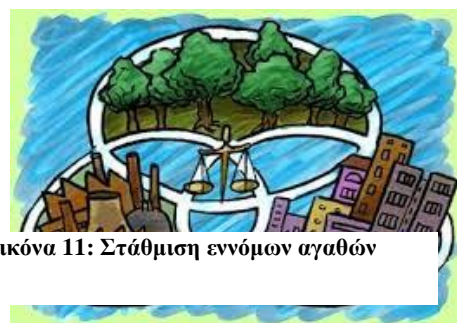
Εικόνα 11: Στάθμιση εννόμων αγαθών

Από την θεωρία και την νομολογία υποστήριξης της αρχής της βιώσιμης ανάπτυξης, 18 προκύπτουν τα ακόλουθα νομικά στοιχεία, τα οποία συνθέτουν