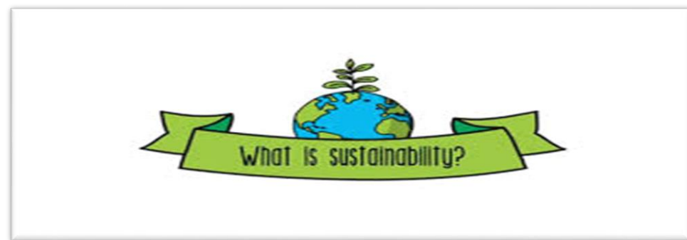
Εικόνα 12 : Περιεχόμενο Βιώσιμης Ανάπτυξης

Το νέο περιβαλλοντικό δίκαιο εδράζεται πάνω στον θεμελιώδη κανόνα της βιώσιμης ανάπτυξης. Απαιτεί ένα συμβιβασμό μεταξύ περιβαλλοντικής προστασίας και της οικονομικής αναπτύξεως. Ιδανικά η Σολομώντεια μέθοδος θα ήταν η εξής: για ότι καταναλώνει η σημερινή κοινωνία να έχει την μέθοδο να αποζημιώνει τις μελλοντικές γενεές με τον ίδιο τρόπο, ώστε να η κατανάλωση του σήμερα να μην είναι εις βάρος του αύριο. 19