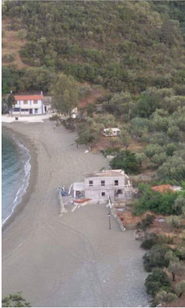
Εικόνα 8: Αυθαίρετο κτίσμα σε παραλία και πιθανόν σε δασική περιοχή