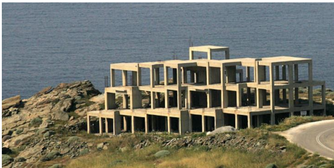
Εικόνα7: Αυθαίρετη κατασκευή σε παραλία

Τεχνικά έργα επί της παραλίας, των ακτών και του αιγιαλού μπορούν να κατασκευάζονται μόνο εφόσον η φύση του έργου είναι δημοσίου συμφέροντος και τηρούνται οι όροι προστασίας της ακτής ως ουσιώδους στοιχείου του φυσικού περιβάλλοντος, σε αντίθετη δε περίπτωση τα επί του αιγιαλού, παραλίας ή εντός της θάλασσας ανεγερθέντα κτίσματα είναι αυθαίρετα και κατεδαφιστέα σύμφωνα και με την νομολογία του Συμβουλίου της Επικρατείας(ΣτΕ 3983/10).