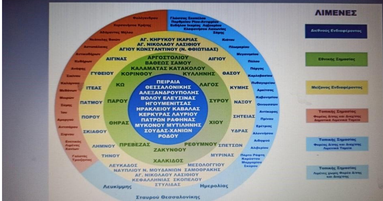
Εικόνα 2: Κατάταξη Λιμένων