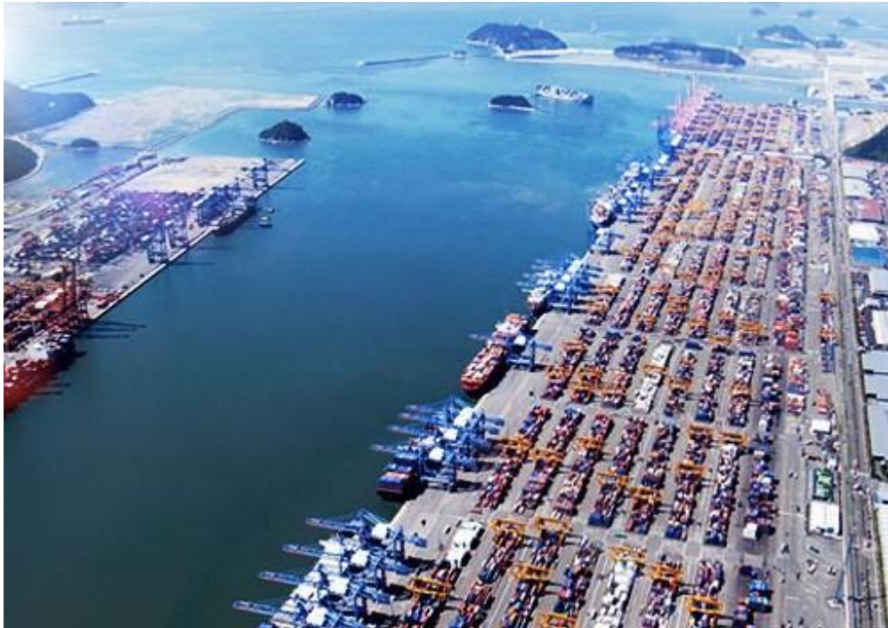
Εικόνα 1: Εμπορικός λιμένας

Οι λιμένες ανάλογα με τη σημασία τους και με κριτήρια την επίδραση τους στις θαλάσσιες μεταφορές και τη γεωστρατηγική τους σημασία και τις προοπτικές ανάπτυξης τους, 10 διακρίνονται σε: