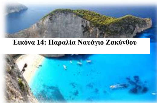
Εικόνα 14: Παραλία Νανάγιο Ζακύνθου

Οι παράκτιες ζώνες κινδυνεύουν τόσο από την άναρχη τουριστική ανάπτυξη, την πληθώρα επισκεπτών και την δημιουργία εγκαταστάσεων (λιμάνια, ξενοδοχεία, εστιατόρια κ.τ.λ.) για την εξυπηρέτησή τους, όσο και από την απρογραμματίστη οικονομική εκμετάλλευση του φυσικού τους πλούτου (αλιεία, ιχθυοκαλλιέργεια). (Καράκωστα, 2011)