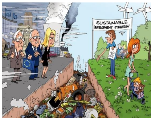
Εικόνα 10: Στρατηγική Βιώσιμης Ανάπτυξης

Με την Συνθήκη του Άμστερνταμ αναγορεύτηκε σε καταστατική αρχή της ΕΕ, όπου και υιοθετήθηκε η αρχή της ενσωμάτωσης και της βιώσιμης ανάπτυξης, έτσι ώστε όλες οι τομειακές πολιτικές για να είναι αειφόρες θα πρέπει να ενσωματώνουν την περιβαλλοντική παράμετρο, υπό το φως και της αρχής της βιώσιμης ανάπτυξης. Με ενάργεια αποτυπώθηκε στα κείμενα του πρωτογενούς