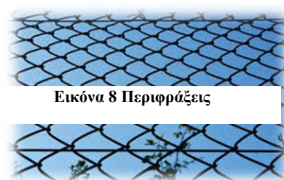
Εικόνα 8 Περιφράξεις

Η άποψη αυτή φαίνεται ορθολογική, εδραζόμενη στο λογικό επιχείρημα ότι η πρόσβαση στη θάλασσα εξασφαλίζεται εξ ίσου αποτελεσματικά με την πρόβλεψη της κατά διαστήματα διάνοιξης οδών στην περίφραξη, προκειμένου να είναι δυνατή η πρόσβαση στην ακτή.(Σιούτη, 2018)