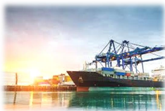
Εικόνα 5 Εμπορικό Λιμάνι Πειραιά

Οι Niemann και Werner (2016) τονίζουν πως για τα λιμάνια, για την επίτευξη της βιωσιμότητας σημαντικό ρόλο έχει το περιβάλλον και πως αυτό θα διαχειριστεί. Είναι σημαντικό το υδάτινο στοιχείο να διατηρηθεί σε καλή κατάσταση αλλά ταυτόχρονα μέσω του σχεδιασμού χρειάζεται και να ενισχυθεί. Εκτός αυτού, χρειάζεται να κατανοηθεί πως τα λιμάνια πρέπει να γίνουν ένα βασικό αναπόσπαστο κομμάτι της πόλης για να είναι δυνατή η εξέλιξη και η βελτίωση τόσο της ίδιας της πόλης αλλά και του λιμανιού.