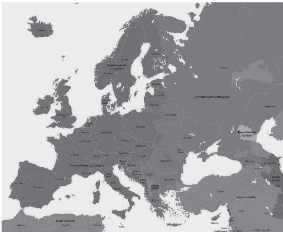
Χάρτης 2: Οἱ θρησκείες στὴν Εὐρώπη.

Ἄς δοῦμε ὅμως τώρα ἓνα δεύτερο Χάρτη. Τὸν κατωτέρω Χάρτη 2. Μὲ κόκκινο χρῶμα παρατηροῦμε τὶς χώρες μὲ ὀρθόδοξο θρησκευτικο-πολιτισμικὸ ὑπόστρωμα. Παρατηροῦμε «ἓνα νοητὸ σύνορο ποὺ διατρέχει τὸν Εὐρασιατικὸν χώρον ἀπὸ τὴν Ρίγα ἕως τὸ Σπλίτ, ἀπὸ τὶς Βαλτικὲς χώρες μέχρι τὴν Ἀδριατικὴ. Μιὰ γραμμὴ ποὺ ἐξηγεῖ πολλὰς διαφορὰς καὶ συγκρούσεις μέχρι τὴν παρούσα συγκυρία. Ἐξηγεῖ καὶ ἀρκετὰς σφαίρες ἐπιρροῆς, π.χ. διαχωρίζει τοὺς Καθολικοὺς Κροάτες μὲ λατινικὸ ἄλφάβητο καὶ τοὺς ὀρθόδοξους Σέρβους μὲ κυριλλικὸ ἄλφάβητο. Ἀκολουθώντας αὐτὴν τὴν γραμμὴν μποροῦμε νὰ κατανοήσομε τὴν δυσκολία συνυπάρξεως τῶν Τσέχων (κατὰ πλειονότητα καθολικῶν) μὲ τοὺς Σλοβάκους (κατὰ πλειονότητα ὀρθόδοξων). Νὰ καταλάβομε τὴν ρήξιν στὴν Οὐκρανία καὶ νὰ ὑπογραμμίσουμε ὅτι αὐτὴ ἡ γραμμὴ κόβει τὴν χώρα στὸ μέσον της. Αὐτὴ ἡ γραμμὴ διαχωρίζει δύο ὄψεις τῆς ρωμαϊκῆς κληρονομίας. Οἱ Δυτικοὶ εἴμεθα πεπεισμένοι ὅτι ὁ ἄξων Ἀθῆναι-Ἱερουσαλὴμ-Ρώμη καταλήγει στὴν Αἰξ-la-Chapelle καὶ μετὰ στὶς Βρυξέλλες καὶ στὸν σημερινὸν πολιτισμικὸν χώρον τῶν ἀνθρωπίνων δικαιωμάτων καὶ ἐλευθεριῶν ποὺ ἀποτελεῖ κοσμικοποίηση τοῦ Εὐαγγελίου. Ἀλλὰ οἱ λαοὶ τῆς ἄλλης πλευρᾶς [τῆς Ἀνατολικῆς] εἶναι πεπεισμένοι ὅτι ὁ ἄξων Ἀθηνῶν-Ἱερουσαλὴμ-Ρώμης καταλήγει στὴν Κωνσταντινούπολη καὶ ἀπὸ ἐκεῖ στὴν Μόσχα, τὴν “Τρίτη Ρώμη”» 8 .