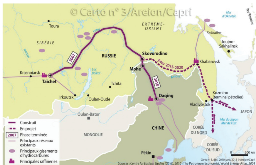
Figure 3 : L'oléoduc russo-chinois ESPO

[Sources: L'oléoduc Sibérie orientale-océan Pacifique (© Areion/Capri, Carte de: Laura Margueritte). Le 27 septembre 2010, le président russe, Dimitri Medvedev, a inauguré lors de sa visite à Pékin l'oléoduc reliant la Sibérie orientale à la Chine. Un tournant pour la politique énergétique de la Russie et un succès pour la diplomatie énergétique chinoise. [ http://www.carto-presse.com/?p=1029 ]