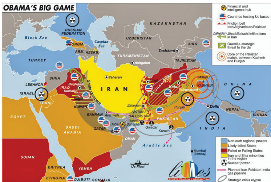
Figure 5: Le “Grand Jeu” d’Obama

Il s'agit par conséquent de la politique anglo-saxonne de refrènement (containment), laquelle a été utilisée par les États-Unis, l'Allemagne et l'Angleterre dans les années 1990 dans les Balkans et qui ciblait, encore une fois, le refrènement de la descente de la Russie dans les eaux chaudes de la Méditerranée (Voir Fig. 5).