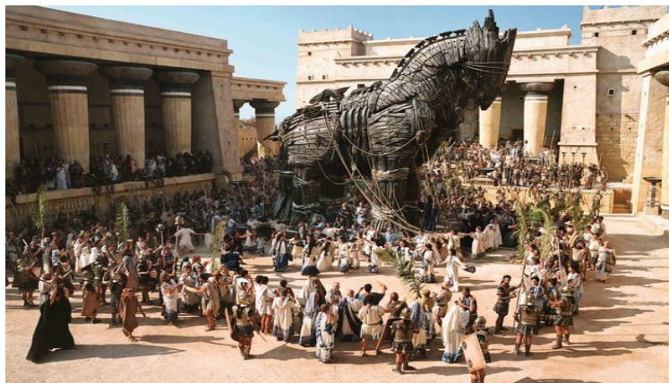
Εικόνα 2: Ο Δούρειος Ίππος είναι το αρχαιότερο δείγμα υβριδικού πολέμου.

Αναζητώντας στο παρελθόν τις στρατιωτικές συγκρούσεις που περιλαμβάνουν συμβατικές και μη συμβατικές δυνάμεις, διαπιστώνουμε πληθώρα περιπτώσεων στις οποίες κυριαρχεί ο συνδυασμός ακανόνιστων (άτακτων) δυνάμεων κι ανορθόδοξων μεθόδων με τις κλασικές συμβατικές δυνάμεις. Η πρώτη και αρχαιότερη περίπτωση πρωτόγονου πολέμου που μπορούμε να εντοπίσουμε την εμφάνιση επιχειρήσεων ανορθόδοξου πολέμου δεν είναι ιστορική αλλά προϊόν μυθοπλασίας στηριζόμενο σε ιστορικά γεγονότα. Αυτή είναι η περίπτωση του Τρωικού Πολέμου, μέσα από τα έπη του Ομήρου και ποιο συγκεκριμένα στο έπος «Οδύσσεια», όπου ο πολυμήχανος Οδυσσέας σκέφτηκε να χτίσει ένα μεγάλο ξύλινο άλογο και να κρύψει μια επίλεκτη ομάδα πολεμιστών στο εσωτερικό του.