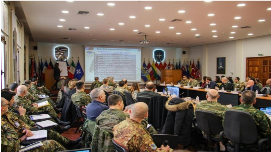
Εικόνα 7: CMI/CIMIC Seminar in NRDC-GR.

Η αποτίμηση της πολιτικό-στρατιωτικής συνεργασίας στο συγκεκριμένο πλαίσιο είχε θετικό περιεχόμενο, αφού δεν μπορεί να αμφισβητηθεί η καθοριστική επέμβαση των Ενόπλων Δυνάμεων και η ταχεία ανταπόκριση κρατικών ή εθελοντικών φορέων και οργανισμών. Ωστόσο, υπάρχουν μεγάλα περιθώρια βελτίωσης και εξέλιξης των επιχειρήσεων, τόσο σε ευρωπαϊκό όσο και σε νατοϊκό επίπεδο, καθώς οι προσφυγικές ροές συνεχίζονται και απαιτούν αποφασιστικές δράσεις.