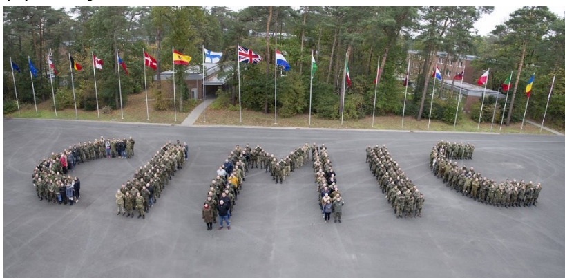
Εικόνα 6: Η Joint Cooperation (JOCO) στο Nienburg της Β.Γερμανίας, η μεγαλύτερη άσκηση CIMIC του NATO.

Οι ενέργειες των τμημάτων CIMIC διεξάγονται σύμφωνα με την εκτελούμενη επιχειρησιακή αποστολή, η οποία συνίσταται στη δημιουργία και διατήρηση των συνθηκών που συμβάλλουν στην ολοκλήρωση της συνολικής αποστολής και των γενικών αρχών του CIMIC, όπως αυτές ορίζονται στο δόγμα CIMIC του NATO. (NATO_AJP-9, 2003) Αυτό, όπως προαναφέρθηκε, περιλαμβάνει δραστηριότητες υποστήριξης της στρατιωτικής δράσης με την καθιέρωση και διατήρηση επαφών με τους μη στρατιωτικούς φορείς κατά την προετοιμασία και διεξαγωγή των επιχειρήσεων και παρεμβάσεων για την παροχή βοήθειας στους ανθρώπους και τους τοπικούς και δημόσιους οργανισμούς που διεξάγονται για τη διασφάλιση του νόμου και της τάξης μετά τις συγκρούσεις.