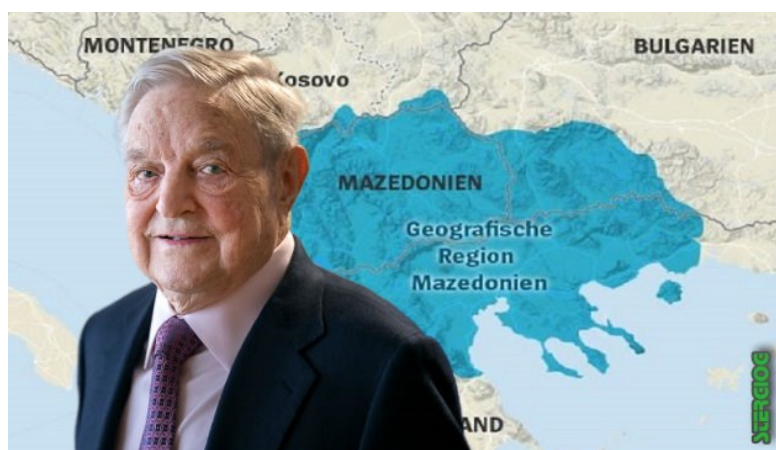
Εικόνα 5: Ο George Soros με φόντο το χάρτη των αλυτρωτικών εδαφών της ΠΓΔΜ.

Το Ίδρυμα Soros, επιπρόσθετα της εμπλοκής του με τις ύποπτες ΜΚΟ, προβαίνει και στην έκδοση διαφόρων προπαγανδιστικών φυλλαδίων στις ΗΠΑ, τον Καναδά και την Αυστραλία. Στα Σκόπια δε, είναι πίσω από την κυκλοφορία του αγγλόφωνου προπαγανδιστικού και ανθελληνικού μηνιαίου περιοδικού «Macedonian Times». Το έντυπο αυτό πέραν των ανθελληνικού περιεχομένου άρθρων του, εμφανίζει τον γνωστό χάρτη των σκοπιανών με τα αλύτρωτα εδάφη που φτάνουν ως τον Όλυμπο και τα οποία «κατακρατούν οι Έλληνες και καταπιέζουν τους Μακεδόνες κατοίκους». (stergiog.blogspot, 2018)