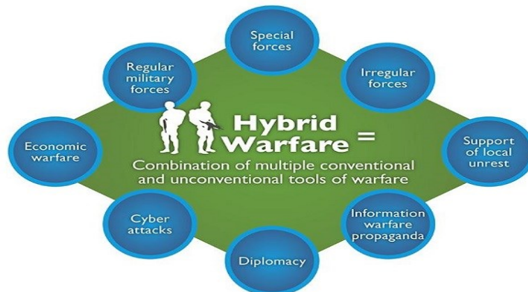
Εικόνα 1: Σχηματική παράσταση των εννοιών που συνθέτουν τον υβριδικό πόλεμο.

Το φαινόμενο του πολέμου αποτελεί διαχρονικό αντικείμενο μελέτης της επιστήμης των Διεθνών Σχέσεων και των στρατιωτικών σχολών, ενώ απασχολεί μέχρι και σήμερα σύσσωμη την ανθρωπότητα. Για τον Πρώσο στρατιωτικό και συγγραφέα, Clausewitz 2 , ο πόλεμος «είναι μια πράξη βίας, προορισμένη στο να καταναγκάσει τον αντίπαλο να πράξει κατά τη θέλησή μας» ή διαφορετικά «μια απλή συνέχιση της πολιτικής με άλλα μέσα». (Clausewitz, 1999) Με άλλα λόγια, ο πόλεμος είναι το μέσο για την επίτευξη της βούλησής μας επί του αντιπάλου. Σήμερα, η έννοια της λέξης προσλαμβάνει ακόμη μεγαλύτερη διάσταση, ενσωματώνοντας, πέρα των κλασικών φυσικών πεδίων δράσεως (ξηράς, θαλάσσης κι αέρος), τον χώρο του διαστήματος και του ηλεκτρομαγνητικού φάσματος. Επιπρόσθετα, νέες εννοιολογικές διαστάσεις προκύπτουν στον όρο και με την πρόσθεση νέων πεδίων, όπως του ψυχολογικού, πληροφοριακού, επικοινωνιακού, οικονομικού, ψηφιακού και υβριδικού αντίστοιχα. Ο υβριδικός πόλεμος (Hybrid Warfare) έχει συνδεθεί με εκείνη τη μορφή του πολέμου που συνδυάζει συμβατικές και μη επιχειρήσεις με στοιχεία ανορθόδοξου πολέμου (irregular warfare).