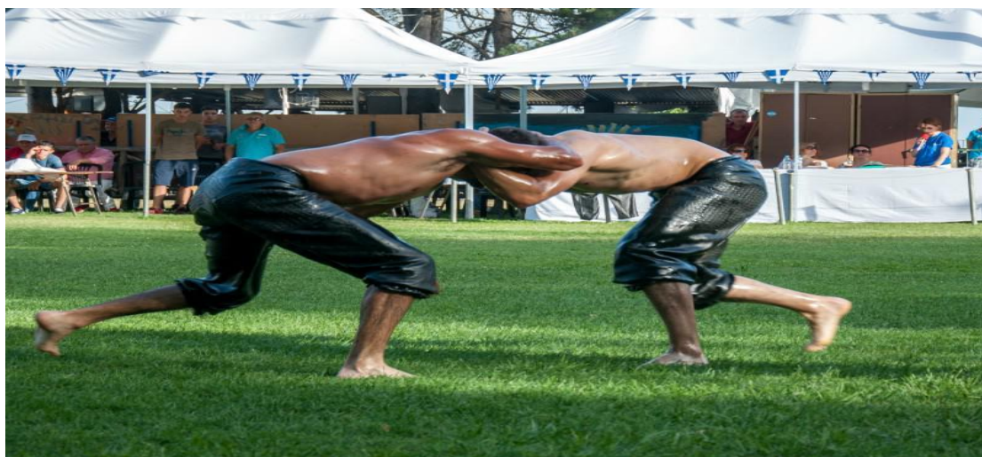
Εικόνα 3.5: Στιγμιότυπο πάλης με λάδι

Ο όρος πεχλιβάνης σύμφωνα με μία θεωρία ακούστηκε για πρώτη φορά στο Ιράν την περίοδο των Πάρθων (238 π.Χ-224 μ.Χ.). Στην περσική εποχή ανάγεται η ιστορία των αγώνων πάλη με λάδι μετά την περίοδο του 1065 μ.Χ. για τους οποίους γίνεται αναφορά από τον Πέρση ποιητή Φερντοσί στο ποίημα Σαχναμέχ. Εκείνη ην εποχή, ένας παλαιστής, ο Ροστάμ έσωξε την πατρίδα του από τις δυνάμεις του κακού. Κατά την περίοδο της οθωμανικής αυτοκρατορίας έγινε η διείδυση του αγωνίσματος στην Μικρά Ασία και στα Βαλκάνια. (Wikipedia, n.d.)