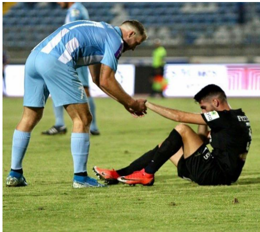
Εικόνα 3.3: Στιγμιότυπο Fair play