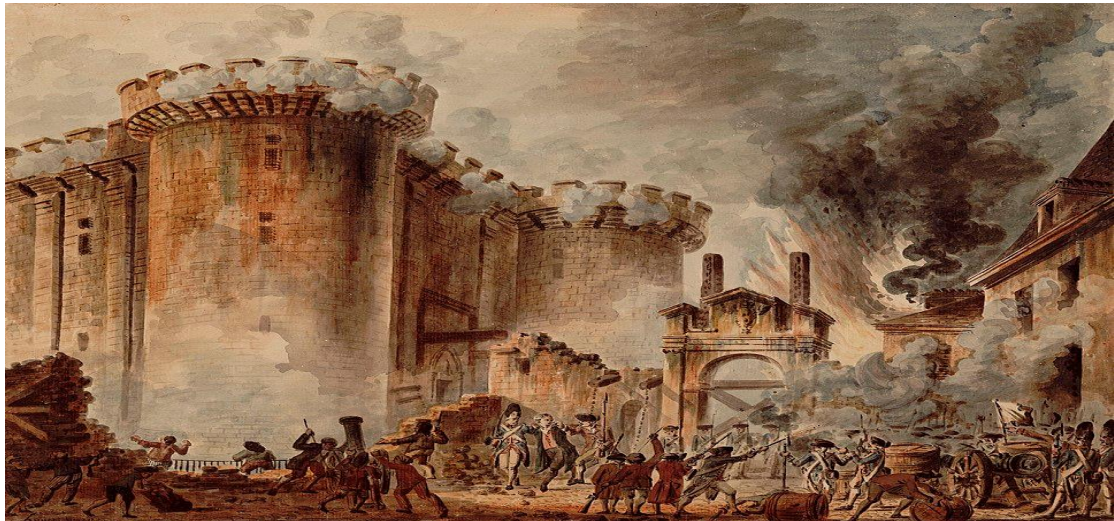
Εικόνα 4.1: Άλωση της Βαστίλης το 1789 η οποία λειτουργούσε ως φυλακή πολιτικών κρατουμένων και αποτελούσε σύμβολο του αυταρχισμού και της μοναρχίας

Σύμφωνα με αρκετούς μελετητές και ένα τμήμα του κομμουνιστικού κινήματος, οι εξεγέρσεις των εργαζομένων και του λαού στις χώρες του ανατολικού μπλοκ (οι οποίες στράφηκαν εναντίον της κομματικής/κρατικής άρχουσας τάξης των χωρών αυτών), είχαν ως περιεχόμενο την βελτίωση των όρων διαβίωσης και την εμβάθυνση των πολιτικών ελευθεριών προς όφελος της κοινωνικής πλειοψηφίας. Σύμφωνα με άλλους μελετητές και τμήμα του κομμουνιστικού κινήματος, οι εξεγέρσεις στις χώρες αυτές αποτέλεσαν αντεπαναστάσεις με αντισοβιετικό και αντικομμουνιστικό περιεχόμενο και προέκυψαν ως αποτέλεσμα της υπονόμευσης των καθεστώτων αυτών από τις καπιταλιστικές χώρες (Wikipedia, n.d.)