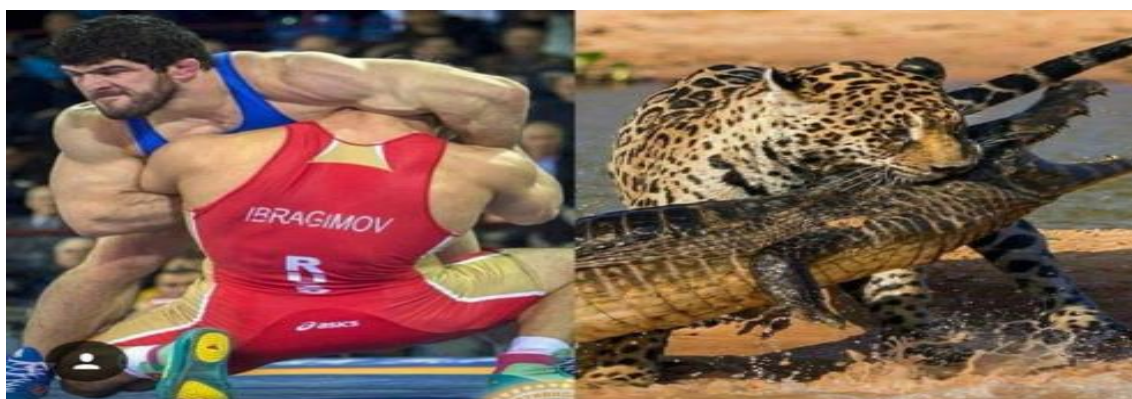
Εικόνα 5.3: Η πάλη ανάμεσα στους ανθρώπους και η πάλη στα ζώα.

Τέτοιου είδους μάχες συναντάμε κατά κύριο λόγο στην φύση καθώς οι νόμοι που την διέπουν είναι συγκεκριμένοι και αμείλικτοι. Το ανθρώπινο είδος θα ακολουθούσε τους ίδιους νόμους, αν δεν ερχόταν η κοινωνία να δαμάσει τα ένστικτα του και να τιμωρεί όποιον δεν συνετίζεται με τους κανόνες της. Ίσως να αφανιζόταν σε σύντομο χρονικό διάστημα παρότι διέπεται από τα ίδια ένστικτα και καλέσματα της φύσης. Εν τούτοις η εξέλιξη των κοινωνιών ώθησε τους ανθρώπους να διατηρήσουν μόνο τις θετικές εκείνες δυνάμεις και να προσπαθήσουν να περιορίσουν τις αρνητικές επιταγές της φύσης που παρόλη την ισορροπία που καταφέρνει να πετυχαίνει με τους νόμους είναι σίγουρα αδυσώπητη.