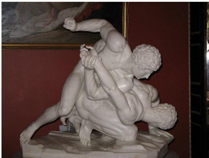
Πίνακας 2.1: Παλαιιστές που εκτίθενται στο παλάτι Yusupov στην Αγία Πετρούπολη (Wikipedia, 2008)

Η πάλη θεωρείται το αρχαιότερο άθλημα και η προέλευση της δεν μας είναι απόλυτα σαφής παρόλο που υπάρχουν διάφορες αναφορές σε γραπτά κείμενα ενώ συναντάμε και αποτυπώσεις της στην τέχνη. Η πάλη υπήρξε πριν την εμφάνιση του αθλήματος διότι ο άνθρωπος πάλευε καθημερινά για την επιβίωσή του με τα άγρια θηρία. Στην Ιλιάδα ο Όμηρος (8 ος αιώνας π.Χ.) αναφέρεται στους αγώνες πάλης προς τιμήν του Πάτροκλου μετά τον θάνατο του κατά την διάρκεια της πολιορκίας της Τροίας. Επίσης έχουμε την αναμέτρηση ανάμεσα στον βασιλιά της Ιθάκης Οδυσσέα και τον Αίαντα, γιού του βασιλιά της Σαλαμίνας. Σύμφωνα με τον μύθο η πάλη στην αρχαία Ελλάδα θεωρείται εύρημα του θεού Ερμή. Ο Φιλόστρατος συγκεκριμένα υποστηρίζει ότι η κόρη του Ερμή, η Παλαιίστρα, την εφηύρε περνώντας το μεγαλύτερο μέρος της εφηβείας της στα βουνά της Αρκαδίας. Σύμφωνα με πηγές το πρώτο γυμναστικό ίδρυμα ονομάστηκε Παλαιίστρα αποδεικνύοντας ότι πρόκειται πράγματι για το αρχαιότερο άθλημα.