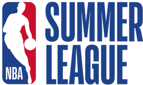
Εικόνα 6.(Λογότυπο τουρνουά καλοκαιρινής προετοιμασίας)

Τα πρωταθλήματα αποτελούνται συνήθως από λίγα παιχνίδια ανά ομάδα. Σε αντίθεση με τα κανονικά παιχνίδια του NBA, τα οποία έχουν διάρκεια 48 λεπτών, τα παιχνίδια διαρκούν μόνο 40 λεπτά (όπως στις FIBA/WNBA), συν πολλαπλές περιόδους παράτασης 5 λεπτών (η πρώτη παράταση παίζεται στο σύνολό της, έπειτα ξαφνικός θάνατος). Πριν από τα πρωταθλήματα του 2013, δεν υπήρχε επίσημος πρωταθλητής