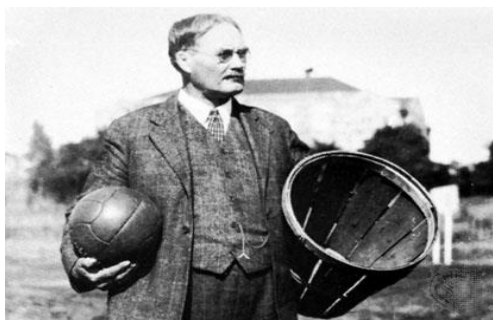
Εικόνα 1.(Δρ. Τζέιμς Νέισμιθ ιδρυτής καλαθοσφαίρισης)

Στις αρχές Δεκεμβρίου του 1891, ο καθηγητής φυσικής αγωγής στο Εκπαιδευτήριο της Χριστιανικής Αδελφότητας Νέων (YMCA) (σημερινό Κολέγιο Σπρίνγκφιλντ) στο Σπρίνγκφιλντ, Μασαχουσέτη Η.Π.Α, Δρ. Τζέιμς Νέισμιθ (6 Νοεμβρίου 1861 – 28 Νοεμβρίου 1939) δημιούργησε ένα παιχνίδι για να παίζουν οι μαθητές του σε κλειστό χώρο που παράλληλα θα το εκλάμβαναν ως ενδιαφέρον και θα τους κρατούσε απασχολημένους. Αφού απέρριψε πολλές ιδέες που ήταν ακατάλληλες για κλειστά γυμναστήρια, τοποθέτησε ένα καλάθι στον τοίχο του γυμναστηρίου, έγραψε ορισμένους βασικούς κανόνες κι άρχισε να εκπαιδεύει τους μαθητές του.