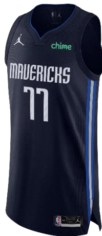
Εικόνα 11.(Εμφάνιση ομάδας σεζόν 2020-21)

Το 2017 ο βασικός προμηθευτής της ομάδας ήταν η αθλητική εταιρεία Nike. Οι Mavericks φορούσαν μαύρες στολές με το λογότυπο "DAL" και τους αριθμούς σε μπλε χρώμα με πράσινο τελείωμα. Αυτό το σετ φορούσε μόνο κατά τη διάρκεια της σεζόν 2017-18, μετά την οποία σχεδιάστηκε μια νέα στολή με το λογότυπο "City". Η νέα στολή παρουσιάστηκε τον Νοέμβριο του 2018.