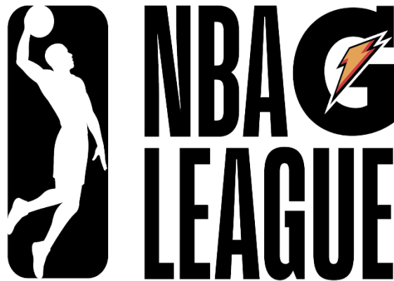
Εικόνα 7. (Λογότυπο πρωταθλήματος αναπτυξιακής λίγκας)

Στην σεζόν 2017-18, η D-League σύναψε μια πολυετή συνεργασία με την Gatorade και ανακοίνωσε ότι θα μετονομαστεί ως το NBA Gatorade League, το οποίο επίσημα συντομεύτηκε σε "NBA G League" πριν από τη σεζόν.