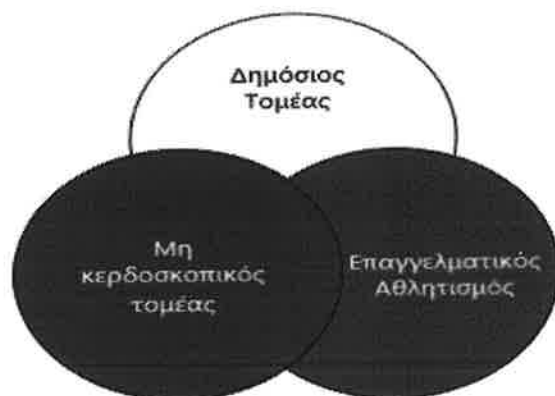
ΟΙ ΤΡΕΙΣ ΤΟΜΕΙΣ ΤΟΥ ΑΘΛΗΤΙΣΜΟΥ

Σύμφωνα με τους Hoye et al., (2015), για να γίνει καλύτερα κατανοητό το πως οι πολλοί και διάφοροι οργανισμοί που σχετίζονται με τη διαχείριση του αθλητισμού και πώς μπορούν να σχηματίσουν εταιρικές σχέσεις και να επηρεάσουν ο ένας τις δραστηριότητες του άλλου, είναι χρήσιμο να αναφερθεί ότι ο αθλητισμός περιλαμβάνει τρεις διαφορετικούς τομείς. Αυτοί οι τρεις τομείς δε λειτουργούν κατ' ανάγκη ανεξάρτητα, καθώς σε πολλές περιπτώσεις υπάρχει σημαντική αλληλεπίδραση μεταξύ τους. Για παράδειγμα, το κράτος λαμβάνει ενεργά μέρος στη χρηματοδότηση των μη κερδοσκοπικών οργανισμών του αθλητισμού για τη στήριξη αθλητικών προγραμμάτων. Σε αντάλλαγμα, οι μη κερδοσκοπικοί αθλητικοί οργανισμοί προσφέρουν στο κοινωνικό σύνολο αθλητικές ευκαιρίες, καθώς και τη διασφάλιση συμμετοχής σε αυτές αθλητών, προπονητών και στελεχών αθλητικού μάντζμεντ. Το κράτος υποστηρίζει τον αθλητισμό, παρέχοντας τα μέσα για την κατασκευή μεγάλων σταδίων και αθλητικών χώρων και ρυθμίζοντας παράλληλα ένα κανονιστικό και νομικό πλαίσιο για τη διεξαγωγή των αθλητικών δραστηριοτήτων. Επίσης, ο μη κερδοσκοπικός αθλητικός τομέας υποστηρίζει τον επαγγελματικό αθλητισμό, προετοιμάζοντας ταλαντούχους αθλητές για πρωταθλητισμό, εξειδικευμένους προπονητές αλλά και διοικητικό προσωπικό με υποστηρικτικό ρόλο. Τέλος, ο επαγγελματικός αθλητικός τομέας από την πλευρά του, έχει σκοπό την παραγωγή θεάματος και συνεπώς αναπτύσσεται μια αλληλένδετη σχέση με κοινούς στόχους και συμφέροντα (Hoye et al., 2015).