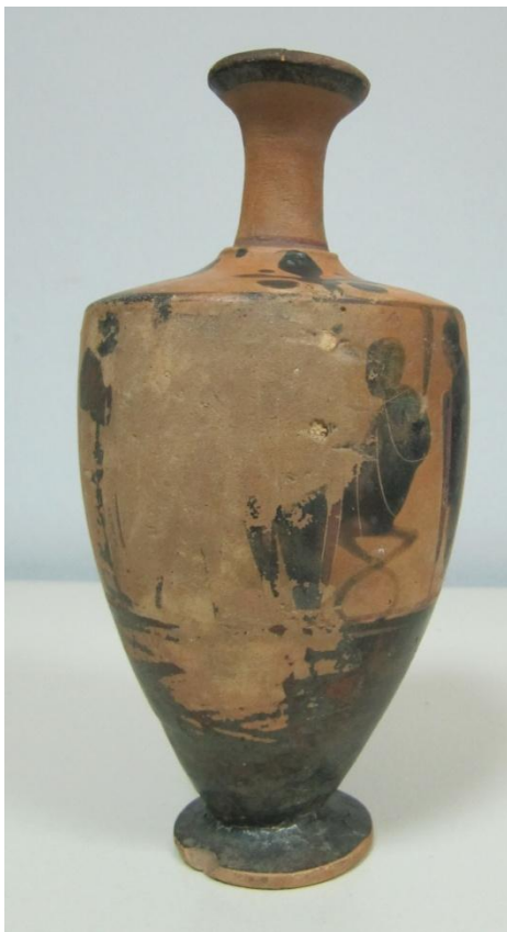
Εικόνα 29: Λήκυθος ΜΑΙΤ 9181, αρ. κατ. 10.