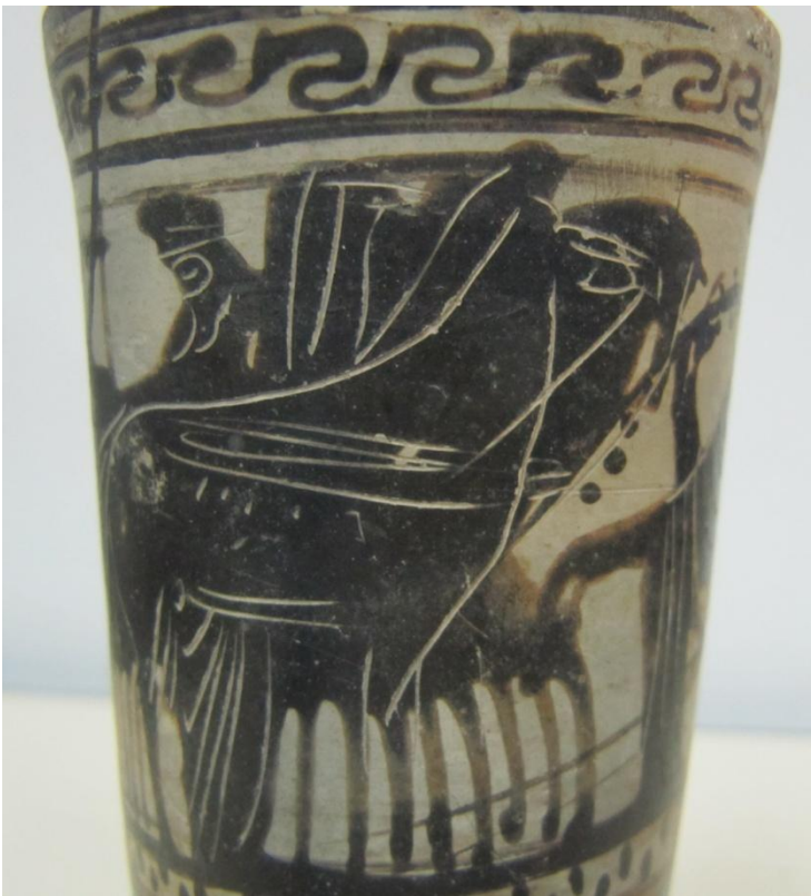
Εικόνα 137: Λήκυθος ΜΑΙΤ 9327, αρ. κατ. 38, λεπτομέρεια.