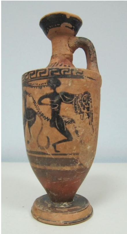
Εικόνα 91: Λήκυθος ΜΑΙΤ 9174, αρ. κατ. 25, πλάγια όψη.