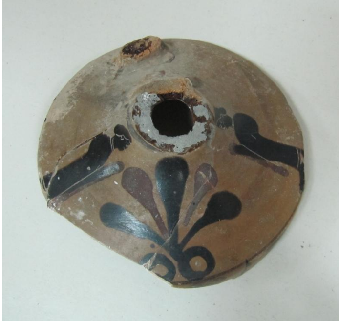
Εικόνα 27: Λήκυθος ΜΑΙΤ 9126, αρ. κατ. 9, διακόσμηση ώμου.