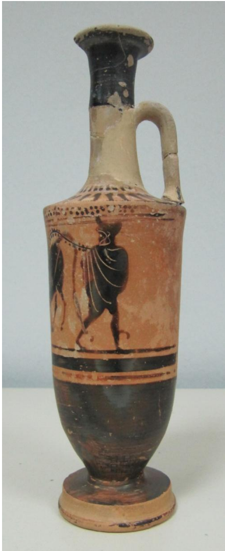
Εικόνα 104: Λήκυθος ΜΑΙΤ 9369, αρ. κατ. 29, πλάγια όψη.