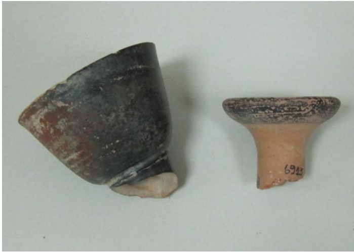
Εικόνα 185: Λήκυθος ΜΑΙΤ 9099, αρ. κατ. 62.