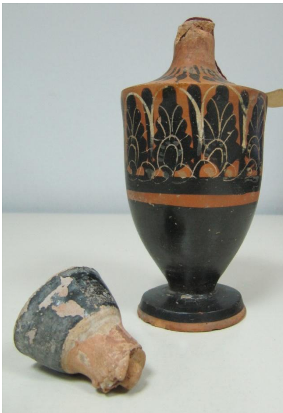
Εικόνα 182: Λήκυθος ΜΑΙΤ 8962, αρ. κατ. 59.