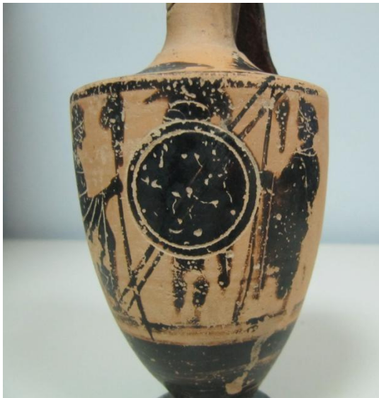
Εικόνα 17: Λήκυθος ΜΑΙΤ 9374, αρ. κατ. 6, λεπτομέρεια.