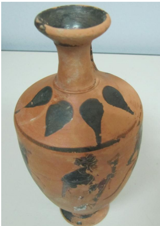
Εικόνα 33: Λήκυθος ΜΑΙΤ 9357, αρ. κατ. 11, διακόσμηση ώμου.