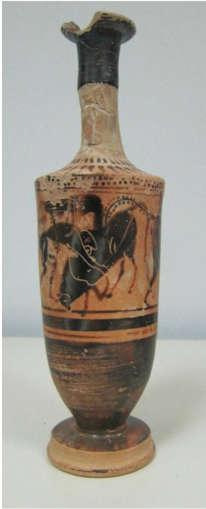
Εικόνα 103: Λήκυθος ΜΑΙΤ 9369, αρ. κατ. 29.