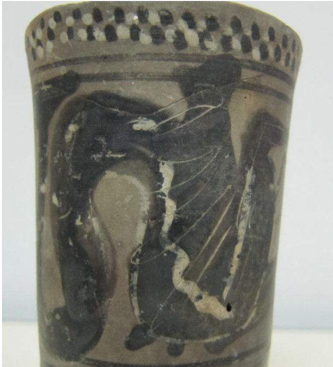
Εικόνα 162: Λήκυθος ΜΑΙΤ 9367, αρ. κατ. 45, λεπτομέρεια.