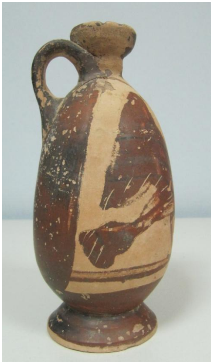
Εικόνα 2: Λήκυθος ΜΑΙΤ 9370, αρ. κατ. 1, πλάγια όψη.