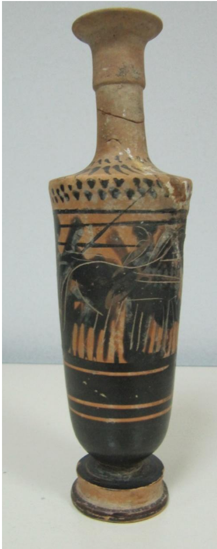
Εικόνα 131: Λήκυθος ΜΑΙΤ 9179, αρ. κατ. 37.