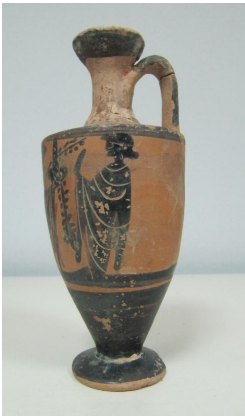
Εικόνα 80: Λήκυθος ΜΑΙΤ 9184, αρ. κατ. 22, πλάγια όψη.