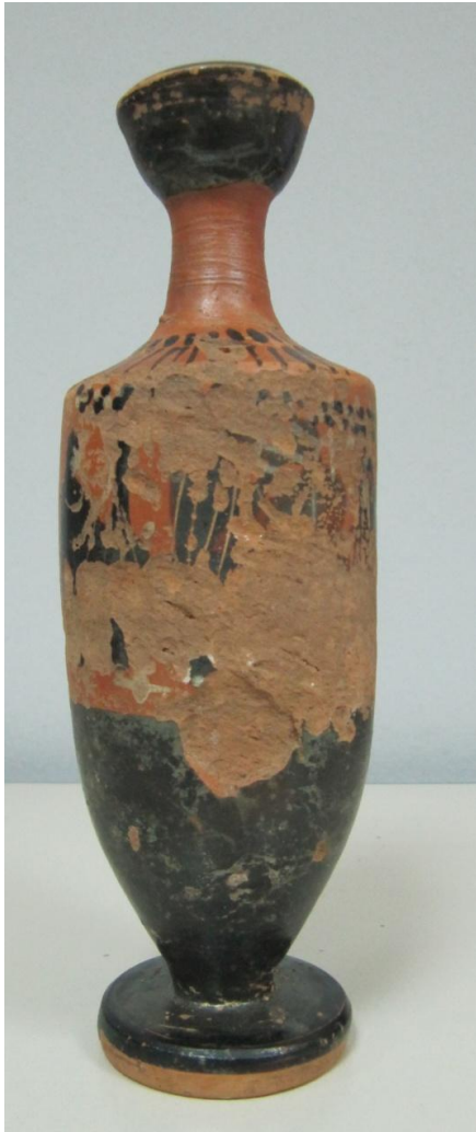
Εικόνα 77: Λήκυθος ΜΑΙΤ 9331, αρ. κατ. 21.