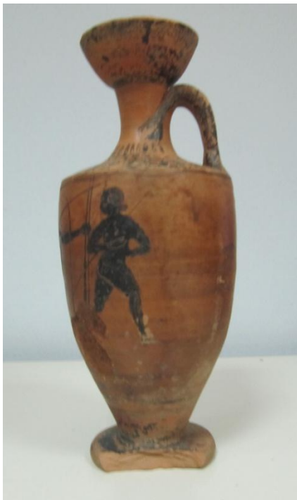
Εικόνα 43: Λήκυθος ΜΑΙΤ 8969, αρ. κατ. 14, πλάγια όψη.