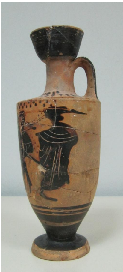
Εικόνα 49: Λήκυθος ΜΑΙΤ 9175, αρ. κατ. 15, πλάγια όψη.