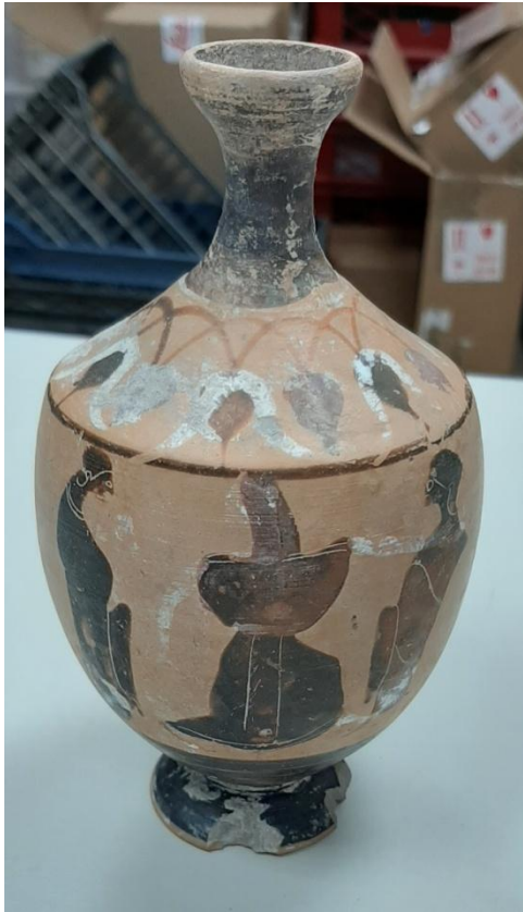
Εικόνα 7: Λήκυθος ΜΑΙΤ 8960, αρ. κατ. 3.