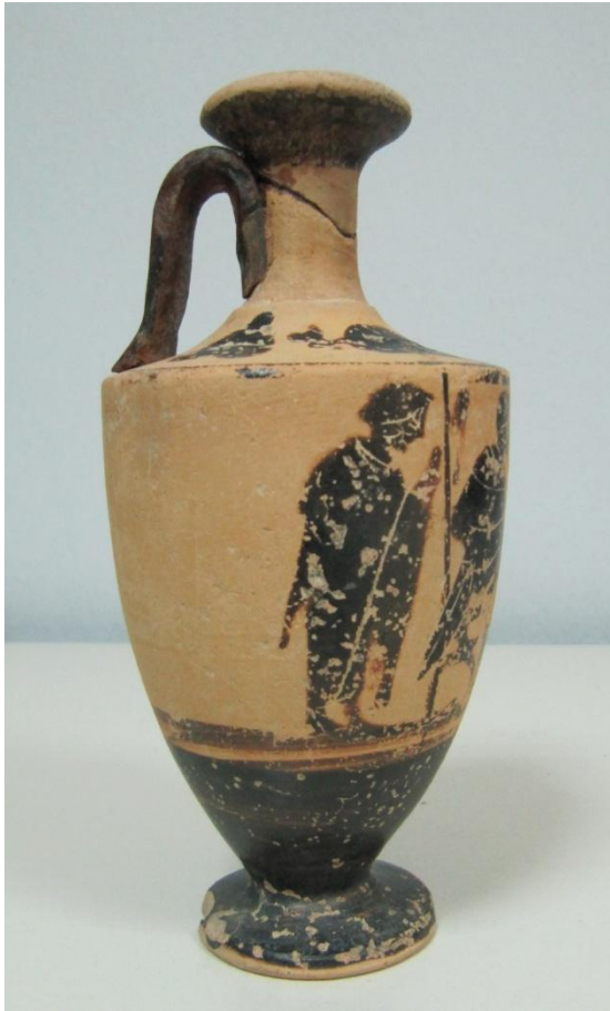
Εικόνα 18: Λήκυθος ΜΑΙΤ 9374, αρ. κατ. 6, πλάγια όψη.