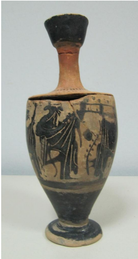
Εικόνα 34: Λήκυθος ΜΑΙΤ 9375, αρ. κατ. 12.