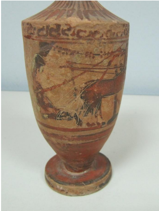
Εικόνα 58: Λήκυθος ΜΑΙΤ 9334, αρ. κατ. 17, λεπτομέρεια.