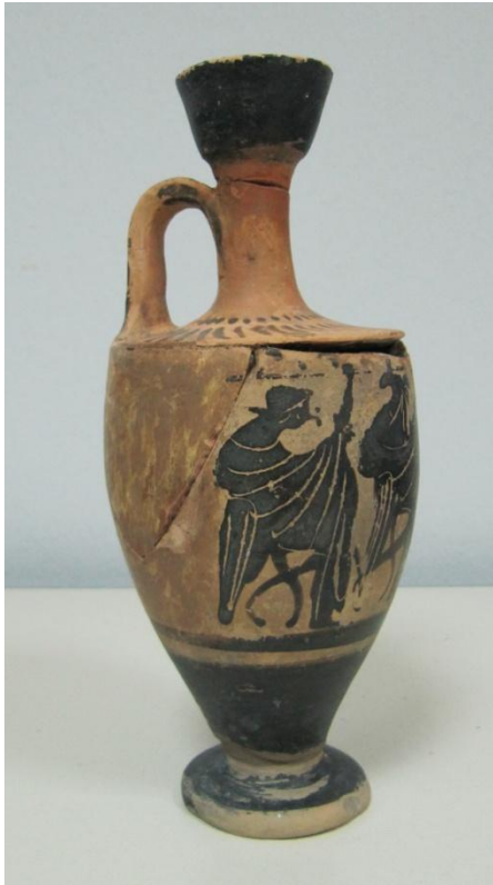
Εικόνα 36: Λήκυθος ΜΑΙΤ 9375, αρ. κατ. 12, πλάγια όψη.