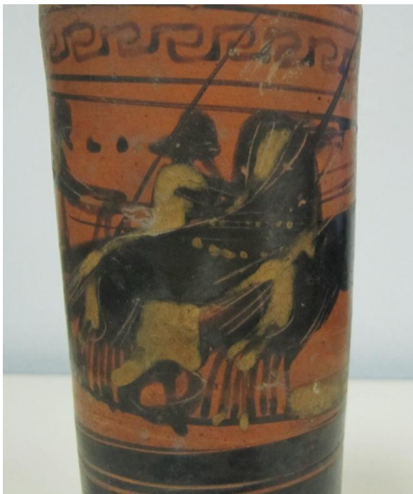
Εικόνα 125: Λήκυθος ΜΑΙΤ 9185, αρ. κατ. 35, λεπτομέρεια.