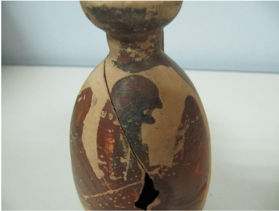
Εικόνα 3: Λήκυθος ΜΑΙΤ 9370, αρ. κατ. 1, λεπτομέρεια.