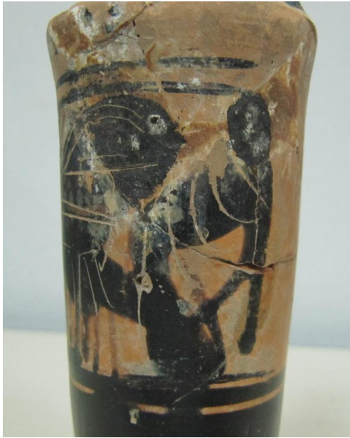
Εικόνα 134: Λήκυθος ΜΑΙΤ 9179, αρ. κατ. 37, λεπτομέρεια.