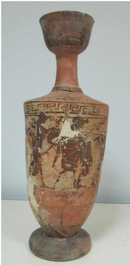
Εικόνα 82: Λήκυθος ΜΑΙΤ 9338, αρ. κατ. 23.