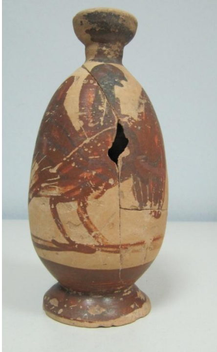
Εικόνα 1: Λήκυθος ΜΑΙΤ 9370, αρ. κατ. 1.