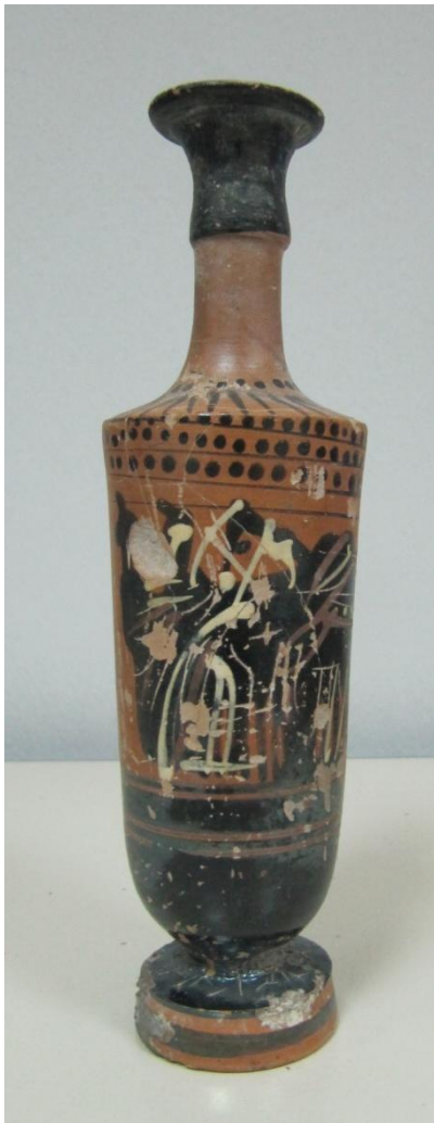
Εικόνα 139: Λήκυθος ΜΑΙΤ 9330, αρ. κατ. 39.