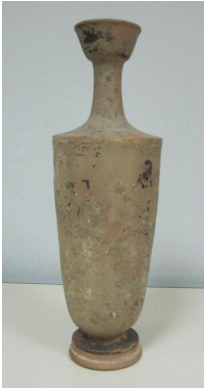
Εικόνα 166: Λήκυθος ΜΑΙΤ 9342, αρ. κατ. 48.