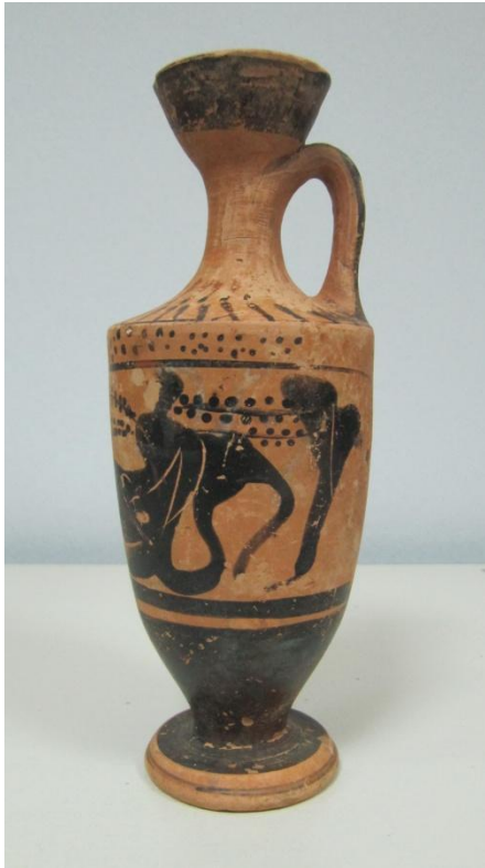
Εικόνα 89: Λήκυθος ΜΑΙΤ 9169, αρ. κατ. 24, πλάγια όψη.