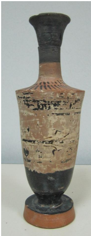
Εικόνα 178: Λήκυθος ΜΑΙΤ 9183, αρ. κατ. 55.