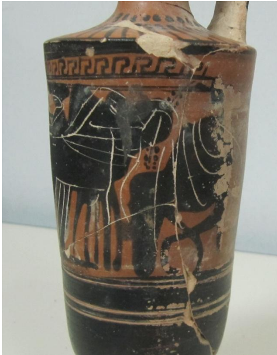
Εικόνα 144: Λήκυθος ΜΑΙΤ 9332, αρ. κατ. 40, λεπτομέρεια.