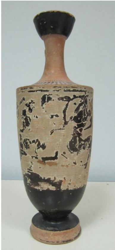
Εικόνα 170: Λήκυθος ΜΑΙΤ 9344, αρ. κατ. 50.