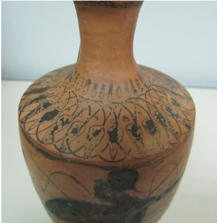
Εικόνα 46: Λήκυθος ΜΑΙΤ 8969, αρ. κατ. 14, διακόσμηση ώμου.