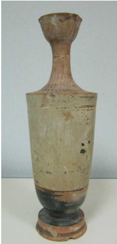
Εικόνα 181: Λήκυθος ΜΑΙΤ 9339, αρ. κατ. 58.