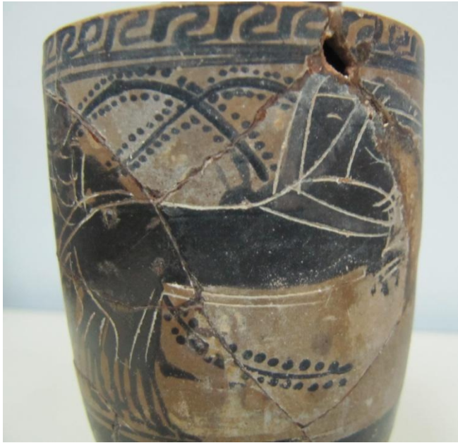
Εικόνα 70: Λήκυθος ΜΑΙΤ 9333, αρ. κατ. 19, λεπτομέρεια.