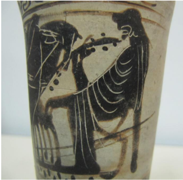
Εικόνα 138: Λήκυθος ΜΑΙΤ 9327, αρ. κατ. 38, λεπτομέρεια.