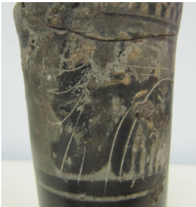
Εικόνα 149: Λήκυθος ΜΑΙΤ 9336, αρ. κατ. 42, λεπτομέρεια.