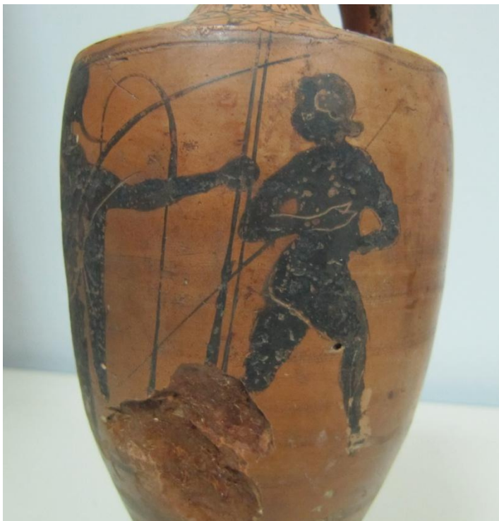
Εικόνα 45: Λήκυθος ΜΑΙΤ 8969, αρ. κατ. 14, λεπτομέρεια.