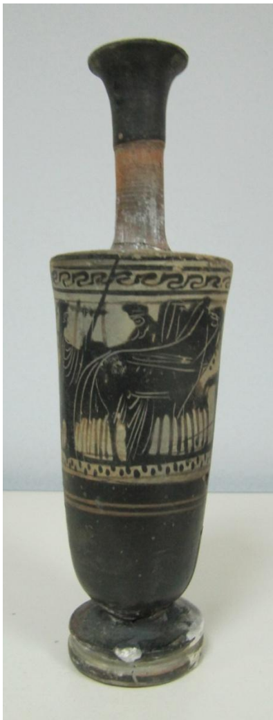
Εικόνα 135: Λήκυθος ΜΑΙΤ 9327, αρ. κατ. 38.