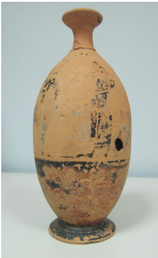
Εικόνα 4: Λήκυθος ΜΑΙΤ 8959, αρ. κατ. 2.