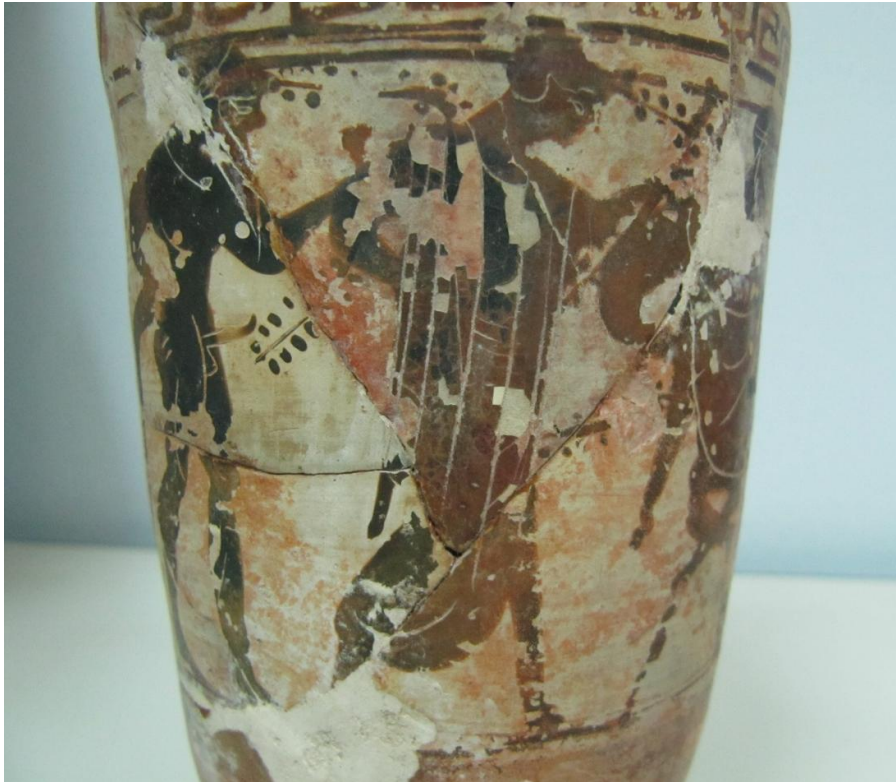
Εικόνα 87: Λήκυθος ΜΑΙΤ 9338, αρ. κατ. 23, λεπτομέρεια.