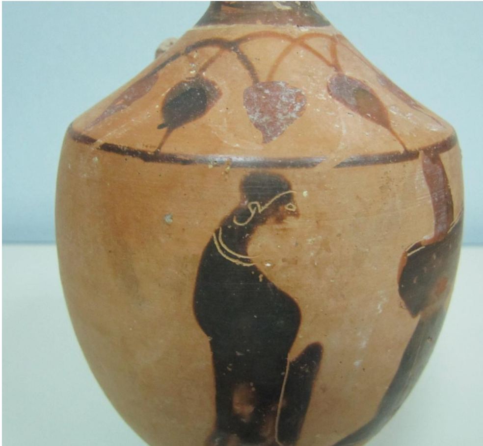
Εικόνα 9: Λήκυθος ΜΑΙΤ 8960, αρ. κατ. 3, λεπτομέρεια.