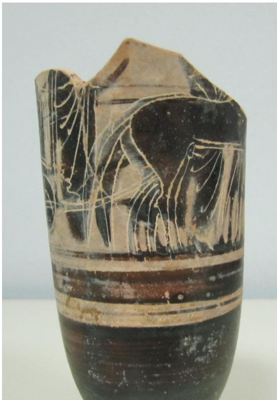
Εικόνα 121: Λήκυθος ΜΑΙΤ 9133, αρ. κατ. 34, λεπτομέρεια.