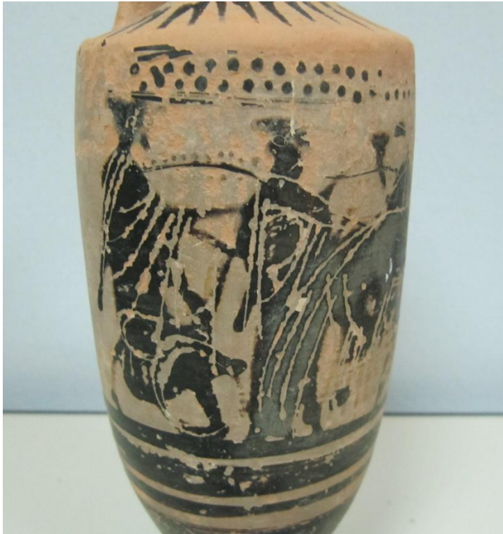
Εικόνα 74: Λήκυθος ΜΑΙΤ 9173, αρ. κατ. 20, λεπτομέρεια.