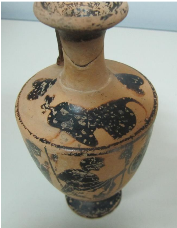
Εικόνα 19: Λήκυθος ΜΑΙΤ 9374, αρ. κατ. 6, διακόσμηση ώμου.