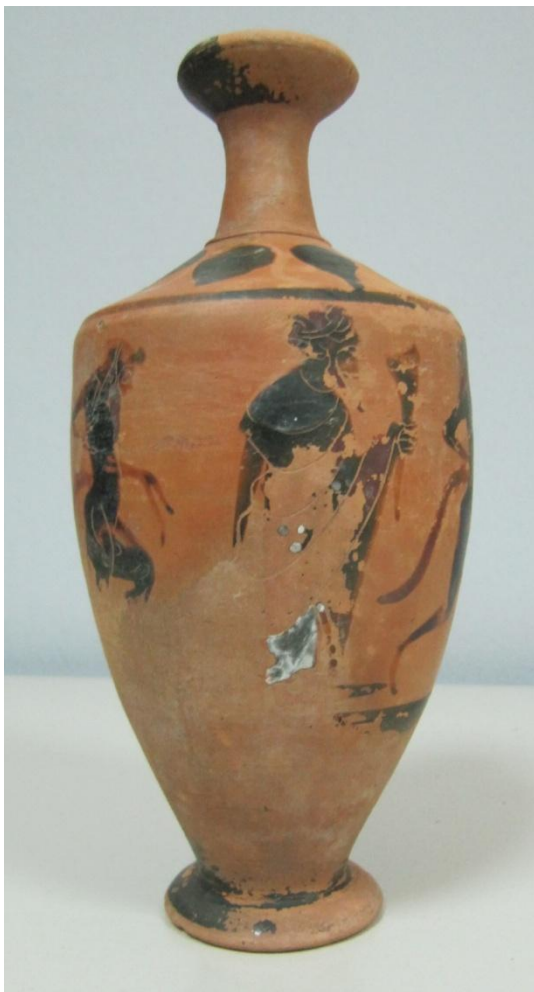
Εικόνα 31: Λήκυθος ΜΑΙΤ 9357, αρ. κατ. 11.