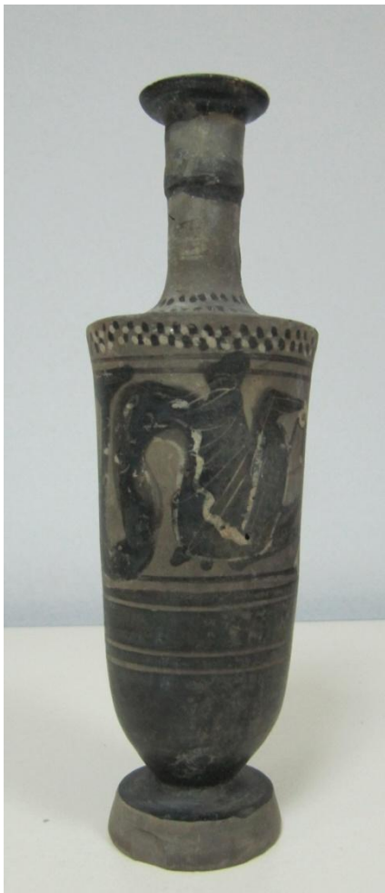
Εικόνα 159: Λήκυθος ΜΑΙΤ 9367, αρ. κατ. 45.