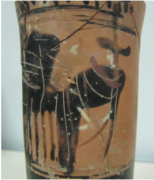
Εικόνα 130: Λήκυθος ΜΑΙΤ 9324, αρ. κατ. 36, λεπτομέρεια.