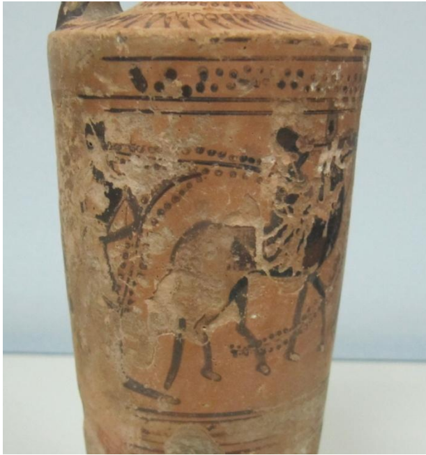
Εικόνα 156: Λήκυθος ΜΑΙΤ 9172, αρ. κατ. 44, λεπτομέρεια.