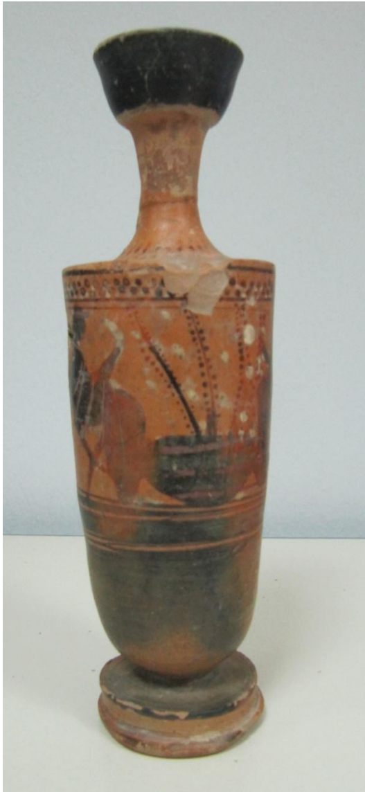
Εικόνα 105: Λήκυθος ΜΑΙΤ 9326, αρ. κατ. 30.