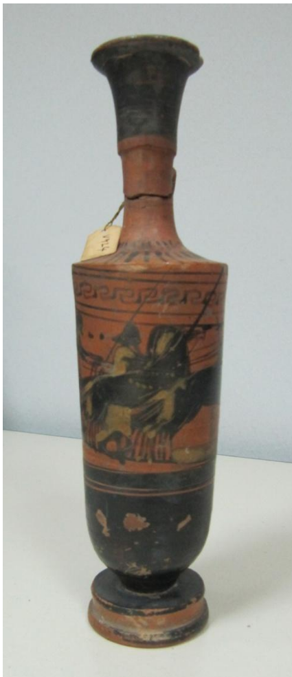
Εικόνα 123: Λήκυθος ΜΑΙΤ 9185, αρ. κατ. 35.