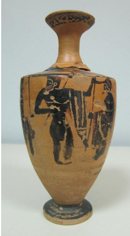
Εικόνα 23: Λήκυθος ΜΑΙΤ 9176, αρ. κατ. 8.