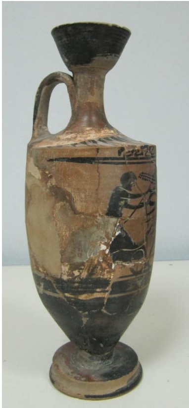
Εικόνα 68: Λήκυθος ΜΑΙΤ 9333, αρ. κατ. 19, πλάγια όψη.