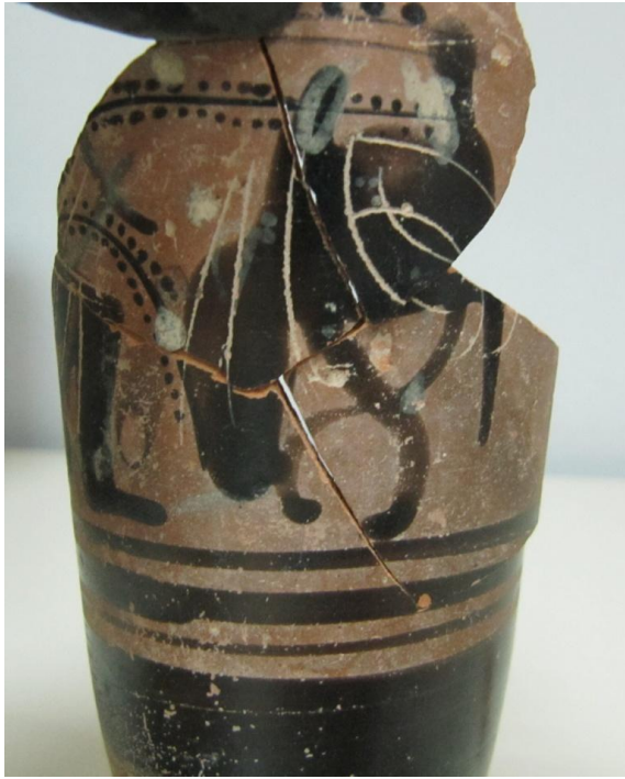
Εικόνα 164: Λήκυθος ΜΑΙΤ 8966, αρ. κατ. 46, λεπτομέρεια.