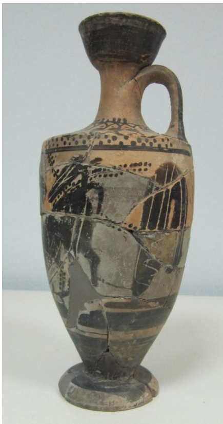
Εικόνα 94: Λήκυθος ΜΑΙΤ 9373, αρ. κατ. 26, πλάγια όψη.