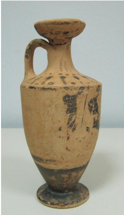
Εικόνα 14: Λήκυθος ΜΑΙΤ 9180, αρ. κατ. 5, πλάγια όψη.