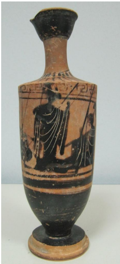
Εικόνα 110: Λήκυθος ΜΑΙΤ 9366, αρ. κατ. 31.