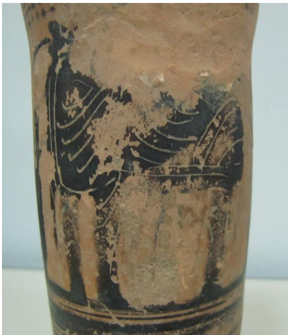
Εικόνα 118: Λήκυθος ΜΑΙΤ 9328, αρ. κατ. 33, λεπτομέρεια.