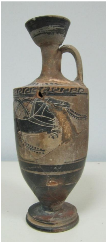
Εικόνα 67: Λήκυθος ΜΑΙΤ 9333, αρ. κατ. 19, πλάγια όψη.