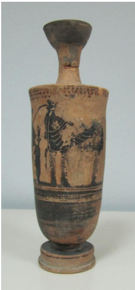
Εικόνα 116: Λήκυθος ΜΑΙΤ 9328, αρ. κατ. 33.