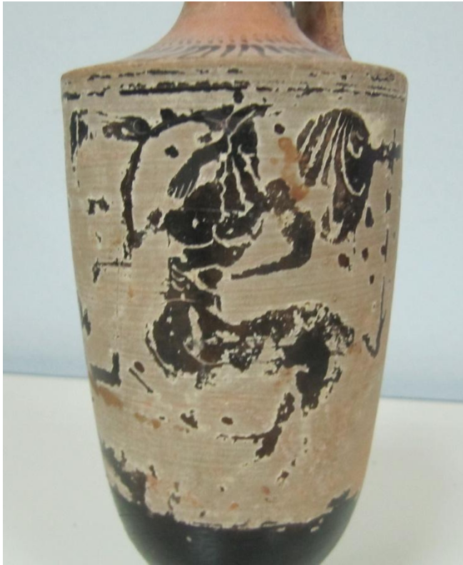
Εικόνα 172: Λήκυθος ΜΑΙΤ 9344, αρ. κατ. 50, λεπτομέρεια.