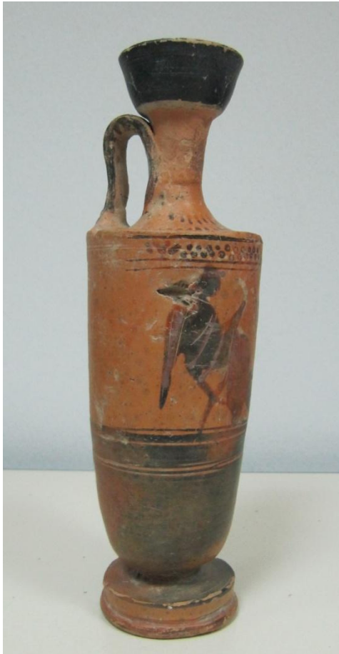
Εικόνα 107: Λήκυθος ΜΑΙΤ 9326, αρ. κατ. 30, πλάγια όψη.