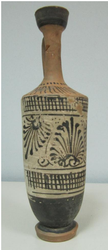
Εικόνα 180: Λήκυθος ΜΑΙΤ 8976, αρ. κατ. 57.