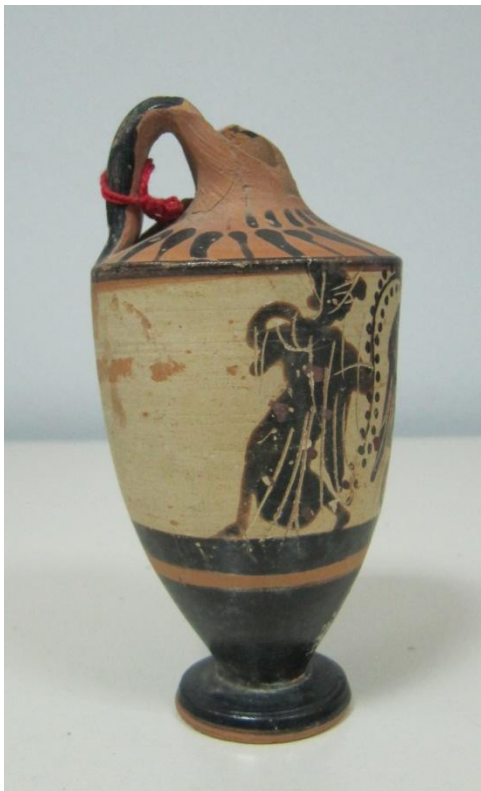
Εικόνα 39: Λήκυθος ΜΑΙΤ 9182, αρ. κατ. 13, πλάγια όψη.