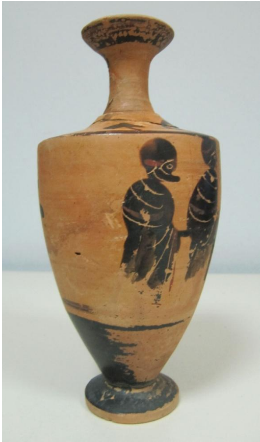
Εικόνα 24: Λήκυθος ΜΑΙΤ 9176, αρ. κατ. 8, πλάγια όψη.