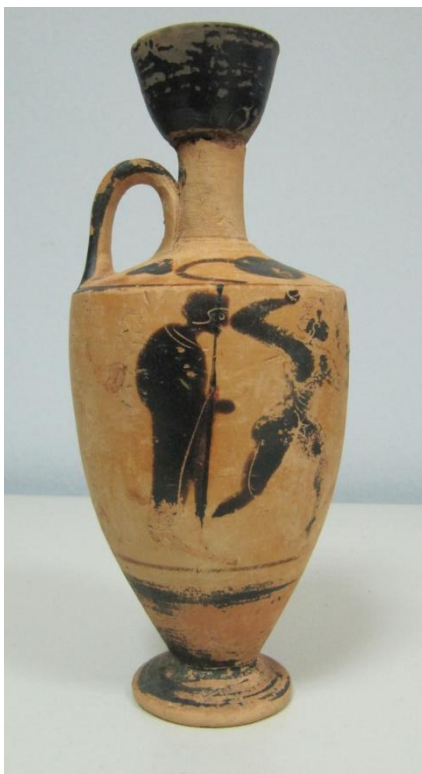
Εικόνα 21: Λήκυθος ΜΑΙΤ 9170, αρ. κατ. 7, πλάγια όψη.