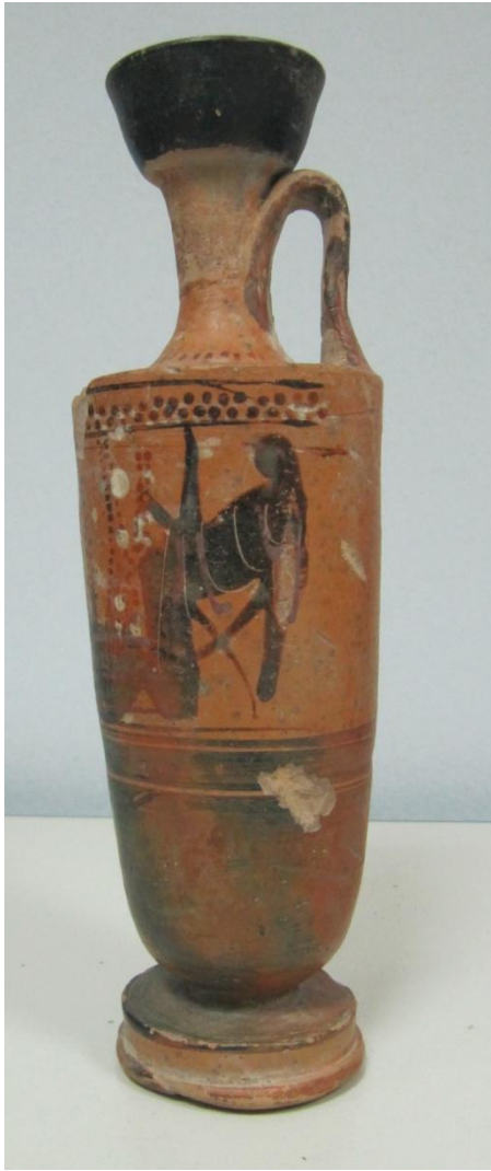
Εικόνα 106: Λήκυθος ΜΑΙΤ 9326, αρ. κατ. 30, πλάγια όψη.