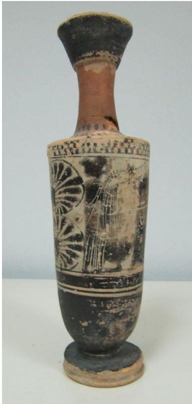
Εικόνα 98: Λήκυθος ΜΑΙΤ 9345, αρ. κατ. 28.