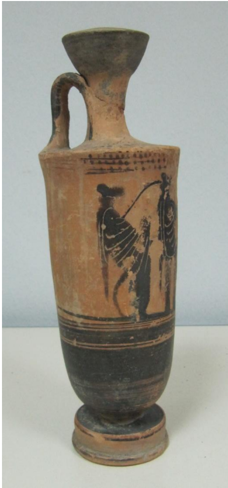
Εικόνα 117: Λήκυθος ΜΑΙΤ 9328, αρ. κατ. 33, πλάγια όψη.