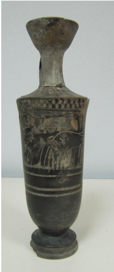
Εικόνα 148: Λήκυθος ΜΑΙΤ 9336, αρ. κατ. 42.