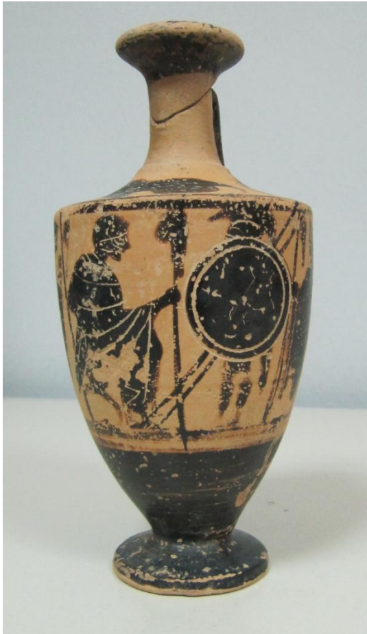
Εικόνα 16: Λήκυθος ΜΑΙΤ 9374, αρ. κατ. 6.