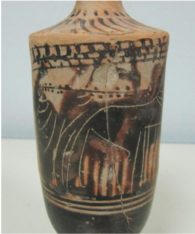
Εικόνα 146: Λήκυθος ΜΑΙΤ 9337, αρ. κατ. 41, λεπτομέρεια.