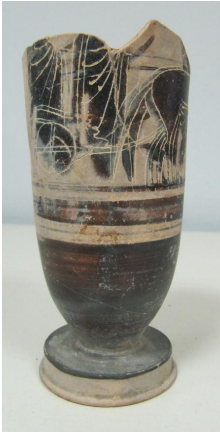
Εικόνα 120: Λήκυθος ΜΑΙΤ 9133, αρ. κατ. 34.