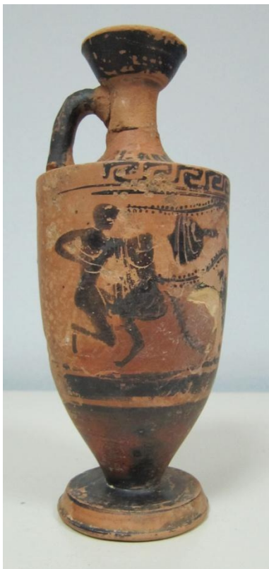
Εικόνα 92: Λήκυθος ΜΑΙΤ 9174, αρ. κατ. 25, πλάγια όψη.