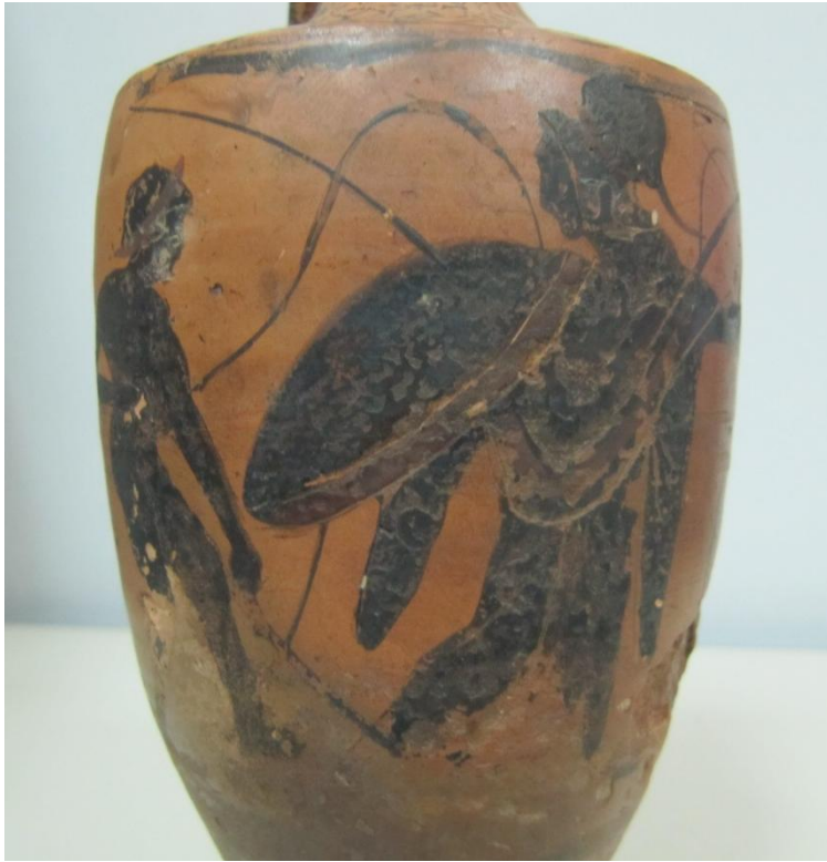
Εικόνα 44: Λήκυθος ΜΑΙΤ 8969, αρ. κατ. 14, λεπτομέρεια.