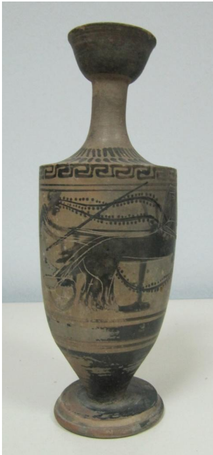
Εικόνα 61: Λήκυθος ΜΑΙΤ 9335, αρ. κατ. 18.