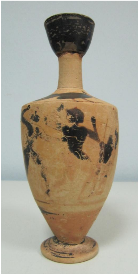
Εικόνα 20: Λήκυθος ΜΑΙΤ 9170, αρ. κατ. 7.