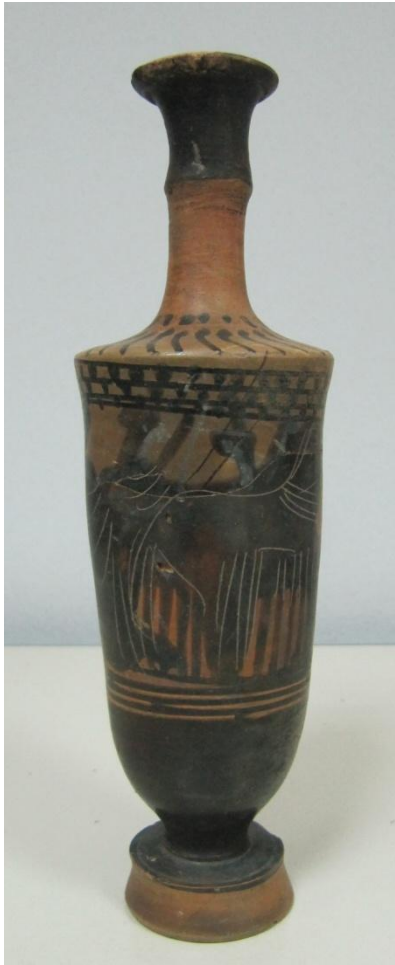
Εικόνα 152: Λήκυθος ΜΑΙΤ 9329, αρ. κατ. 43.