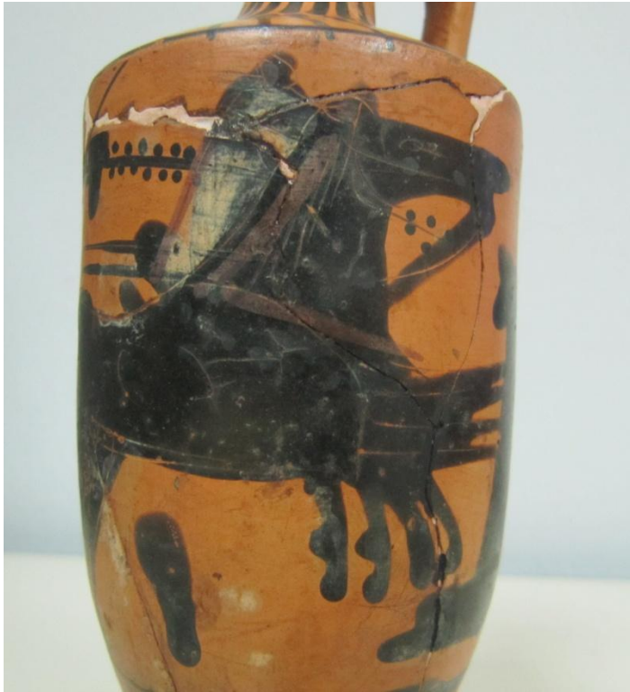
Εικόνα 52: Λήκυθος ΜΑΙΤ 9368, αρ. κατ. 16, λεπτομέρεια.