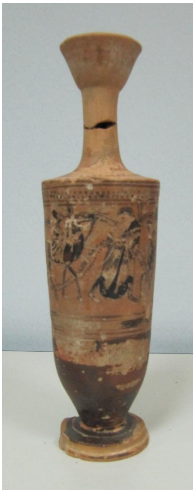
Εικόνα 155: Λήκυθος ΜΑΙΤ 9172, αρ. κατ. 44.