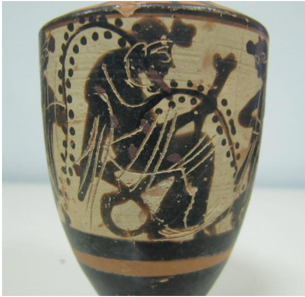
Εικόνα 40: Λήκυθος ΜΑΙΤ 9182, αρ. κατ. 13, λεπτομέρεια.