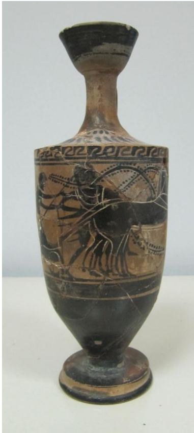
Εικόνα 66: Λήκυθος ΜΑΙΤ 9333, αρ. κατ. 19.