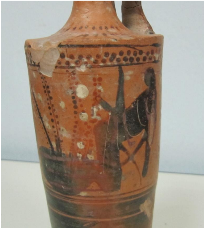
Εικόνα 109: Λήκυθος ΜΑΙΤ 9326, αρ. κατ. 30, λεπτομέρεια.