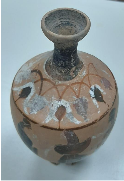
Εικόνα 11: Λήκυθος ΜΑΙΤ 8960, αρ. κατ. 3, διακόσμηση ώμου.