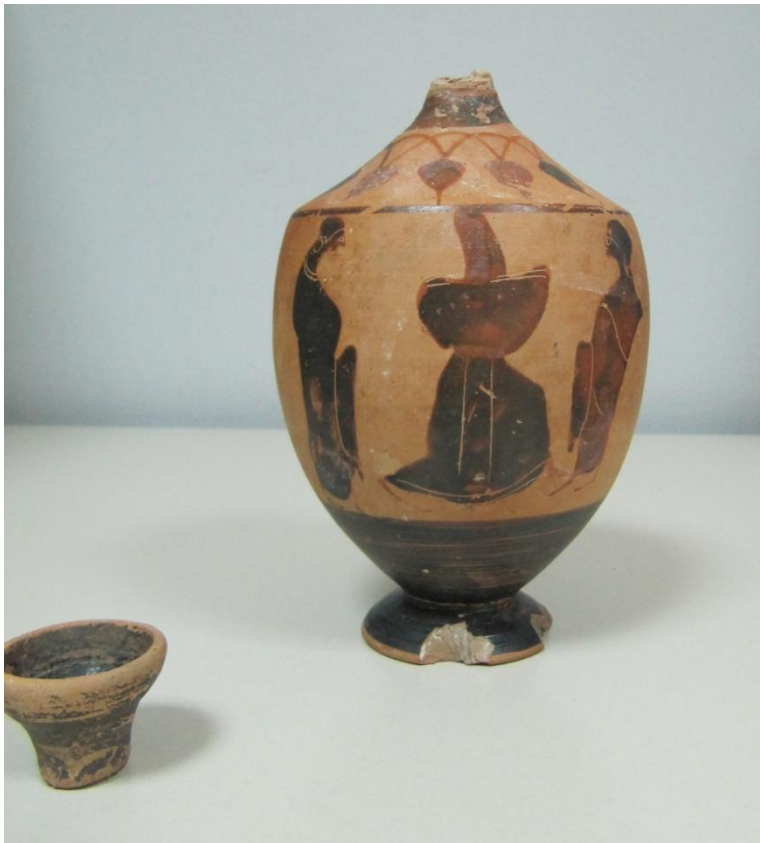
Εικόνα 8: Λήκυθος ΜΑΙΤ 8960, αρ. κατ. 3, μετά τη συντήρηση.