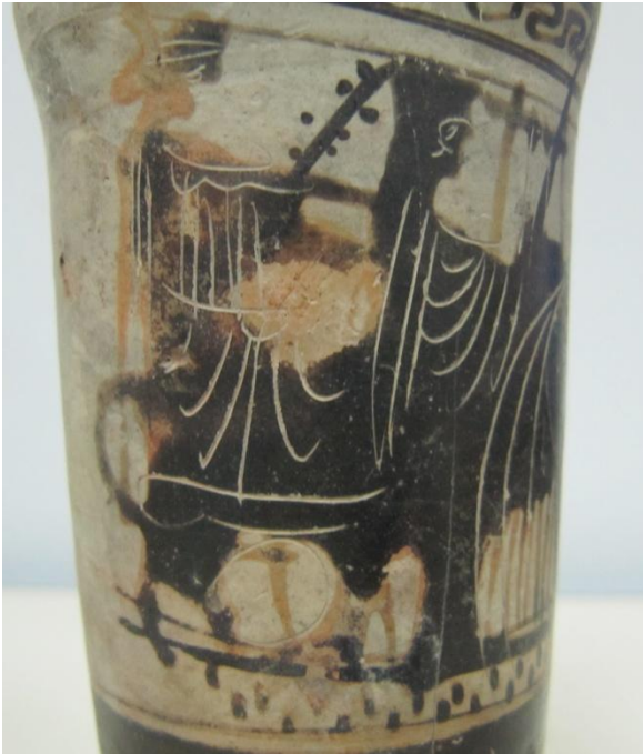
Εικόνα 136: Λήκυθος ΜΑΙΤ 9327, αρ. κατ. 38, λεπτομέρεια.