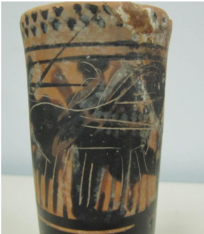
Εικόνα 133: Λήκυθος ΜΑΙΤ 9179, αρ. κατ. 37, λεπτομέρεια.