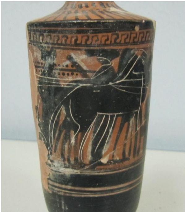
Εικόνα 143: Λήκυθος ΜΑΙΤ 9332, αρ. κατ. 40, λεπτομέρεια.