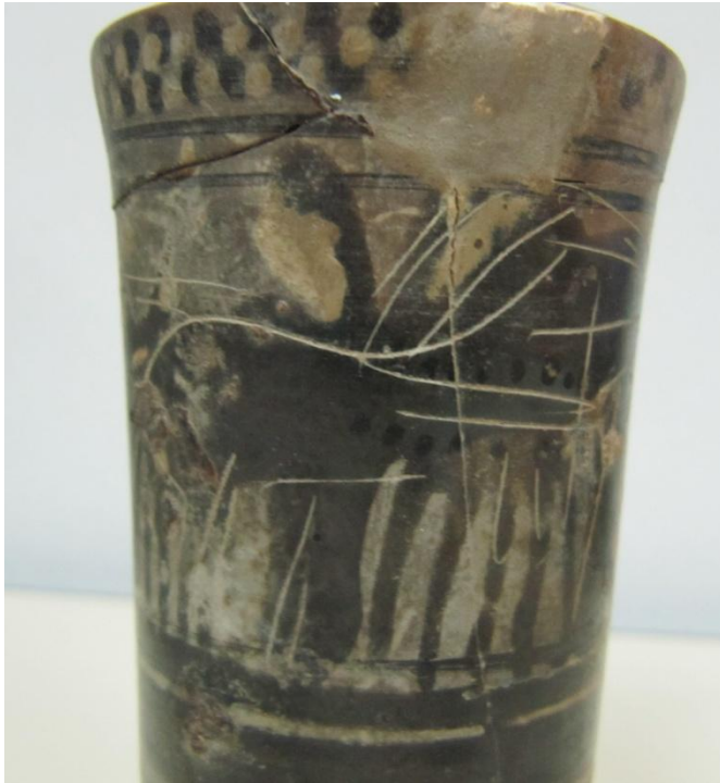
Εικόνα 150: Λήκυθος ΜΑΙΤ 9336, αρ. κατ. 42, λεπτομέρεια.