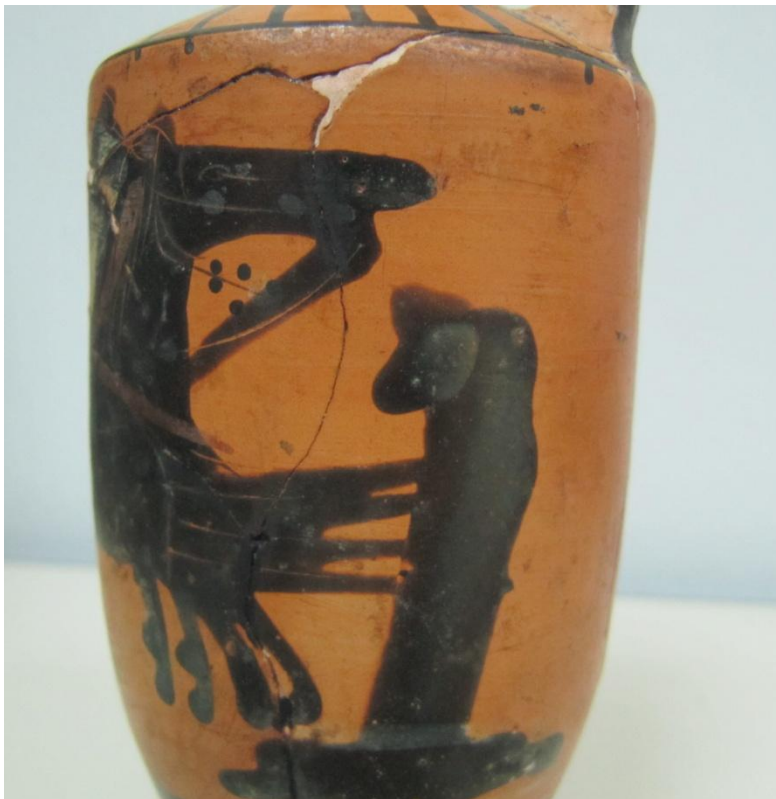
Εικόνα 53: Λήκυθος ΜΑΙΤ 9368, αρ. κατ. 16, λεπτομέρεια.