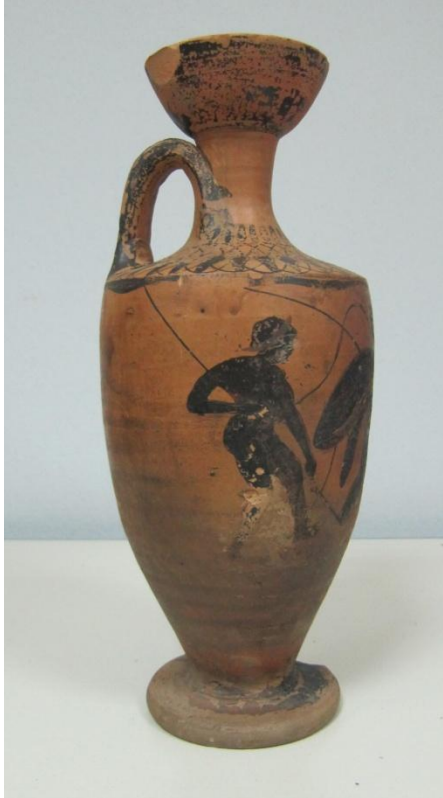
Εικόνα 42: Λήκυθος ΜΑΙΤ 8969, αρ. κατ. 14, πλάγια όψη.