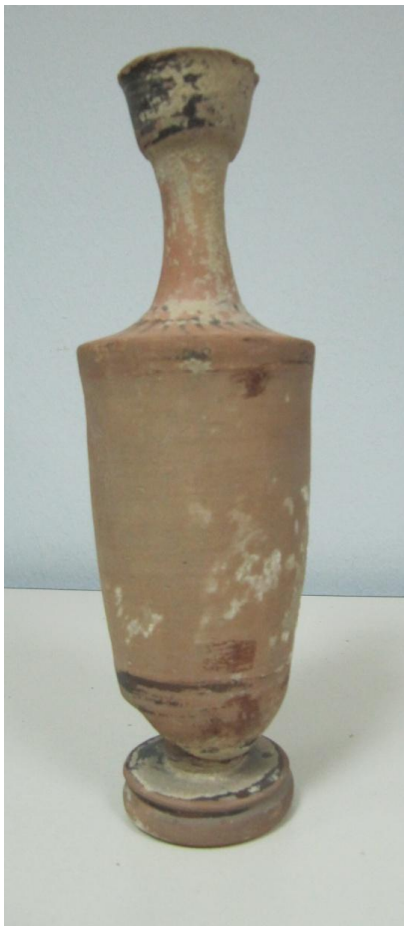
Εικόνα 165: Λήκυθος ΜΑΙΤ 9340, αρ. κατ. 47.