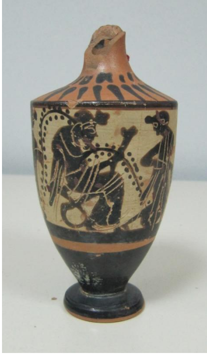
Εικόνα 38: Λήκυθος ΜΑΙΤ 9182, αρ. κατ. 13.