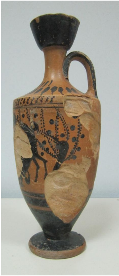
Εικόνα 97: Λήκυθος ΜΑΙΤ 9371, αρ. κατ. 27, πλάγια όψη.