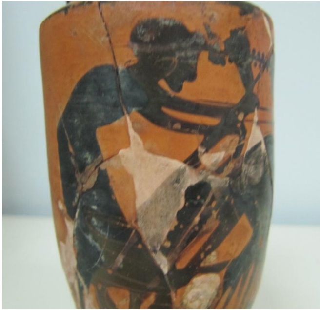
Εικόνα 54: Λήκυθος ΜΑΙΤ 9368, αρ. κατ. 16, λεπτομέρεια.