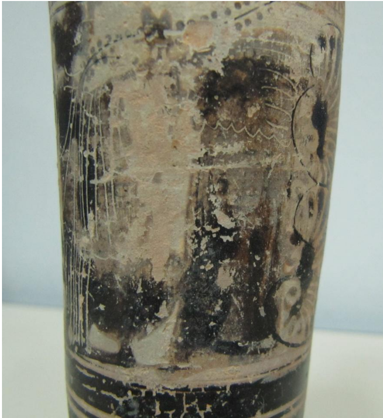
Εικόνα 102: Λήκυθος ΜΑΙΤ 9345, αρ. κατ. 28, λεπτομέρεια.