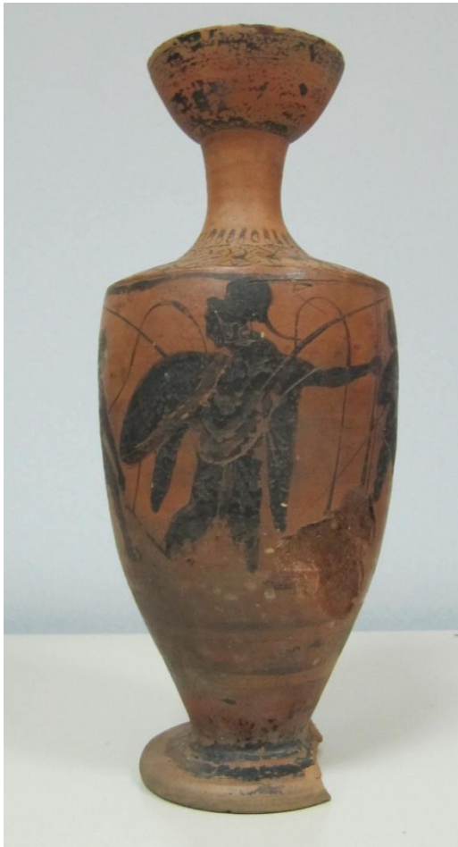
Εικόνα 41: Λήκυθος ΜΑΙΤ 8969, αρ. κατ. 14.