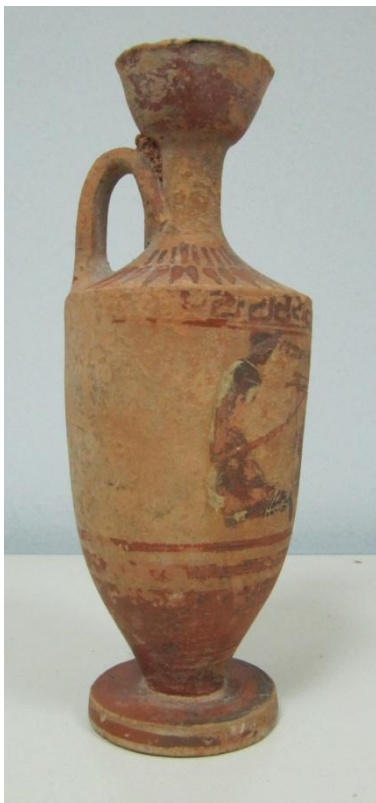
Εικόνα 57: Λήκυθος ΜΑΙΤ 9334, αρ. κατ. 17, πλάγια όψη.