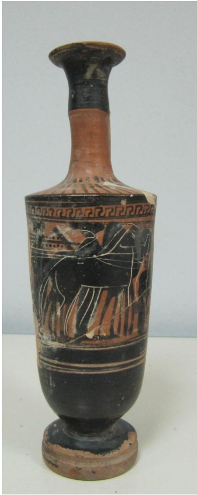
Εικόνα 142: Λήκυθος ΜΑΙΤ 9332, αρ. κατ. 40.