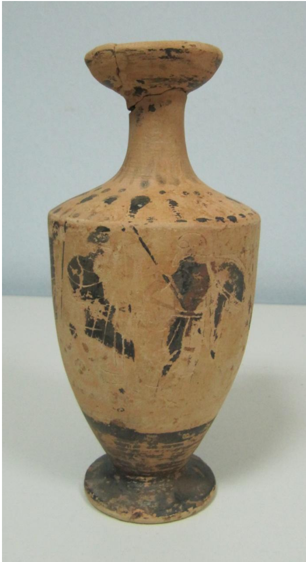
Εικόνα 13: Λήκυθος ΜΑΙΤ 9180, αρ. κατ. 5.