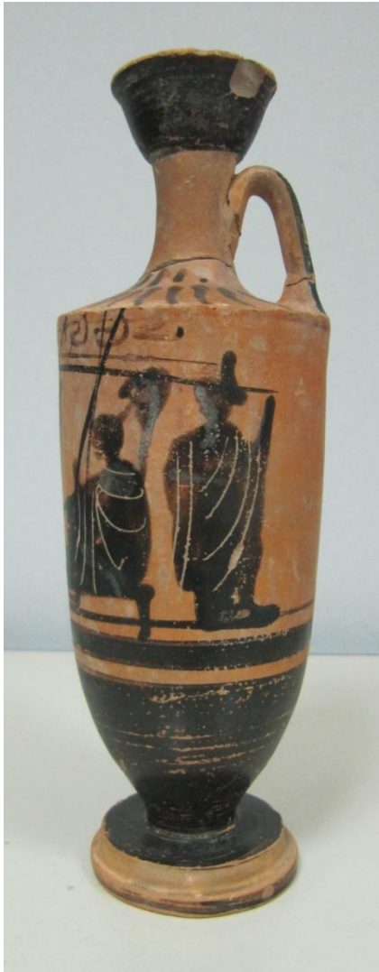
Εικόνα 111: Λήκυθος ΜΑΙΤ 9366, αρ. κατ. 31, πλάγια όψη.