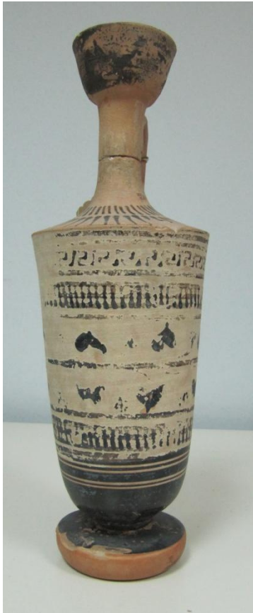
Εικόνα 177: Λήκυθος ΜΑΙΤ 8977, αρ. κατ. 54.