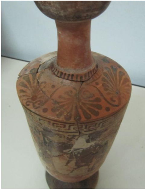
Εικόνα 85: Λήκυθος ΜΑΙΤ 9338, αρ. κατ. 23, διακόσμηση ώμου.