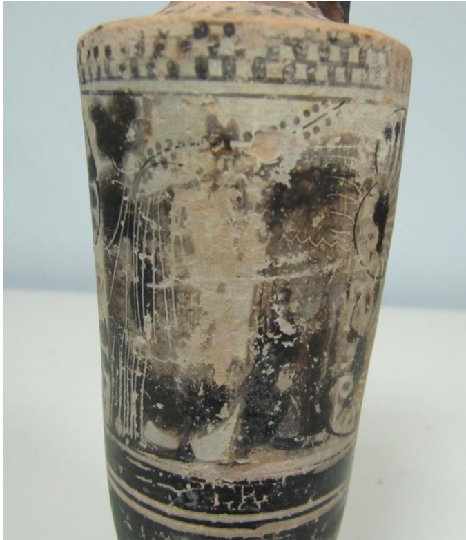
Εικόνα 100: Λήκυθος ΜΑΙΤ 9345, αρ. κατ. 28, λεπτομέρεια.