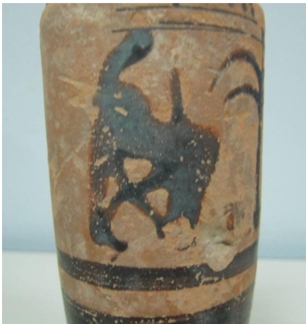
Εικόνα 114: Λήκυθος ΜΑΙΤ 9325, αρ. κατ. 32, λεπτομέρεια.