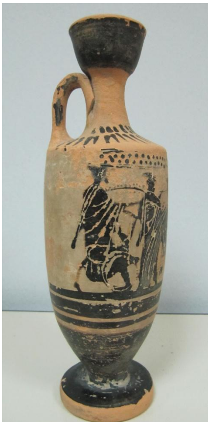
Εικόνα 73: Λήκυθος ΜΑΙΤ 9173, αρ. κατ. 20, πλάγια όψη.