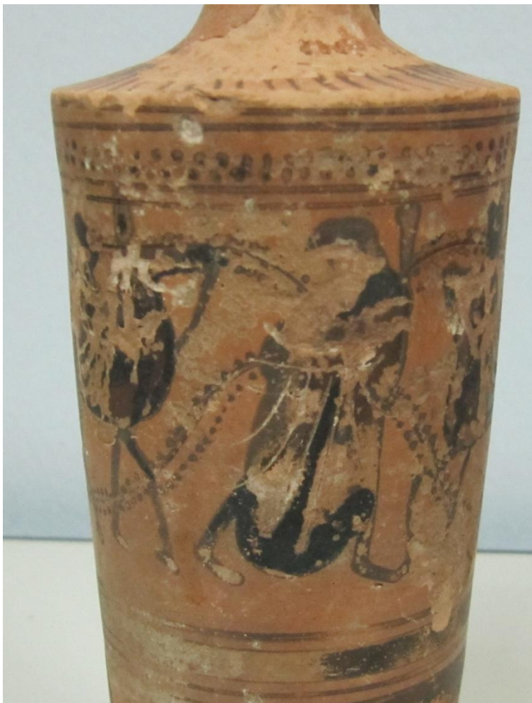
Εικόνα 157: Λήκυθος ΜΑΙΤ 9172, αρ. κατ. 44, λεπτομέρεια.