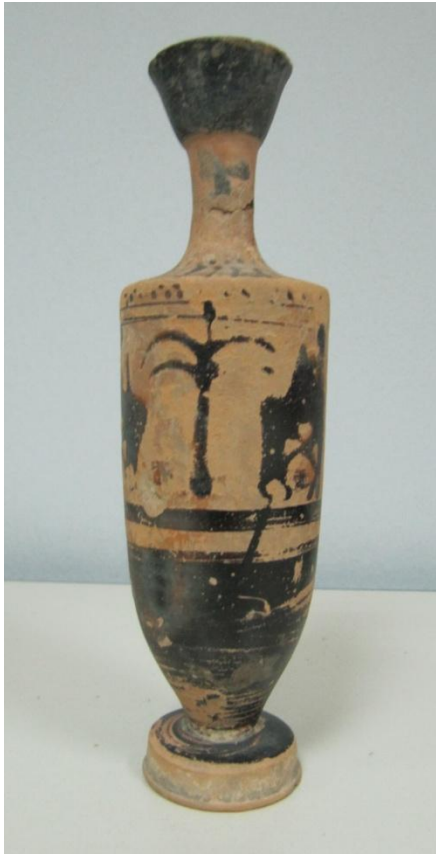
Εικόνα 113: Λήκυθος ΜΑΙΤ 9325, αρ. κατ. 32.