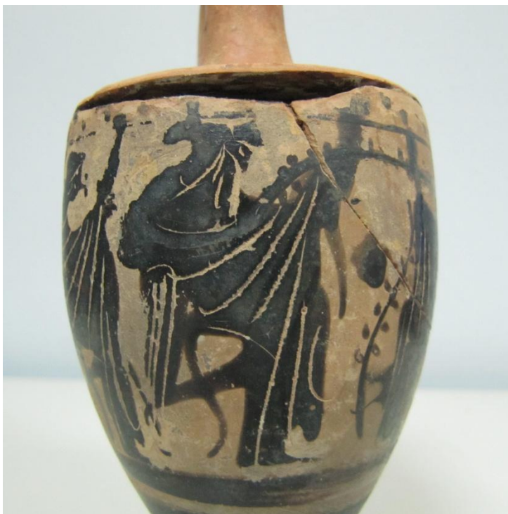
Εικόνα 37: Λήκυθος ΜΑΙΤ 9375, αρ. κατ. 12, λεπτομέρεια.