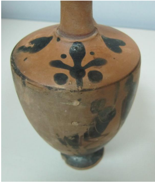
Εικόνα 30: Λήκυθος ΜΑΙΤ 9181, αρ. κατ. 10, διακόσμηση ώμου.