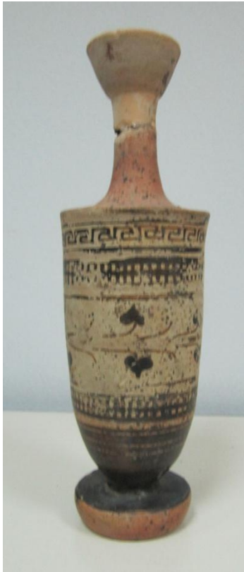
Εικόνα 179: Λήκυθος ΜΑΙΤ 9346, αρ. κατ. 56.