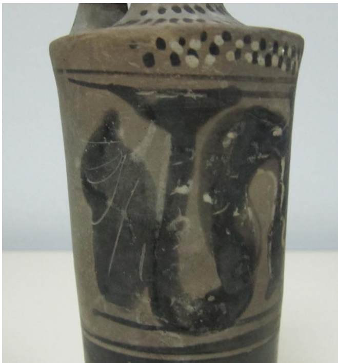
Εικόνα 161: Λήκυθος ΜΑΙΤ 9367, αρ. κατ. 45, λεπτομέρεια.