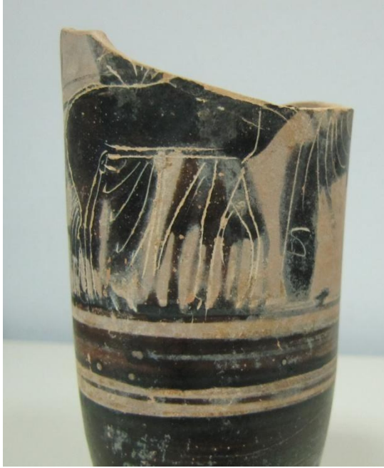
Εικόνα 122: Λήκυθος ΜΑΙΤ 9133, αρ. κατ. 34, λεπτομέρεια.