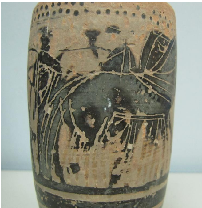
Εικόνα 75: Λήκυθος ΜΑΙΤ 9173, αρ. κατ. 20, λεπτομέρεια.