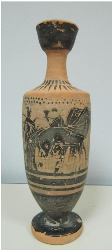
Εικόνα 71: Λήκυθος ΜΑΙΤ 9173, αρ. κατ. 20.