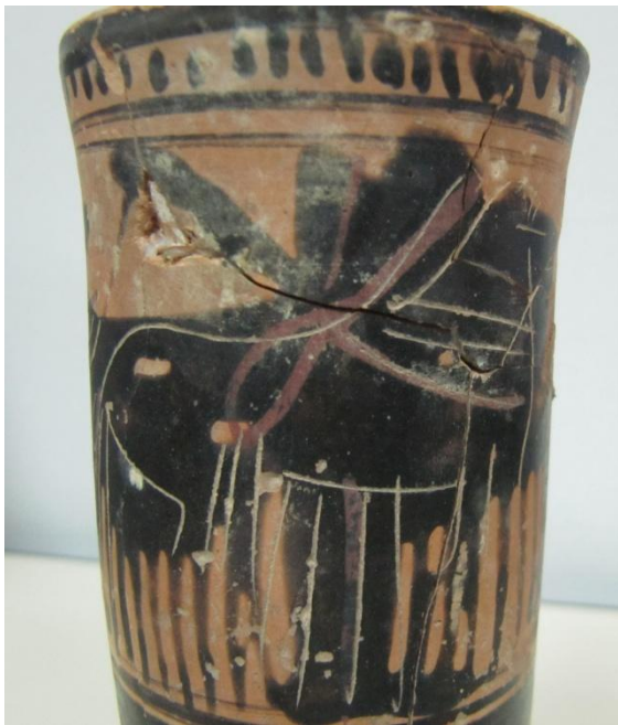
Εικόνα 129: Λήκυθος ΜΑΙΤ 9324, αρ. κατ. 36, λεπτομέρεια.