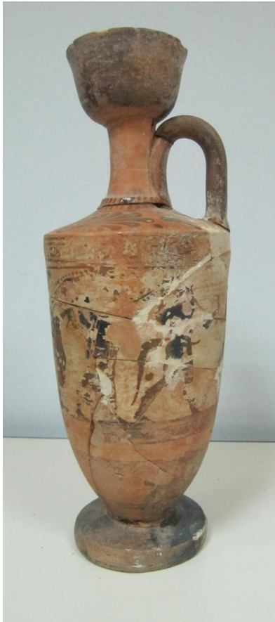
Εικόνα 83: Λήκυθος ΜΑΙΤ 9338, αρ. κατ. 23, πλάγια όψη.