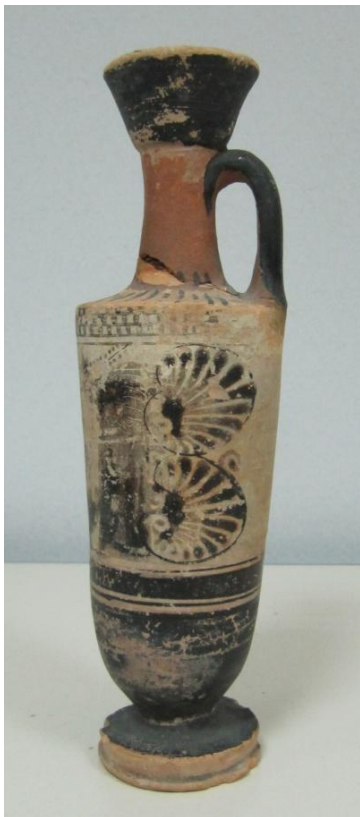
Εικόνα 99: Λήκυθος ΜΑΙΤ 9345, αρ. κατ. 28, πλάγια όψη.