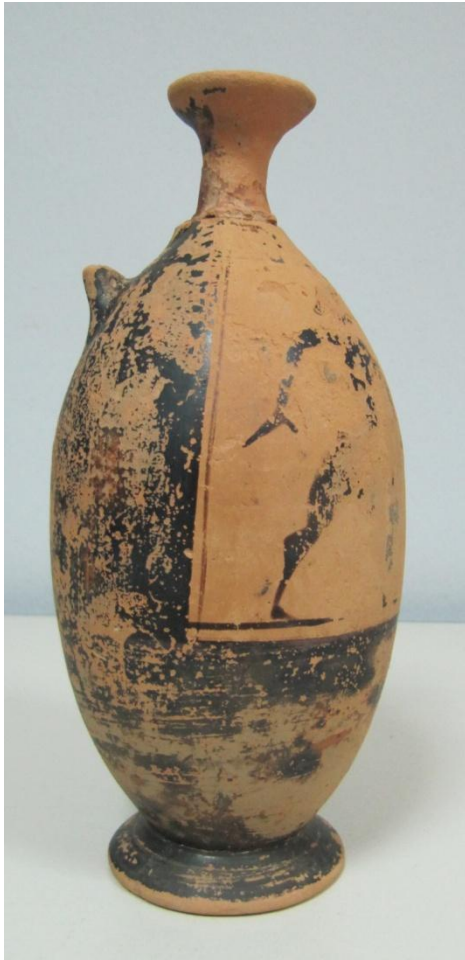
Εικόνα 5: Λήκυθος ΜΑΙΤ 8959, αρ. κατ. 2, πλάγια όψη.