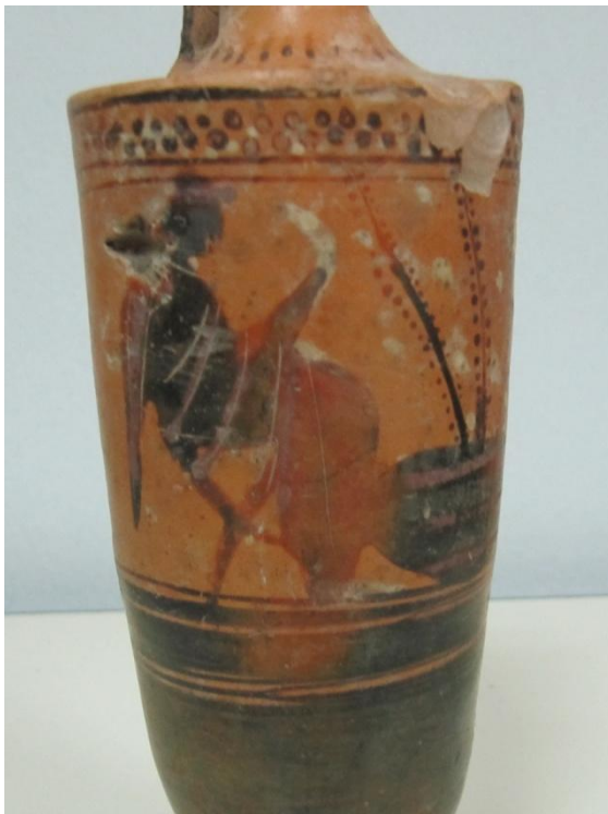
Εικόνα 108: Λήκυθος ΜΑΙΤ 9326, αρ. κατ. 30, λεπτομέρεια.