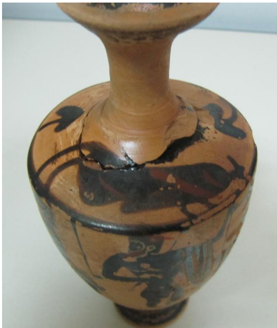
Εικόνα 25: Λήκυθος ΜΑΙΤ 9176, αρ. κατ. 8, διακόσμηση ώμου.