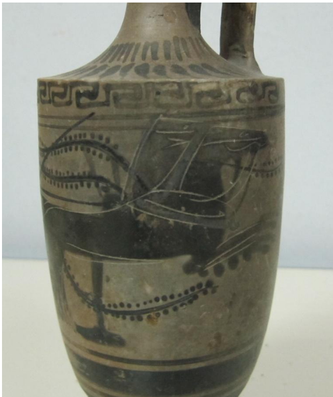
Εικόνα 65: Λήκυθος ΜΑΙΤ 9335, αρ. κατ. 18, λεπτομέρεια.