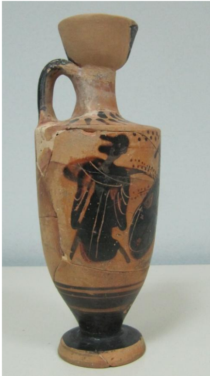
Εικόνα 48: Λήκυθος ΜΑΙΤ 9175, αρ. κατ. 15, πλάγια όψη.