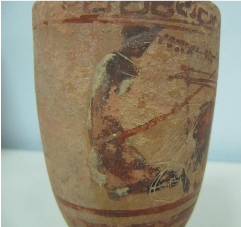
Εικόνα 60: Λήκυθος ΜΑΙΤ 9334, αρ. κατ. 17, λεπτομέρεια.