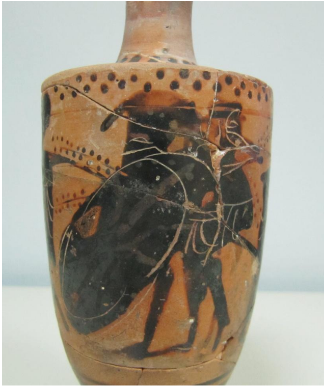
Εικόνα 50: Λήκυθος ΜΑΙΤ 9175, αρ. κατ. 15, λεπτομέρεια.