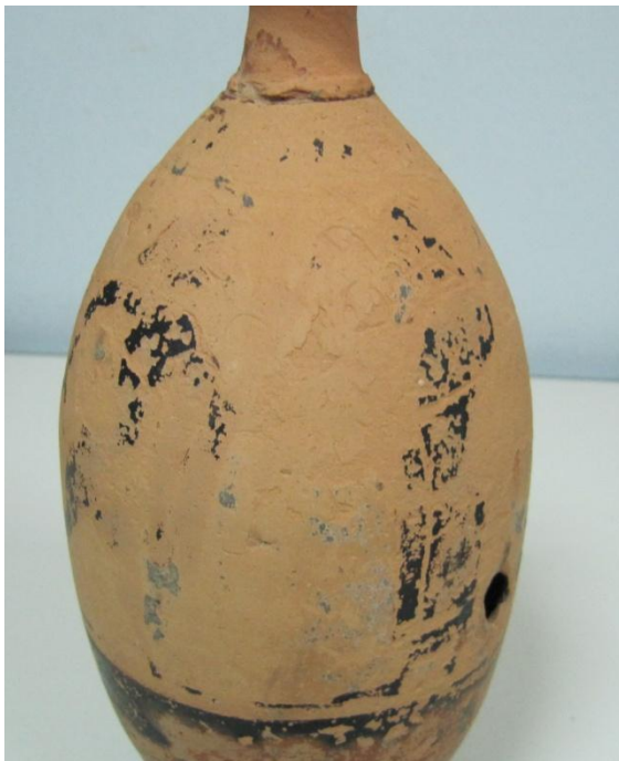
Εικόνα 6: Λήκυθος ΜΑΙΤ 8959, αρ. κατ. 2, λεπτομέρεια.