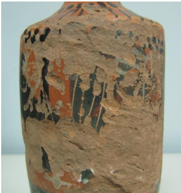
Εικόνα 78: Λήκυθος ΜΑΙΤ 9331, αρ. κατ. 21, λεπτομέρεια.