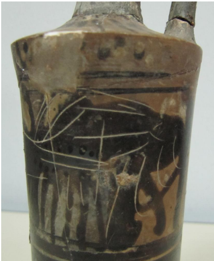
Εικόνα 151: Λήκυθος ΜΑΙΤ 9336, αρ. κατ. 42, λεπτομέρεια.