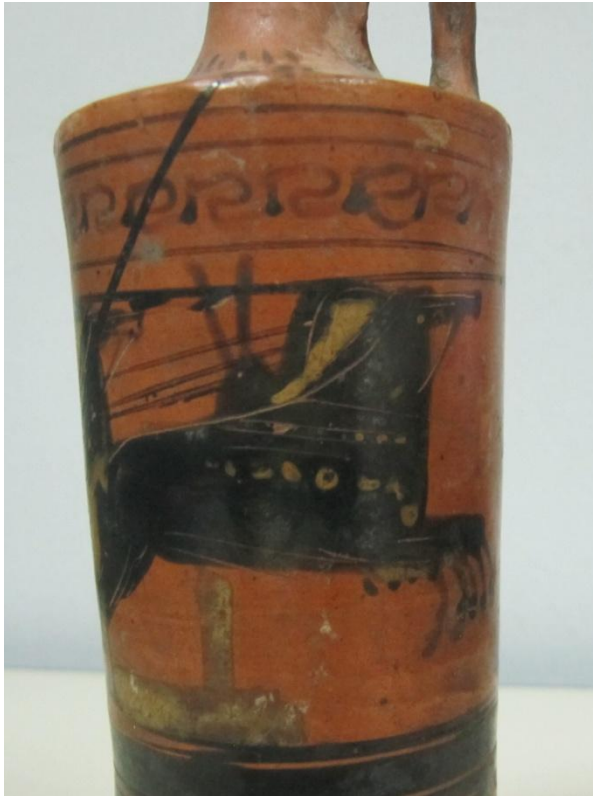
Εικόνα 126: Λήκυθος ΜΑΙΤ 9185, αρ. κατ. 35, λεπτομέρεια.