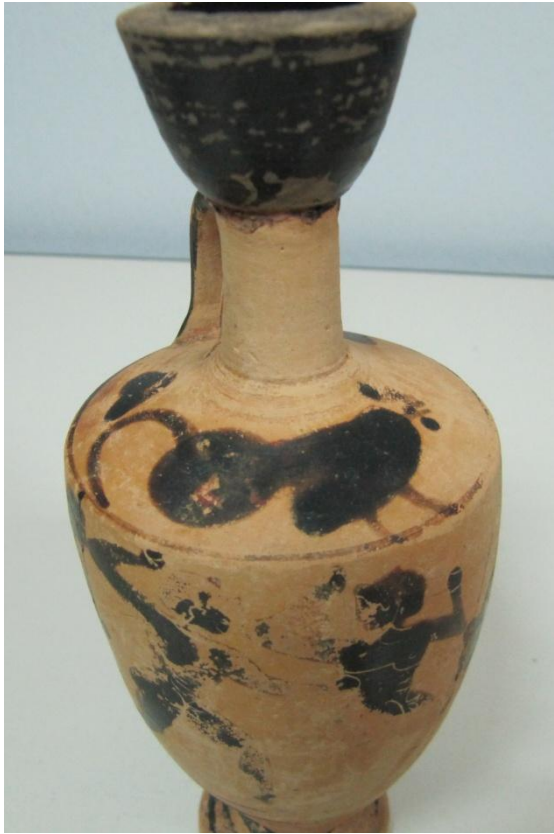
Εικόνα 22: Λήκυθος ΜΑΙΤ 9170, αρ. κατ. 7, διακόσμηση ώμου.