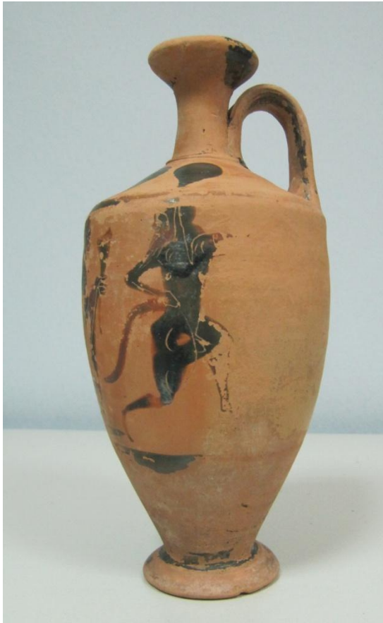
Εικόνα 32: Λήκυθος ΜΑΙΤ 9357, αρ. κατ. 11, πλάγια όψη.