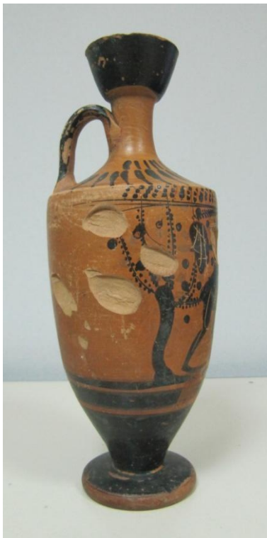
Εικόνα 96: Λήκυθος ΜΑΙΤ 9371, αρ. κατ. 27, πλάγια όψη.