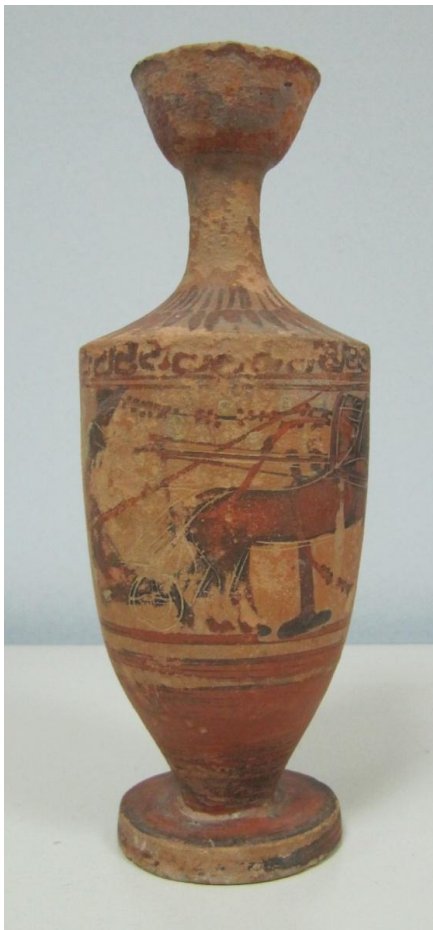
Εικόνα 55: Λήκυθος ΜΑΙΤ 9334, αρ. κατ. 17.