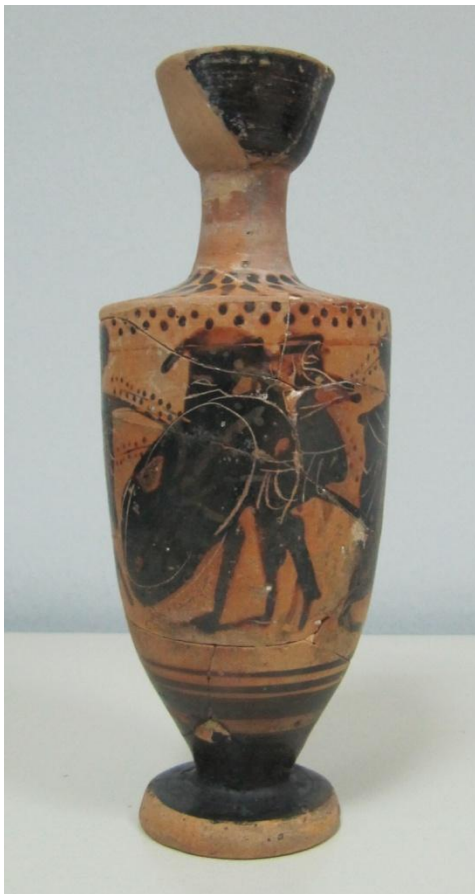
Εικόνα 47: Λήκυθος ΜΑΙΤ 9175, αρ. κατ. 15.