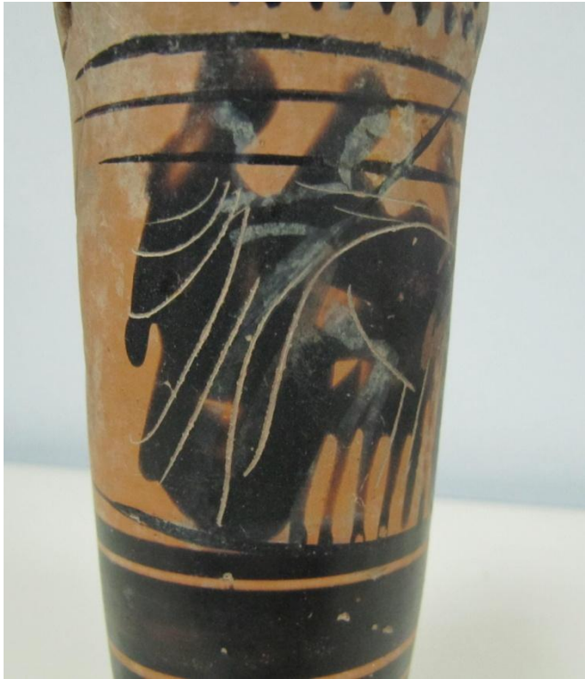
Εικόνα 132: Λήκυθος ΜΑΙΤ 9179, αρ. κατ. 37, λεπτομέρεια.