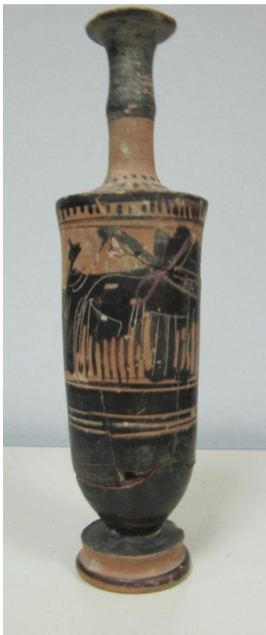
Εικόνα 127: Λήκυθος ΜΑΙΤ 9324, αρ. κατ. 36.