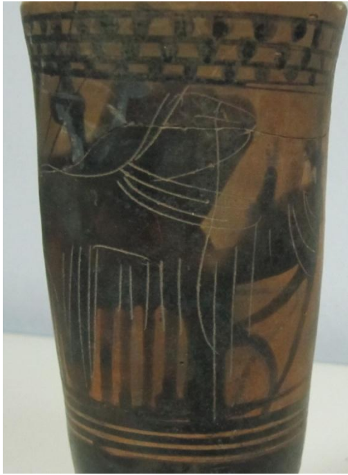
Εικόνα 154: Λήκυθος ΜΑΙΤ 9329, αρ. κατ. 43, λεπτομέρεια.