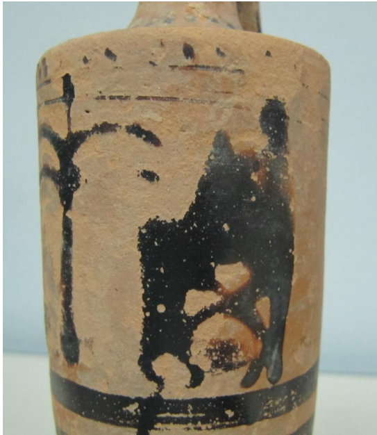
Εικόνα 115: Λήκυθος ΜΑΙΤ 9325, αρ. κατ. 32, λεπτομέρεια.