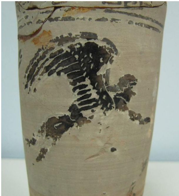
Εικόνα 175: Λήκυθος ΜΑΙΤ 9341, αρ. κατ. 52, λεπτομέρεια.