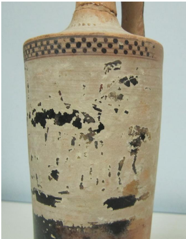
Εικόνα 169: Λήκυθος ΜΑΙΤ 9343, αρ. κατ. 49, λεπτομέρεια.