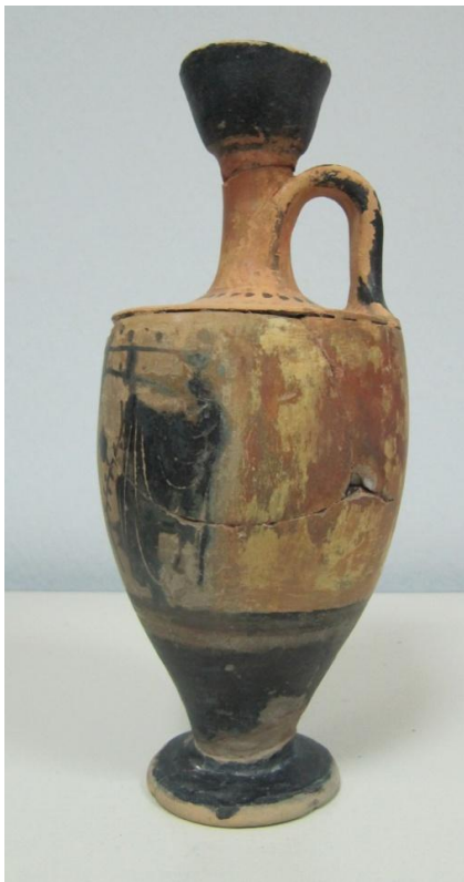
Εικόνα 35: Λήκυθος ΜΑΙΤ 9375, αρ. κατ. 12, πλάγια όψη.