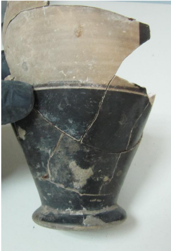
Εικόνα 28: Λήκυθος ΜΑΙΤ 9126, αρ. κατ. 9.