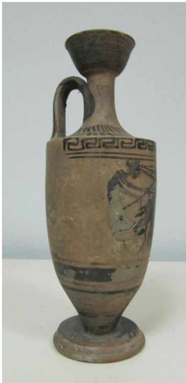
Εικόνα 63: Λήκυθος ΜΑΙΤ 9335, αρ. κατ. 18, πλάγια όψη.