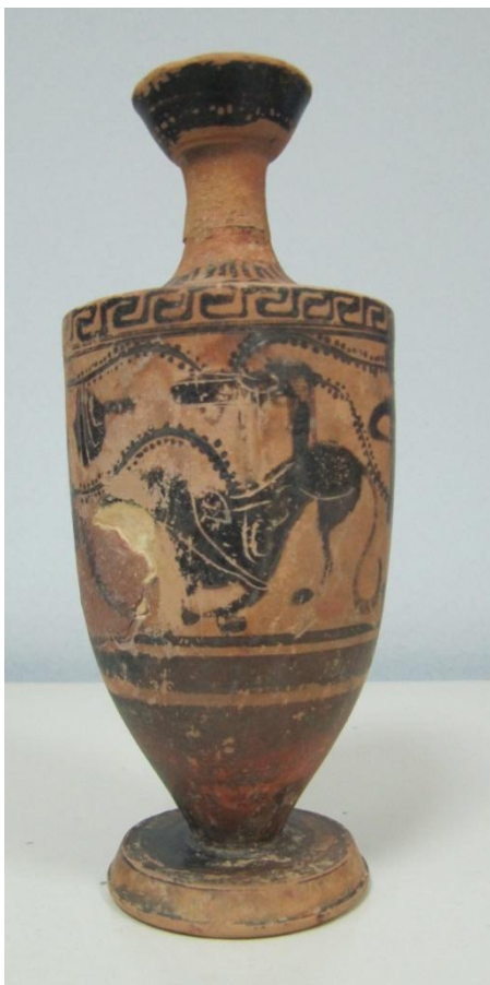
Εικόνα 90: Λήκυθος ΜΑΙΤ 9174, αρ. κατ. 25.