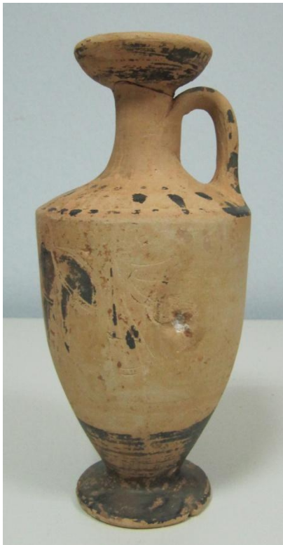
Εικόνα 15: Λήκυθος ΜΑΙΤ 9180, αρ. κατ. 5, πλάγια όψη.