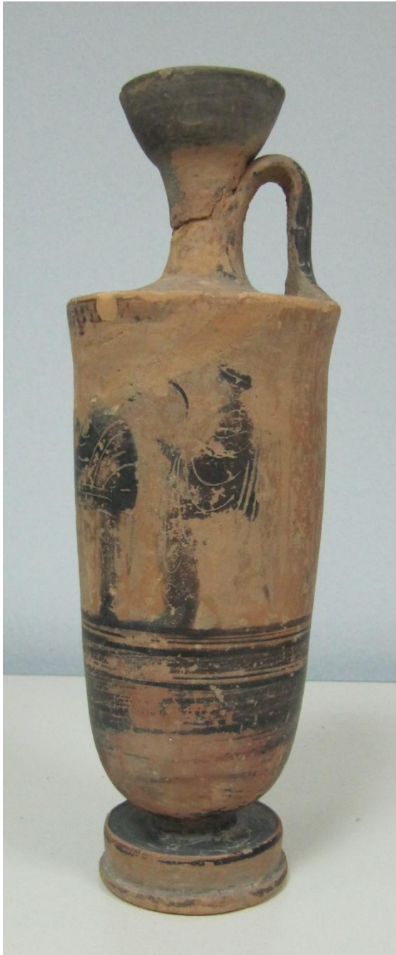
Εικόνα 119: Λήκυθος ΜΑΙΤ 9328, αρ. κατ. 33, πλάγια όψη.