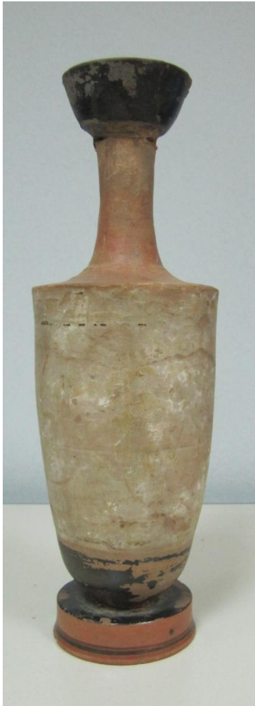
Εικόνα 176: Λήκυθος ΜΑΙΤ 8957, αρ. κατ. 53.