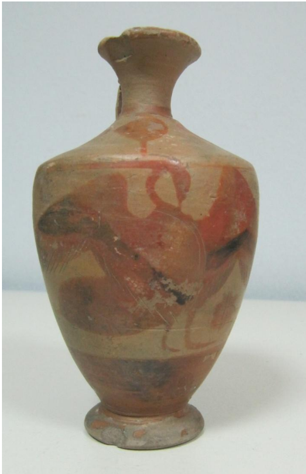
Εικόνα 12: Λήκυθος ΜΑΙΤ 9372, αρ. κατ. 4.