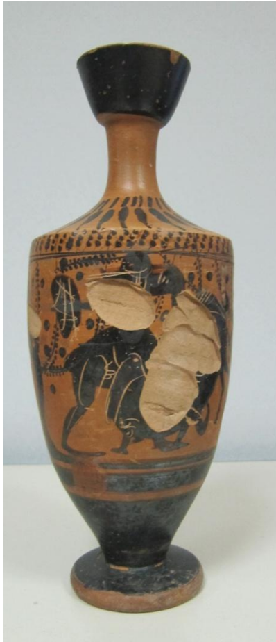
Εικόνα 95: Λήκυθος ΜΑΙΤ 9371, αρ. κατ. 27.