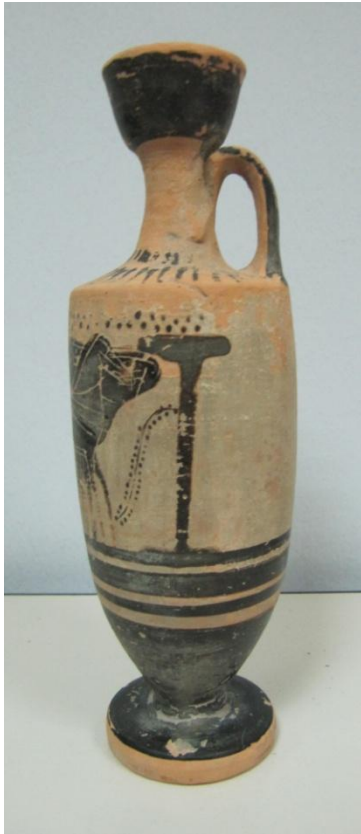
Εικόνα 72: Λήκυθος ΜΑΙΤ 9173, αρ. κατ. 20, πλάγια όψη.