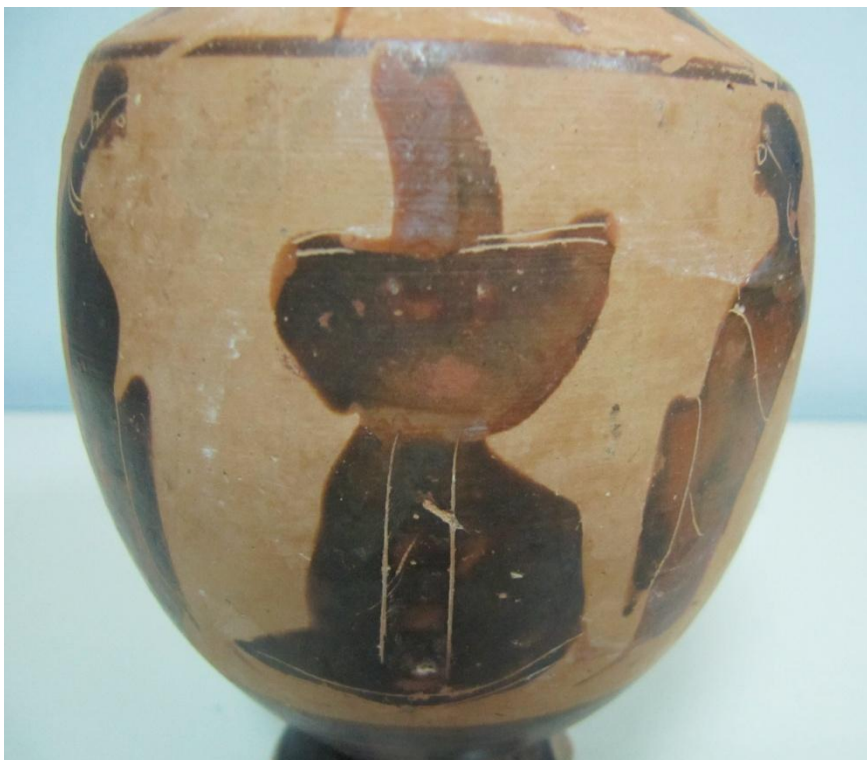
Εικόνα 10: Λήκυθος ΜΑΙΤ 8960, αρ. κατ. 3, λεπτομέρεια.