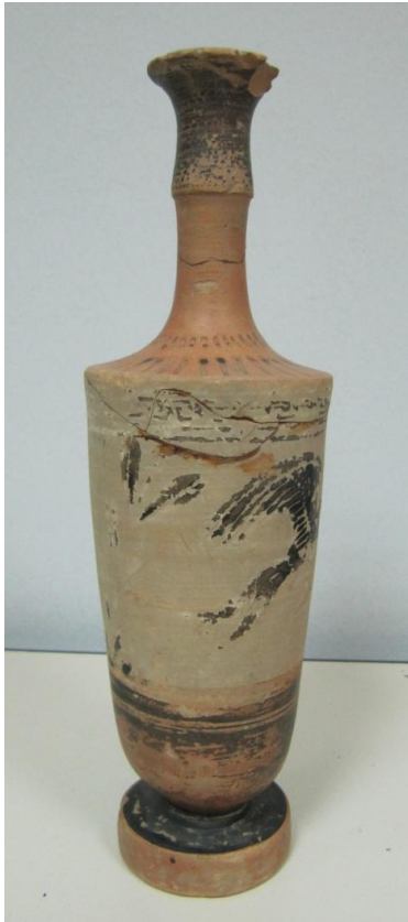
Εικόνα 174: Λήκυθος ΜΑΙΤ 9341, αρ. κατ. 52.