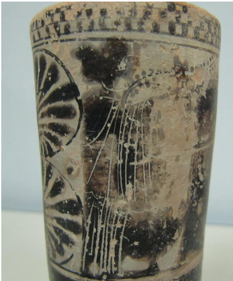
Εικόνα 101: Λήκυθος ΜΑΙΤ 9345, αρ. κατ. 28, λεπτομέρεια.