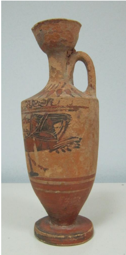
Εικόνα 56: Λήκυθος ΜΑΙΤ 9334, αρ. κατ. 17, πλάγια όψη.