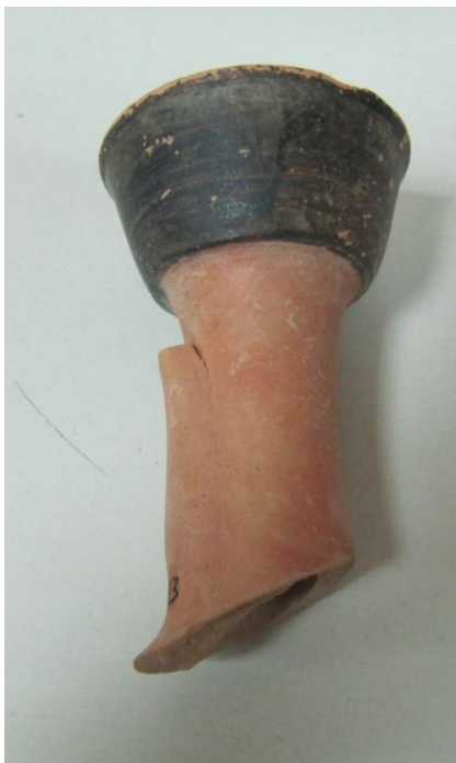
Εικόνα 184: Λήκυθος ΜΑΙΤ 9113, αρ. κατ. 61.