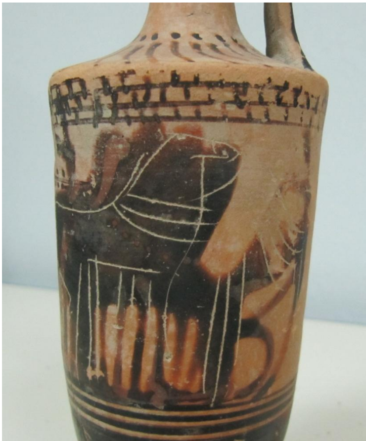
Εικόνα 147: Λήκυθος ΜΑΙΤ 9337, αρ. κατ. 41, λεπτομέρεια.