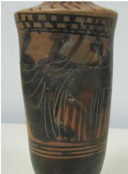
Εικόνα 153: Λήκυθος ΜΑΙΤ 9329, αρ. κατ. 43, λεπτομέρεια.