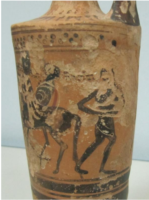
Εικόνα 158: Λήκυθος ΜΑΙΤ 9172, αρ. κατ. 44, λεπτομέρεια.