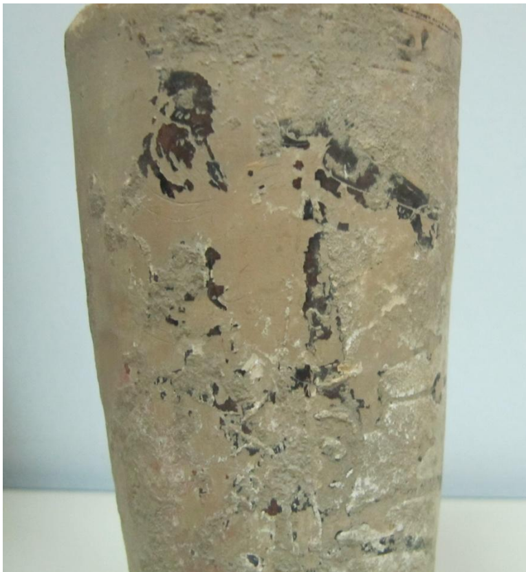
Εικόνα 167: Λήκυθος ΜΑΙΤ 9342, αρ. κατ. 48, λεπτομέρεια.