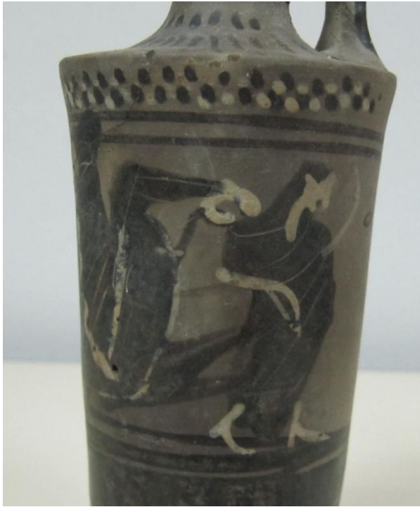
Εικόνα 160: Λήκυθος ΜΑΙΤ 9367, αρ. κατ. 45, λεπτομέρεια.