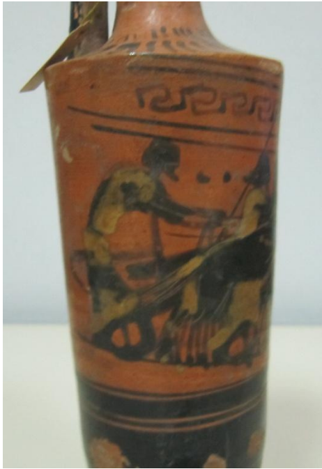
Εικόνα 124: Λήκυθος ΜΑΙΤ 9185, αρ. κατ. 35, λεπτομέρεια.