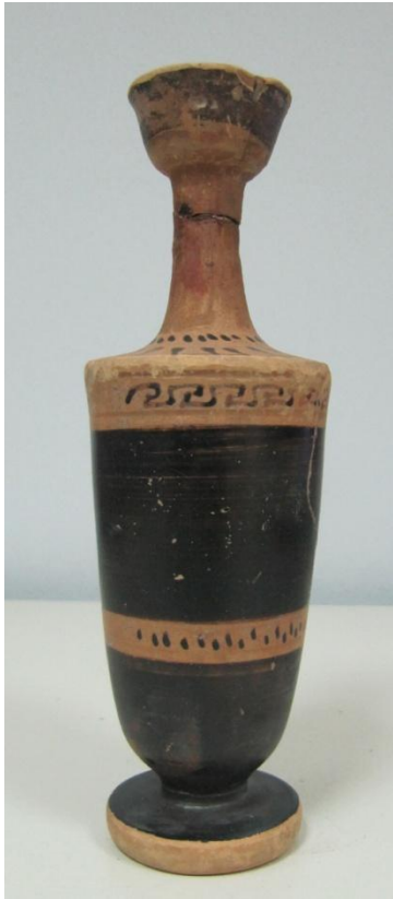
Εικόνα 183: Λήκυθος ΜΑΙΤ 9356, αρ. κατ. 60.