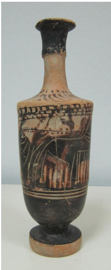
Εικόνα 145: Λήκυθος ΜΑΙΤ 9337, αρ. κατ. 41.