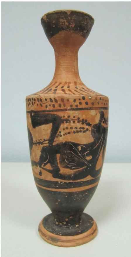
Εικόνα 88: Λήκυθος ΜΑΙΤ 9169, αρ. κατ. 24.