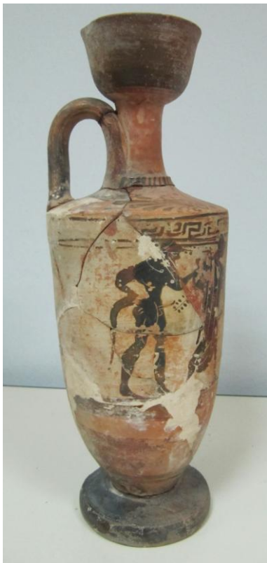
Εικόνα 84: Λήκυθος ΜΑΙΤ 9338, αρ. κατ. 23, πλάγια όψη.