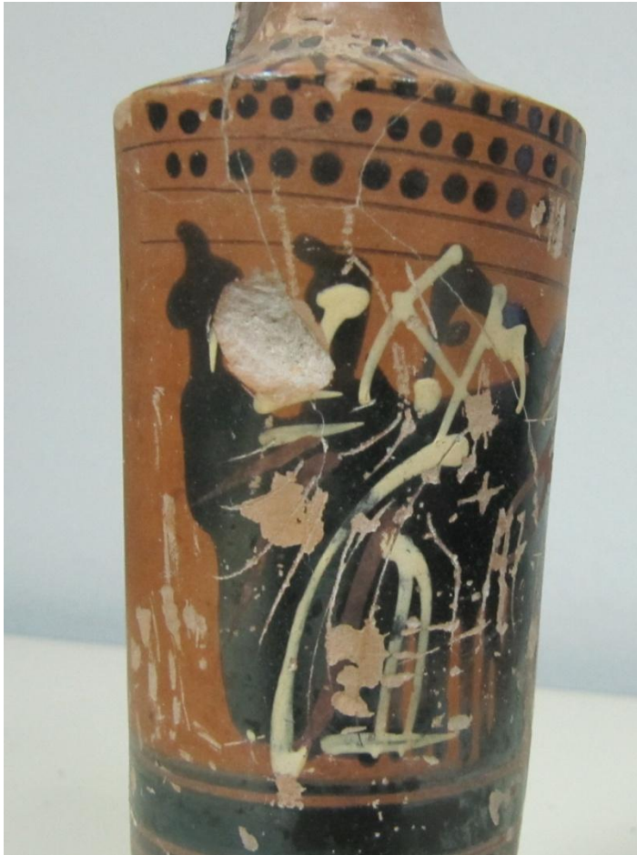
Εικόνα 140: Λήκυθος ΜΑΙΤ 9330, αρ. κατ. 39, λεπτομέρεια.