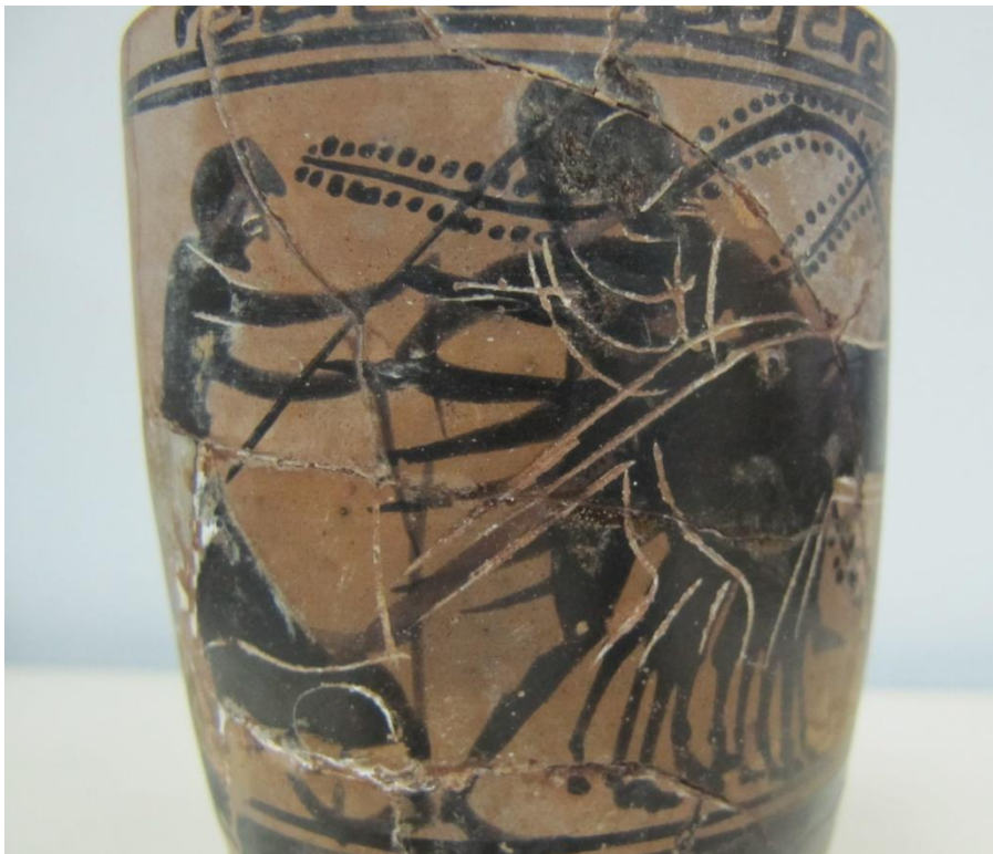
Εικόνα 69: Λήκυθος ΜΑΙΤ 9333, αρ. κατ. 19, λεπτομέρεια.