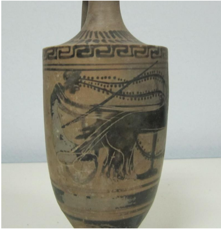
Εικόνα 64: Λήκυθος ΜΑΙΤ 9335, αρ. κατ. 18, λεπτομέρεια.