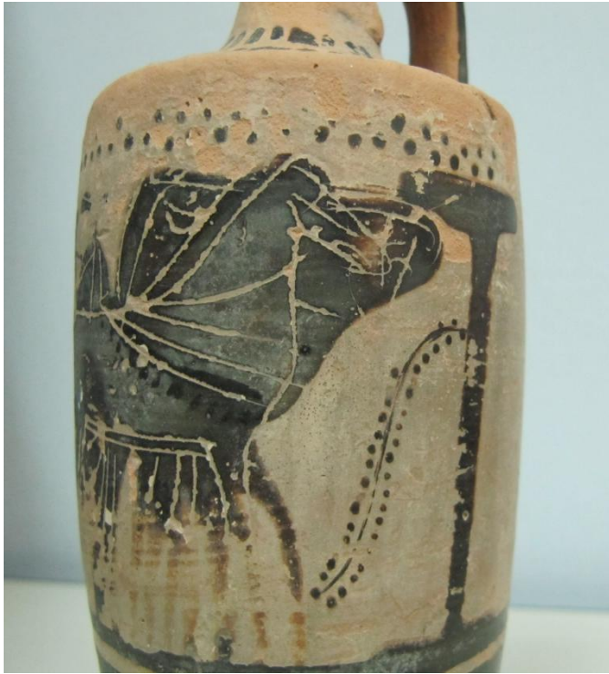
Εικόνα 76: Λήκυθος ΜΑΙΤ 9173, αρ. κατ. 20, λεπτομέρεια.