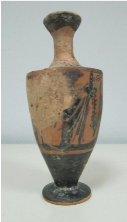
Εικόνα 79: Λήκυθος ΜΑΙΤ 9184, αρ. κατ. 22.