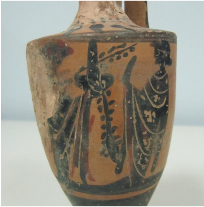
Εικόνα 81: Λήκυθος ΜΑΙΤ 9184, αρ. κατ. 22, λεπτομέρεια.