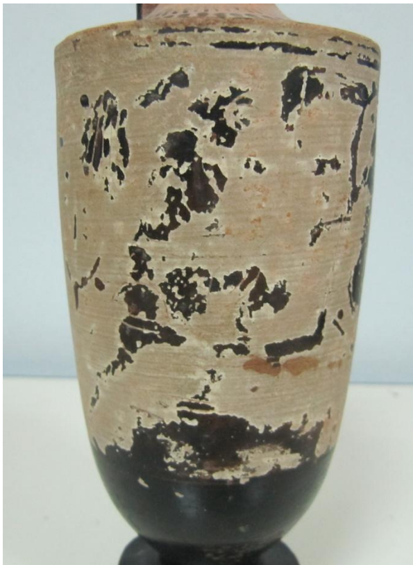
Εικόνα 171: Λήκυθος ΜΑΙΤ 9344, αρ. κατ. 50, λεπτομέρεια.