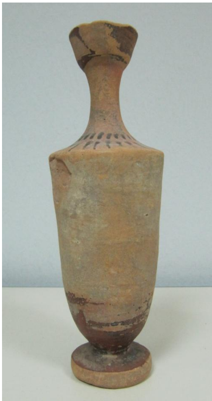
Εικόνα 173: Λήκυθος ΜΑΙΤ 9353, αρ. κατ. 51.