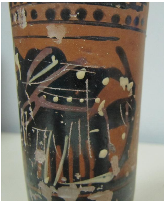
Εικόνα 141: Λήκυθος ΜΑΙΤ 9330, αρ. κατ. 39, λεπτομέρεια.