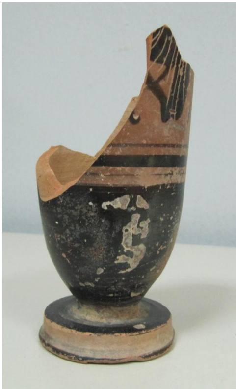
Εικόνα 163: Λήκυθος ΜΑΙΤ 8966, αρ. κατ. 46.