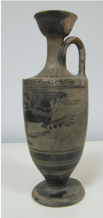
Εικόνα 62: Λήκυθος ΜΑΙΤ 9335, αρ. κατ. 18, πλάγια όψη.