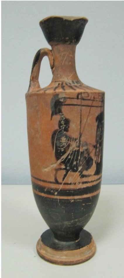
Εικόνα 112: Λήκυθος ΜΑΙΤ 9366, αρ. κατ. 31, πλάγια όψη.