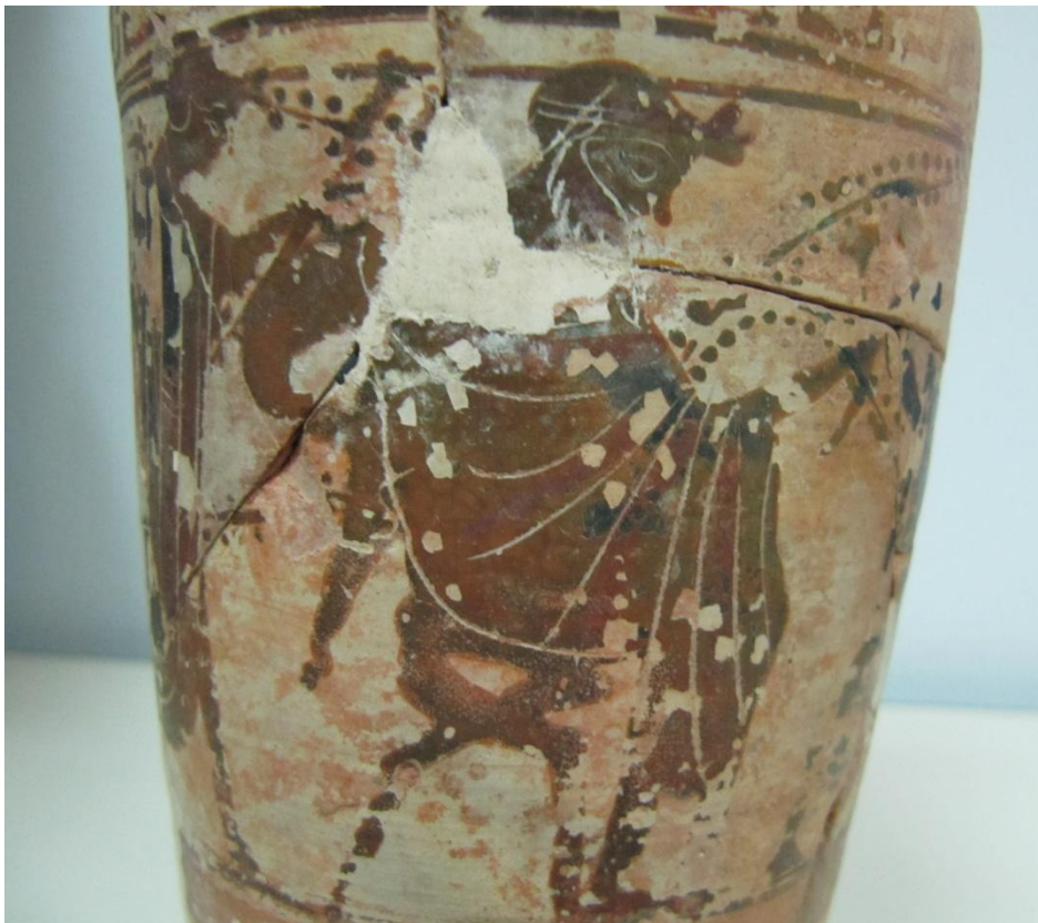
Εικόνα 86: Λήκυθος ΜΑΙΤ 9338, αρ. κατ. 23, λεπτομέρεια.