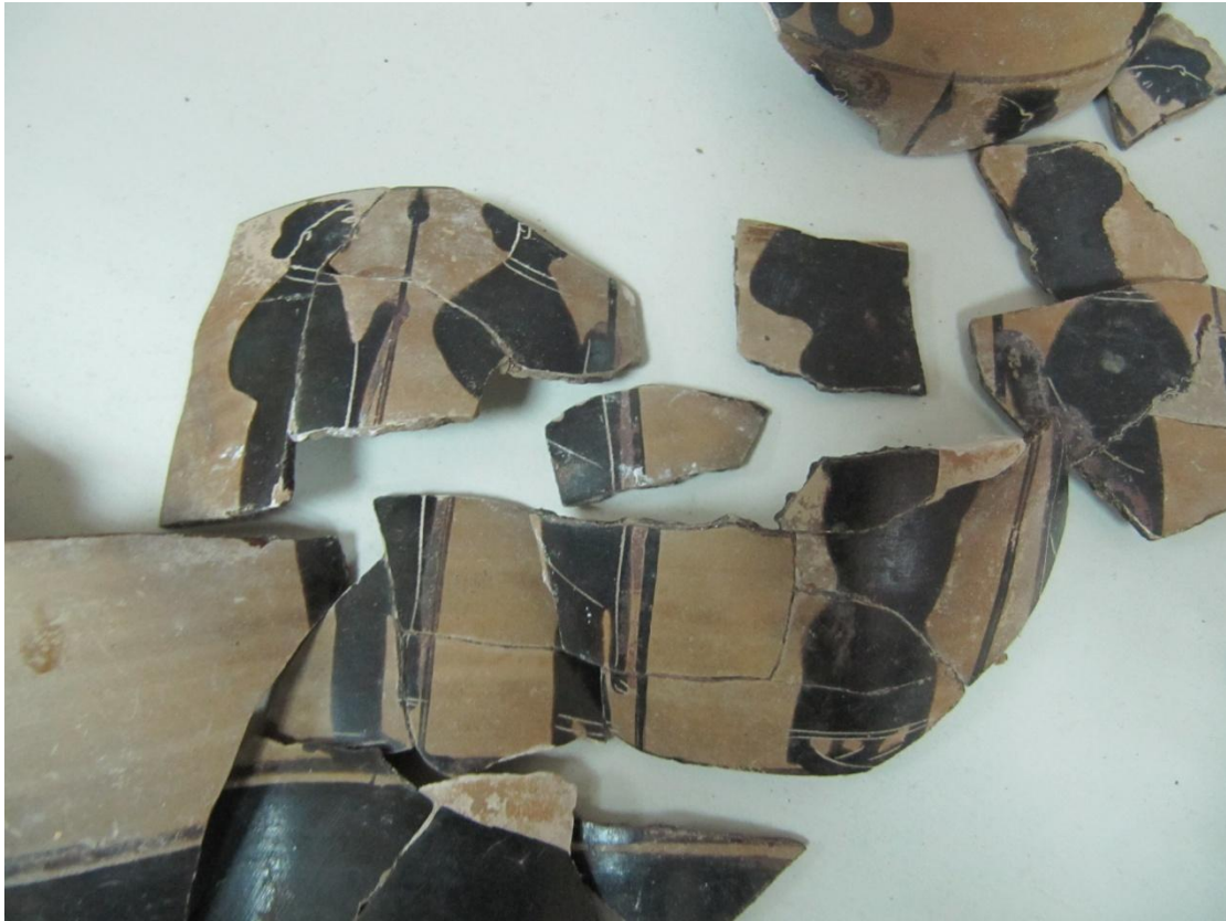
Εικόνα 26: Λήκυθος ΜΑΙΤ 9126, αρ. κατ. 9.