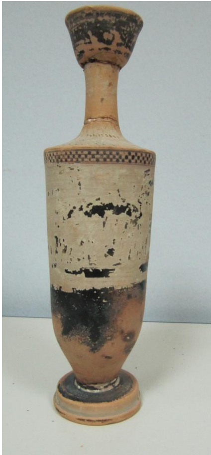
Εικόνα 168: Λήκυθος ΜΑΙΤ 9343, αρ. κατ. 49.