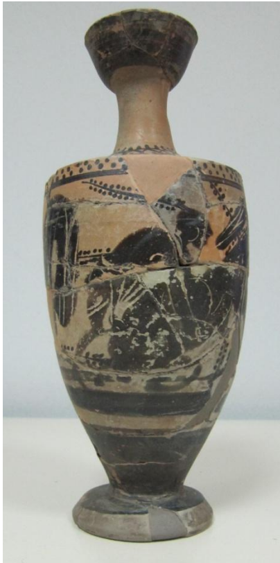
Εικόνα 93: Λήκυθος ΜΑΙΤ 9373, αρ. κατ. 26.