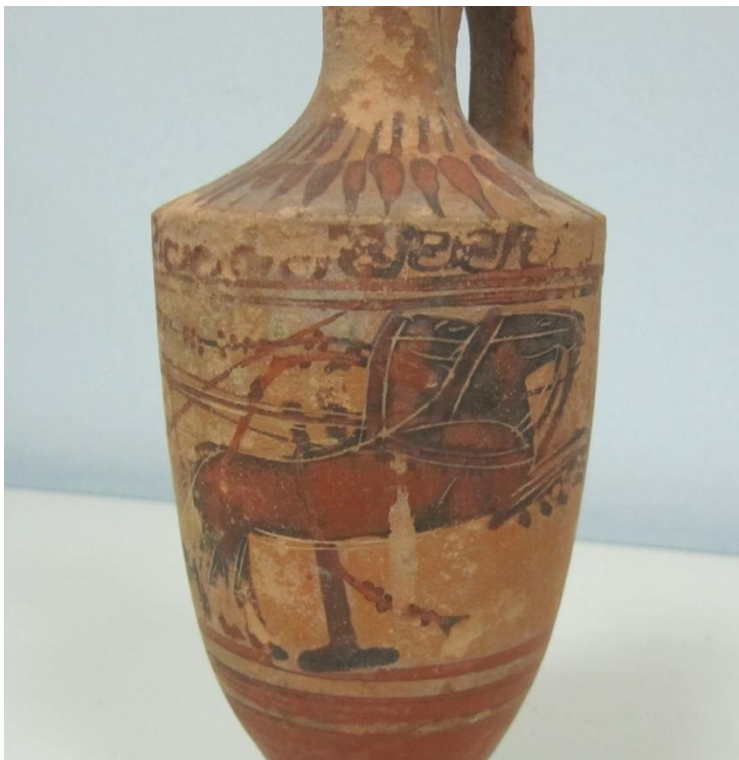
Εικόνα 59: Λήκυθος ΜΑΙΤ 9334, αρ. κατ. 17, λεπτομέρεια.