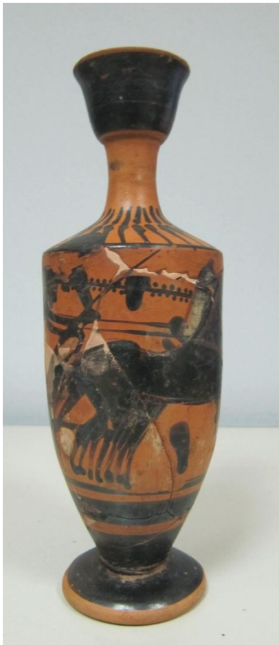
Εικόνα 51: Λήκυθος ΜΑΙΤ 9368, αρ. κατ. 16.