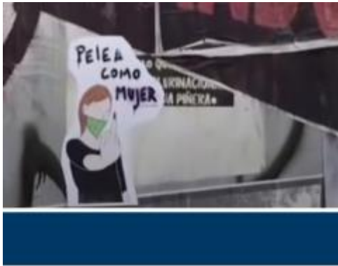
( Fuente:RT en Español. “El grafiti como herramienta de protesta en Chile”.Youtube, 25 Noviembre 2019)