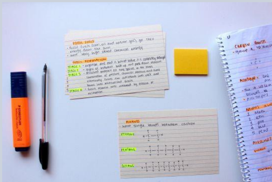
Παράδειγμα καρτών για τη μελέτη

Στην παρακάτω εικόνα βλέπεις ένα παράδειγμα τέτοιων καρτών.