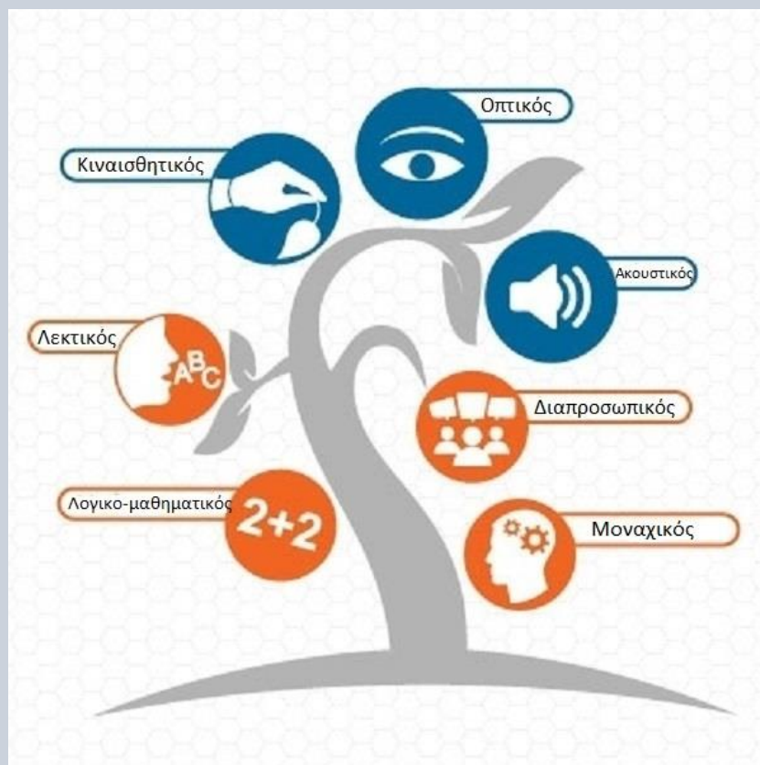
Τα επτά μαθησιακά στυλ

Η περιγραφή αυτών των τύπων θα σε βοηθήσει να αναπτύξεις τον στοχασμό σου πάνω στον τρόπο που μελετάς, δηλαδή να αναπτύξεις τη μεταγνωστική ικανότητά σου, όπως λέγεται στην Ψυχολογία. Στην εικόνα παρακάτω βλέπεις τα επτά μαθησιακά στυλ.