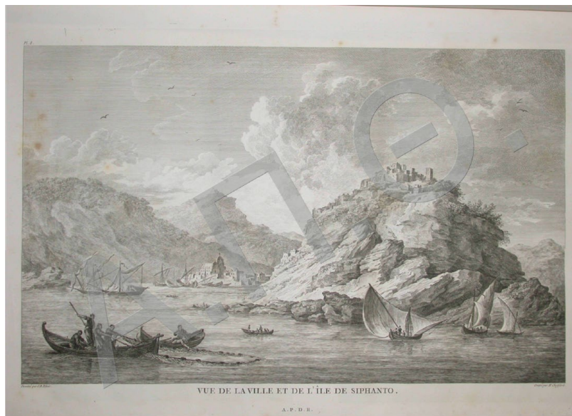
Εικόνα 3 Άποψη της Χώρας και της Σίφνου / Κατά την Βενετοκρατία η Σίφνος είχε πολλές ονομασίες, όπως Σίφνος, Σίφανος, Σιφάνο, Σιφάνα και

Συγκεκριμένα η Σίφνος πέρασε στα χέρια των Γιαννούλη Ντακορόνια (Da Corogna) 43 που την διοίκησαν ως το 1463 που ενώθηκαν οικογενειακά με τους Gozadinni. Η διάρκεια της Φραγκοκρατίας που στη Σίφνο διήρκεσε μέχρι και το 1537 χαρακτηρίζεται από πάρα πολλές διαμάχες μεταξύ των Φράγκων δυναστών των Κυκλάδων όσο και από αδυναμία αποτελεσματικής αντιμετώπισης των Τούρκων πειρατών. 44 Κατά την περίοδο 1537-1617 οι Gozadinni συνέχισαν να διοικούν το νησί όντας όμως φόρου υποτελείς στον σουλτάνο. 45