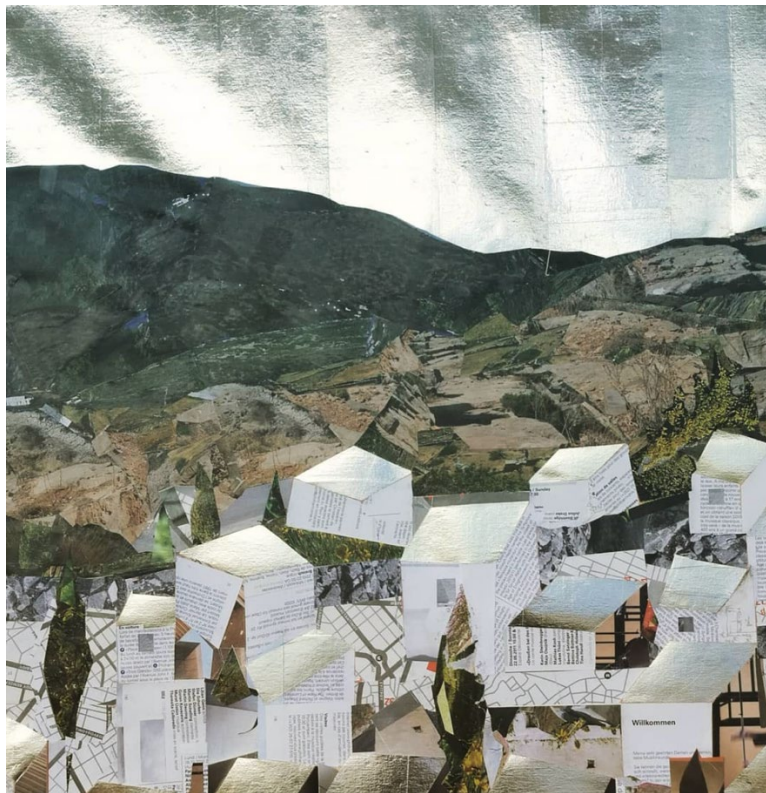
Εικόνα 1: «Οικισμός» Κολλάζ Νίκος Χούτος