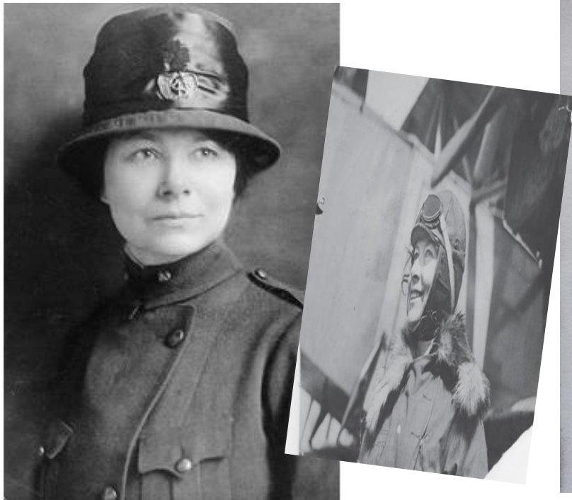
Esther Pohl Lovejoy