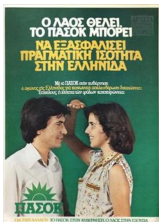
Ο λαός θέλει, το ΠΑΣΟΚ μπορεί να εξασφαλίσει πραγματική ισότητα στην Ελλάδα, 1981. Δημιουργός Πανελλήνιο Σοσιαλιστικό Κίνημα (Π.Σ.Ο.Λ)

Σε περιφερειακό επίπεδο τον Ιούλιο 1983 συστήνονται Νομαρχιακές Επιτροπές Ισότητας, που αφορούν την ενημέρωση και την κινητοποίηση για την επίλυση προβλημάτων της έμφυλης ισότητας 23 , ενώ λίγους μήνες αργότερα, Φθινόπωρο 1983, συστήνονται και Γραφεία Ισότητας για την προάσπιση των ίσων δικαιωμάτων. 24