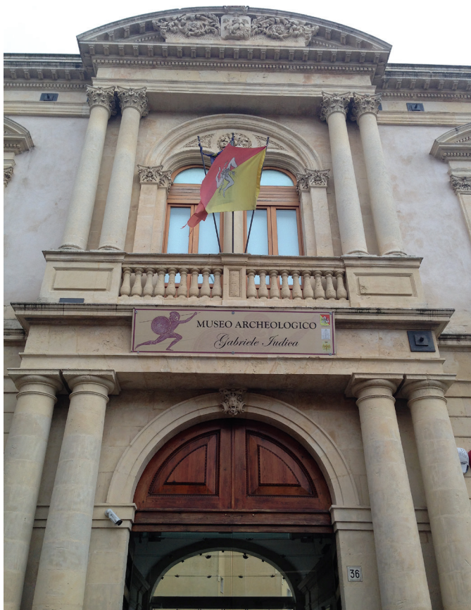
Fig. 2. Palazzolo Acreide, Museo Archeologico "Gabriele Judica".

Come diretta conseguenza degli scavi (e degli acquisiti da tombaroli locali) fu la creazione nelle sale del suo palazzo posto in pieno centro del paese di un piccolo Museo dove esporre la sua collezione archeologica 5 . Sebbene quest'ultima non fosse né la prima, né l'unica a Palazzolo, fu comunque messa generosamente a disposizione dei famosi visitatori stranieri che giungevano in Sicilia per visitarne le bellezze artistiche e naturali.