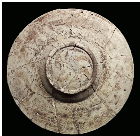
Fig. 3. Piatto ( dish ) ad anello: superficie esterna.