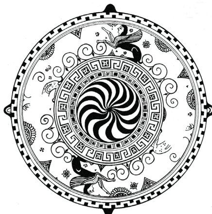
Fig. 4. Piatto ( dish ) ad anello: superficie esterna. DaThasos (Salviat 1978).