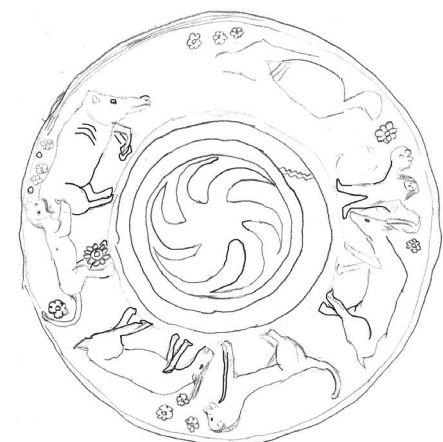
Fig. 6. Schizzo della superficie esterna (disegno Autore).

Lungi dall'aver rivelato ogni particolare sulla sua provenienza, il reperto comunque sia, rimane un'attestazione importante che si unisce al già vasto gruppo di ceramiche di origine orientale rinvenute in Sicilia 12 .