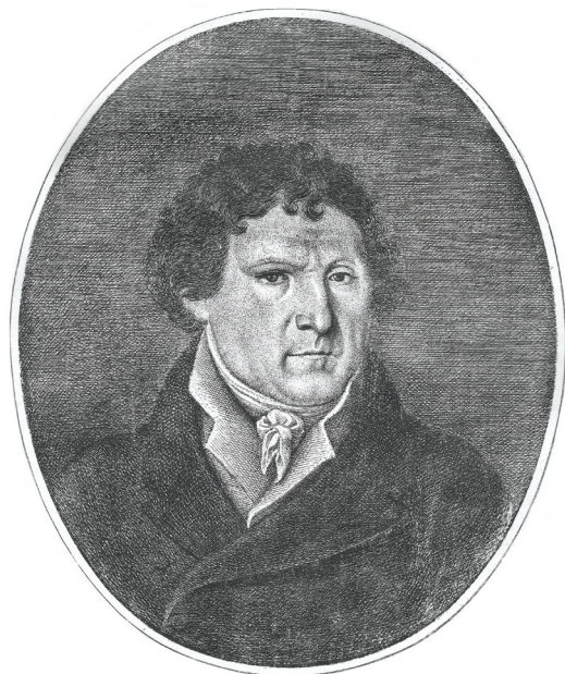
Fig. 1. Ritratto di Gabriele Judica, opera di Giuseppe Politi (Judica 1819).

Agli inizi del XIX secolo il risveglio culturale di Palazzolo fu indelebilmente segnato dalla figura del barone Gabriele Judica 3 (fig. 1). Spinto da sincero amore per le patrie memorie, spese tutta la sua ingente fortuna per finanziare e dirigere i primi scavi archeologici sia sull' Acremonte (dove aveva sede l'antica Akrai ) che nelle necropoli circostanti 4 .