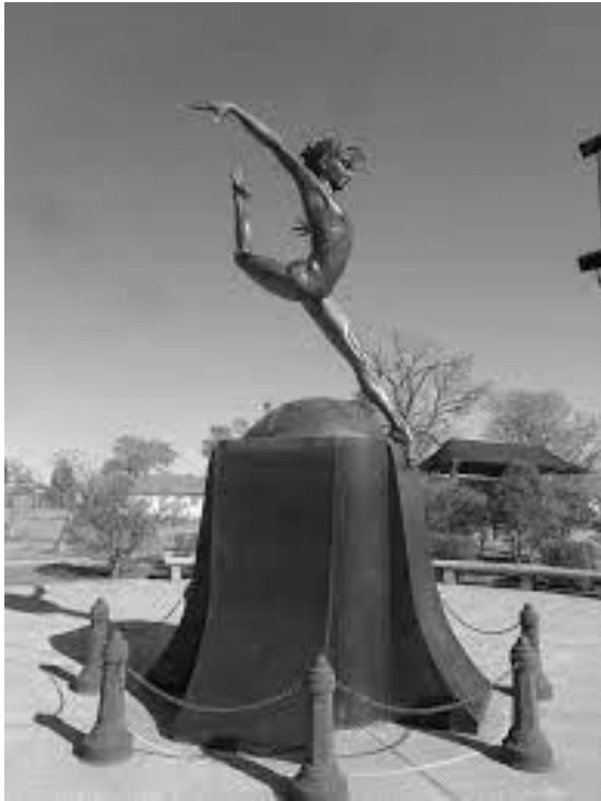
(Εικ. 11. Άγαλμα της S. Miller, Edmont, USA, από https://visitedmondok.com/loc/303/shannon-miller-park.htm )