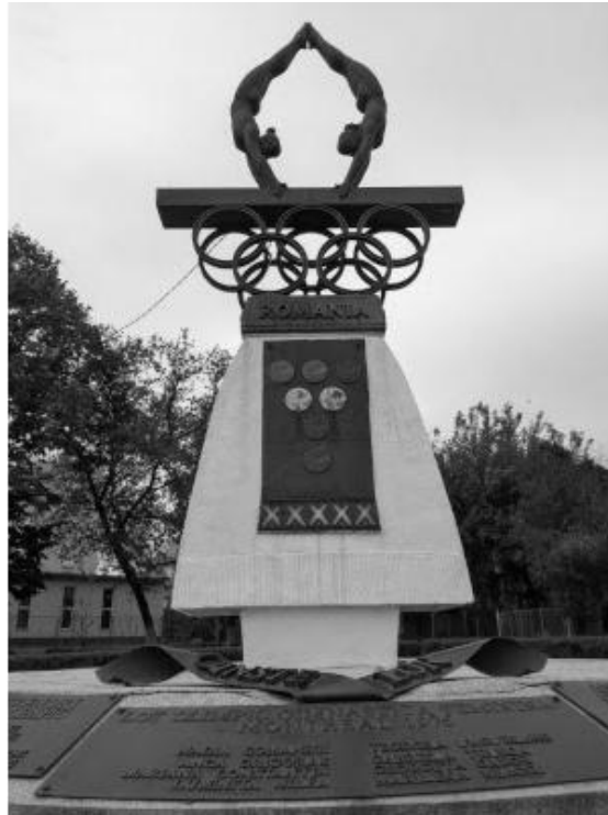
(Εικ. 5. Άγαλμα αθλητριών ενόργανης γυμναστικής, προς τιμή της Comaneci N., Onesti, Romania από: Memorial Nadia Comăneci Montreal in Onesti - WWP (wanderwomenproject.com) )