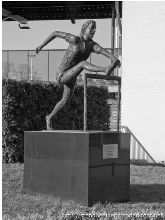
(Εικ. 3β. Άγαλμα της F. Blankers-Koen, Hengelo, Holland ).