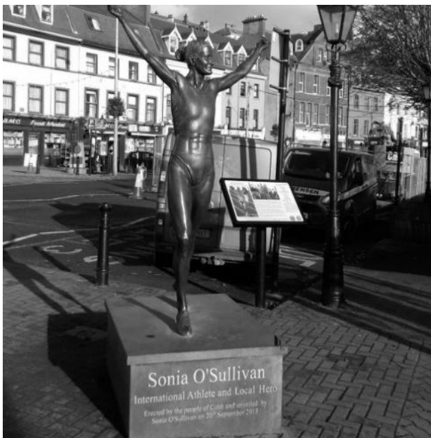
(Εικ. 12. Άγαλμα της S. O'Sullivan, Cobh, Ireland, από https://www.alamy.es/foto-estatua-de-sonia-o-sullivan-atleta-internacional-y-heroe-local-cobh-condado-de-cork-irlanda-la-republica-de-irlanda-139459543.html )