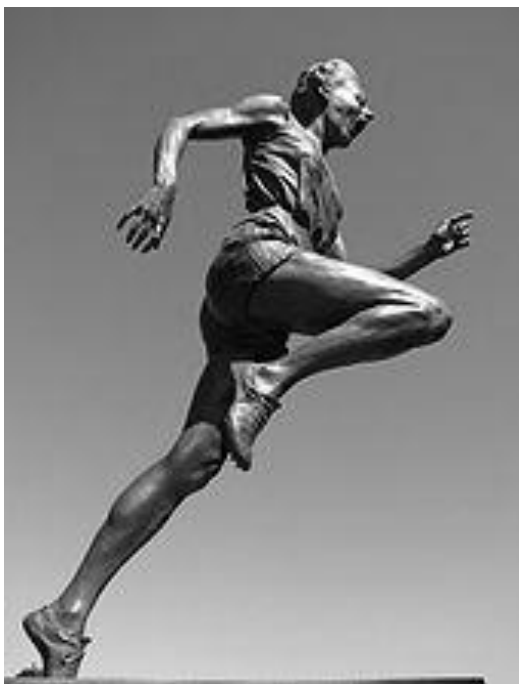
(Εικ. 6. Το Άγαλμα της B. Cuthbert, Melbourne, από https://www.tripadvisor.com/LocationPhotoDirectLink-g255100-d19585283-i480901454-Betty_Cuthbert_Statue-Melbourne_Victoria.html ).