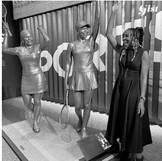
(Εικ. 17. Αγαλμα της Serena & Venus Williams, Washington, USA από:

https://www.gettyimages.com/detail/news-photo/lifesize-statues-of-sisters-venus-and-serena-williams-are-news-photo/605695408 ).