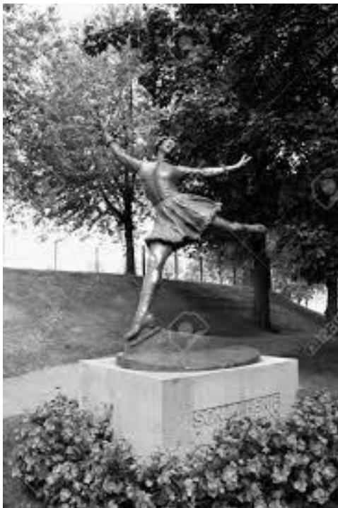
(Εικ. 8. Άγαλμα της Sonja Henie, Oslo, Norway ).