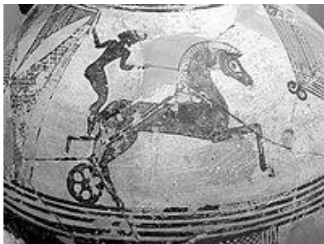
(Εικ.1. Ευρυλεωνίς

).