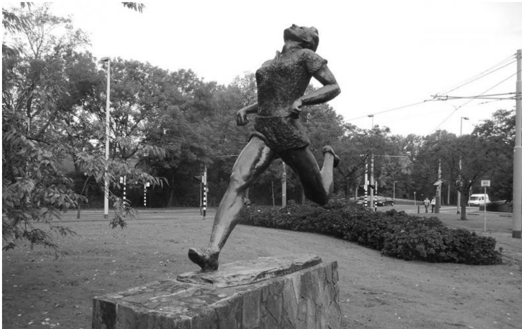
( Εικ. 3α . Το Άγαλμα της F. Blankers-Koen, Rotterdam, από https://en.wikipedia.org/wiki/Fanny_Blankers-Koen#/media/File:Blankers_koen.JPG ).