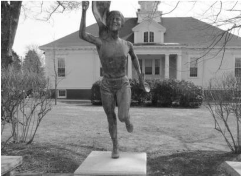
( Εικ.2 . Άγαλμα της Benoit Samuelson J., Cape Elizabeth, USA )