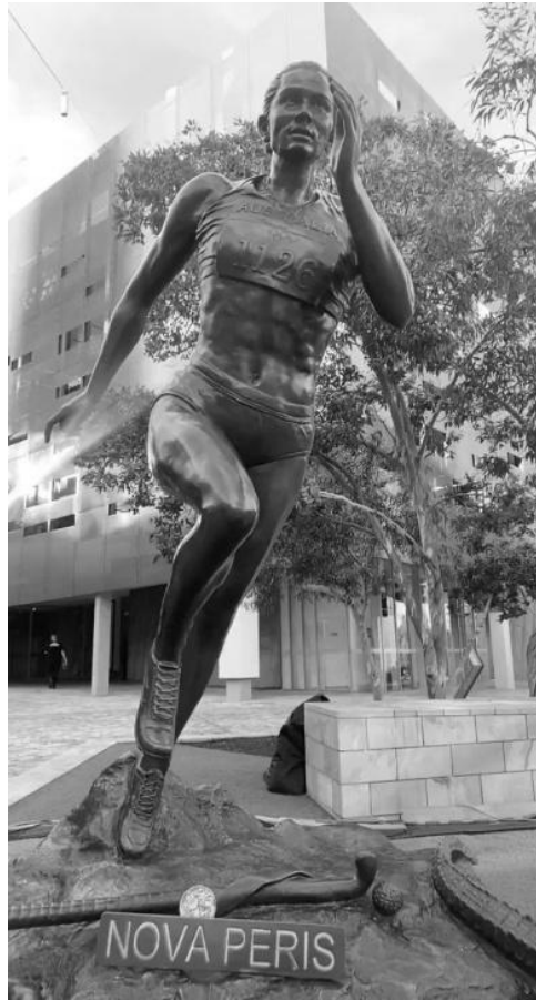
(Εικ. 13. Άγαλμα της N. Peris, Melbourne, από: https://gillieandmarc.art/products/nova-peris )