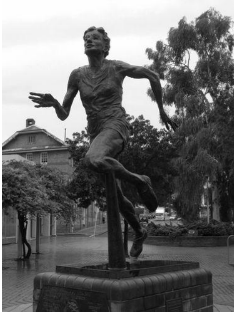
(Εικ. 9. Αγαλμα της Jackson-Nelson, M., Adelaide, Australia

)