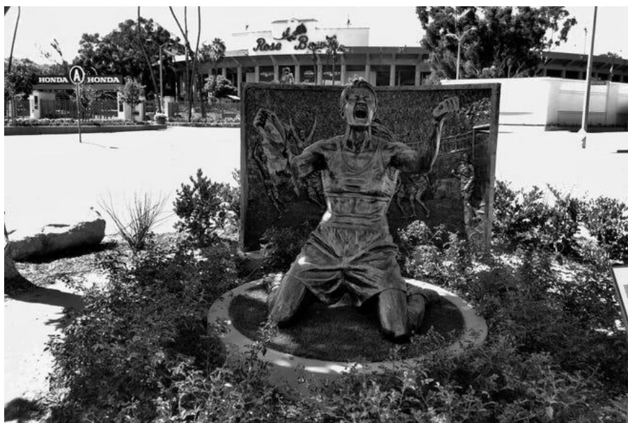
(Εικ. 4. Άγαλμα της Chastain B., Pasadena, USA)