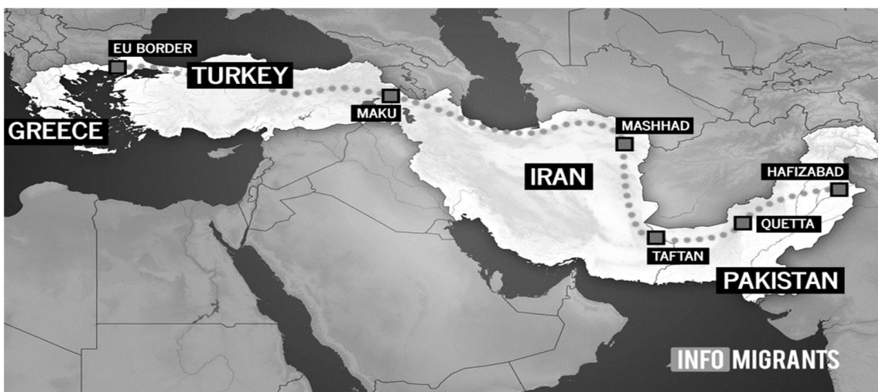
Εικόνα 1: Μεταναστευτική οδός από το Πακιστάν προς την Ελλάδα