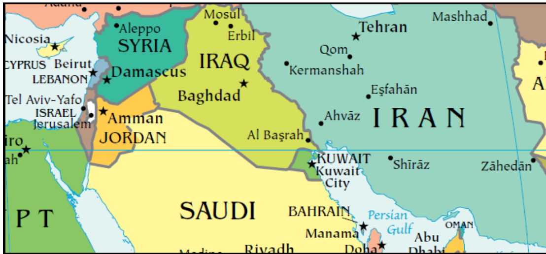
Χάρτης 2. Πολιτικός χάρτης Συρίας-Ιράκ-Ιράν.