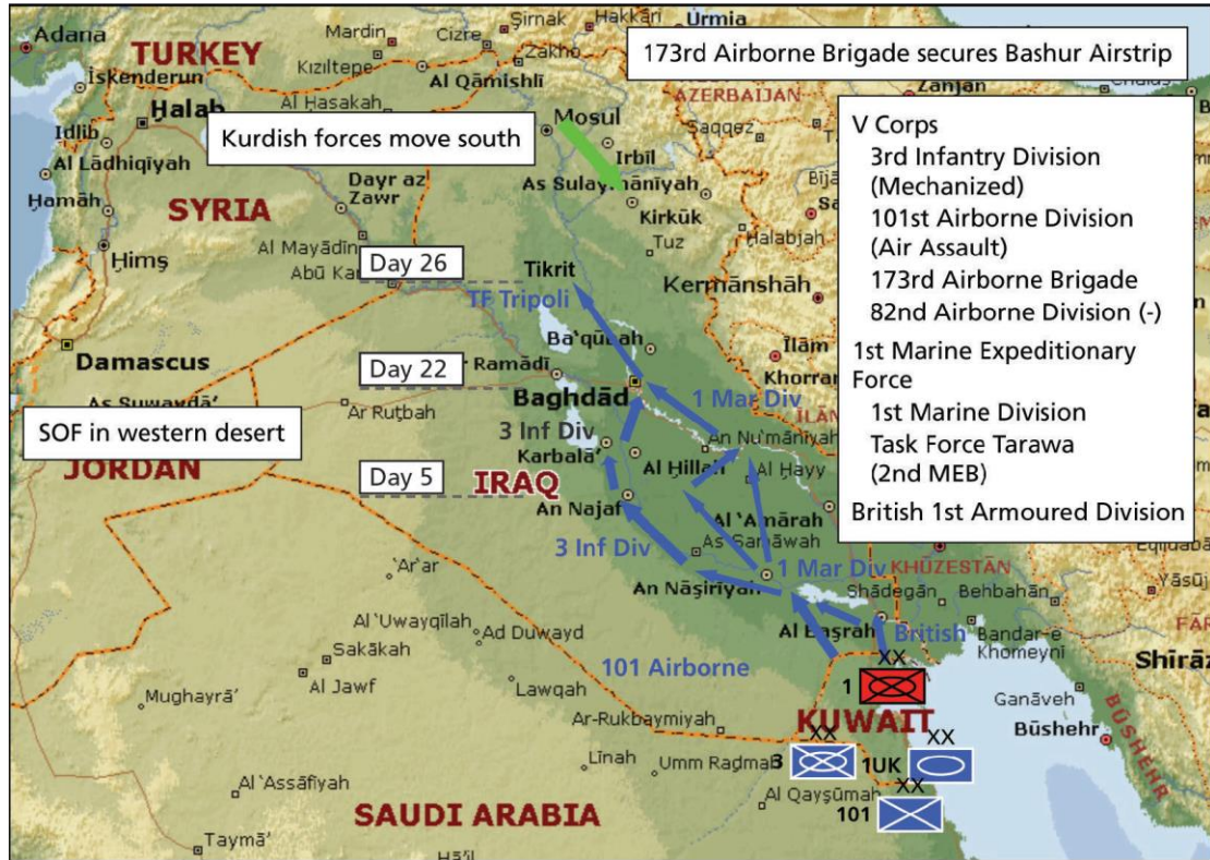
Χάρτης 4. Χάρτης της επιχείρησης Iraqi Freedom για την περίοδο 19/03/2003-14/04/2003