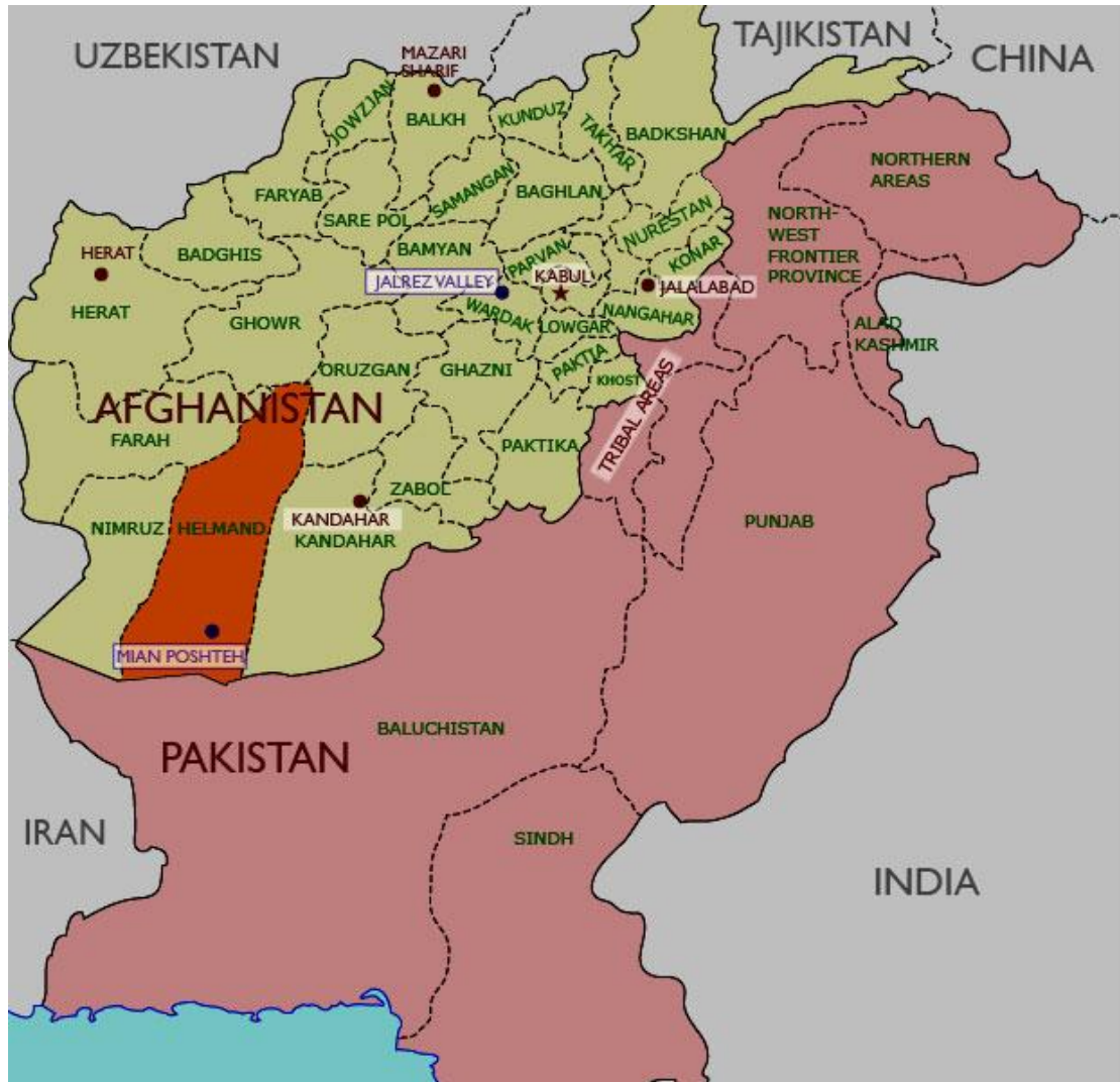
Χάρτης 1. Χάρτης Αφγανιστάν-Πακιστάν.