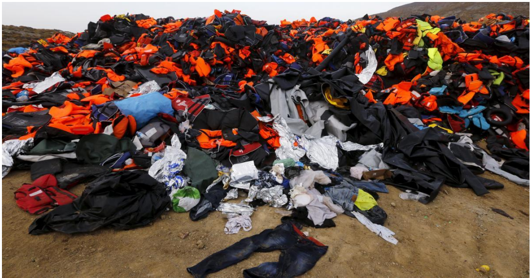
Εικόνα 3: Σωσίβια παράτυπα εισερχόμενων εκ Τουρκίας στο νησί της Λέσβου, 2015.