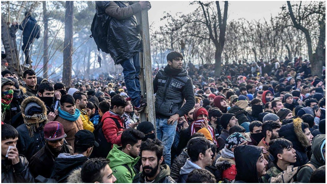
Εικόνα 2: Μετανάστες μετά τη μεταφορά τους στα ελληνο-τουρκικά σύνορα από τουρκικές δυνάμεις τον Μάρτιο του 2020.