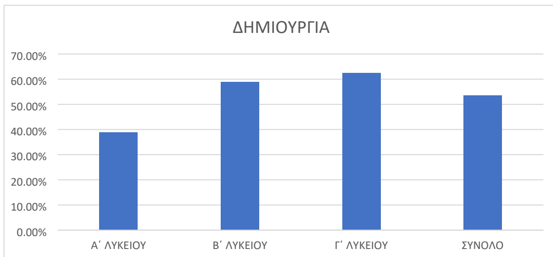
Διάγραμμα 3. Λέξη-κλειδί «κόσμος»