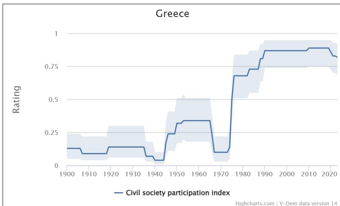
Διάγραμμα 2. Η συμμετοχή σε φορείς της κοινωνίας των πολιτών στην Ελλάδα